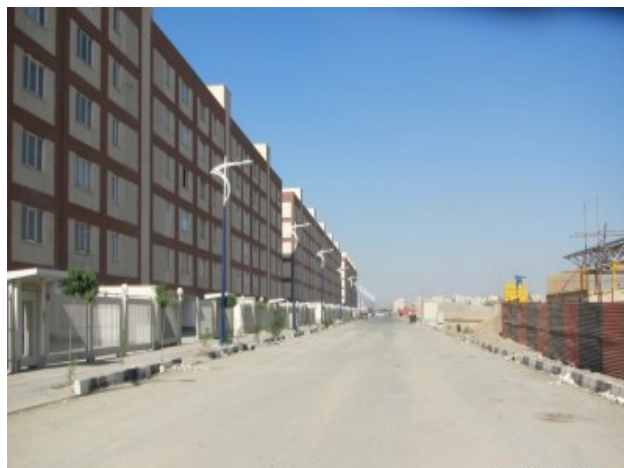
تصویر ۸: اولویت‌دهی به حرکت سواره و نفی هرگونه فضای جمعی و عمومی در ردیف ساختمان‌ها، مسکن مهر تهرانسر. عکس: سینا ناصری، ۱۳۹۴.

حضور در شهر، موجب می‌شود تا لایه‌های مختلفی برای منظر تشخیص داده شود (منصوری، ۱۳۸۹). نوشهرهای مسکن مهر بدون هیچ سابقه سکونت، عاری از هرگونه ردپای تاریخی و رد تعامل انسان با محیط در فضای بیرونی است. از طرفی منظر شهری، مفهوم آن و دستورالعمل‌های اجرایی‌اش هیچ‌گاه در سابقه مطالعات توسعه شهری وجود نداشته و از این‌رو کیفیتی به اسم منظر شهری نیز ایجاد