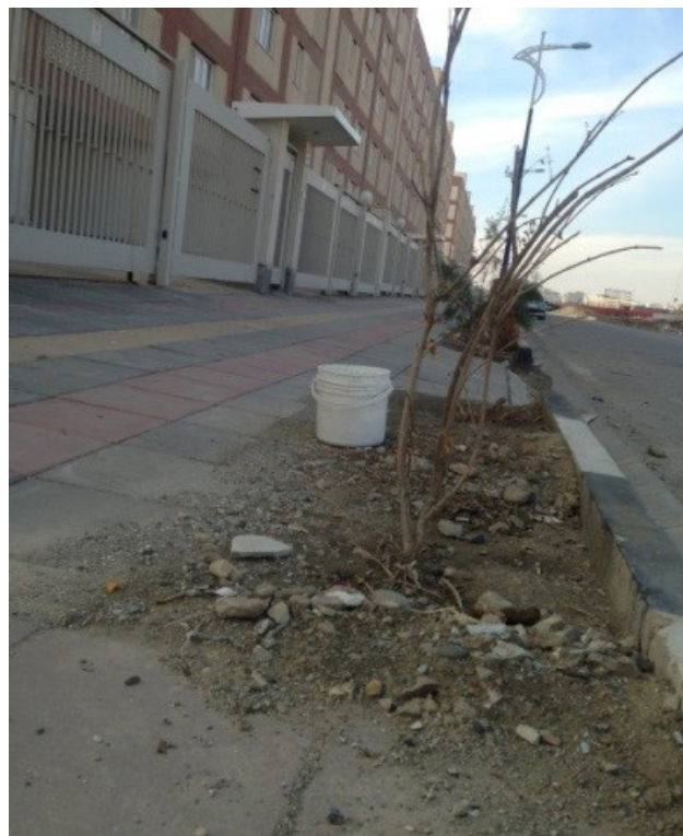
تصویر ۷: کاشت حداقلی درخت و تعبیر فضای سبز از آن به زعم طراحان، مسکن مهر تهرانسر. عکس: سینا ناصری، ۱۳۹۴.

با توجه به بررسی آسیب‌شناسانه انجام‌شده در طرح مسکن مهر و نواقصی که شرح داده شد، به نظر می‌رسد ملاک عمل در طراحی این پروژه جای‌گذاری حداکثری بلوک‌های مسکونی و استفاده بیشینه و نه بهینه از سرانه فضایی جهت تأمین حداکثر تعداد واحدهای مسکونی بوده است. در این میان جنبه‌های کیفی زندگی ساکنان هم در بُعد اجتماعی و هم در بُعد کالبدی، اعم از دید و منظر، ایجاد روابط اجتماعی و امکان بازتولید خاطره جمعی، به دست فراموشی سپرده شده است. این الگو تا به امروز نتیجه‌ای جز تولید فضاهای بی‌هویت، بی‌شکل، فاقد قلمرو، بی‌روح، یکنواخت و فاقد سازمان مشخص فضایی، دربر نداشته است. نگرش دانش منظر به مقوله پروژه‌های مسکن انبوه و محیط پیرامونی، نگرشی همگام با برنامه‌ریزی همه‌جانبه‌نگر و انعطاف‌پذیر است که به جای تمرکز یک بُعدی و بخشی، با تلفیق لایه‌های مختلف فضایی و کالبدی، به دنبال رهیافتی جهت شکل‌دهی پروژه با رویکرد منظرین دو گانه تنوع-تکثر هم درفاسازی و هم منظره‌سازی در مقابل یکنواختی حداکثری موجود است که هرگونه فردیت را نفی می‌کند. برون‌رفت از وضع کنونی در گروهی توجه به اقدامات عملی منتج از رویکرد منظرین پروژه در راستای حیات‌بخشی مجدد و بازیابی هویت جمعی ساکنان و ایجاد انگیزش جهت مانایی در مکان خواهد بود. لذا اقدامات زیر می‌تواند منتج از رویکرد منظر به عنوان