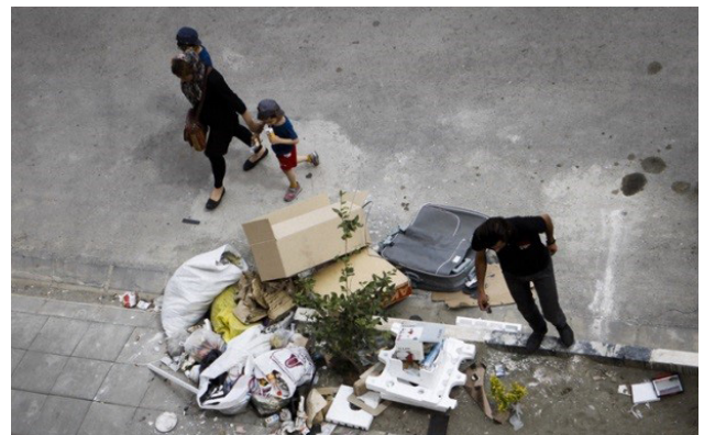
تصویر ۲: عدم وجود زیرساخت‌های مناسب شهری، مسکن مهر تهرانسر.