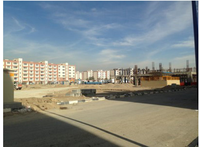
تصویر ۴: تراکم ناموزون، ایجاد یک پهنه خدماتی وسیع و متمرکز و تراکم بالای ساختمانی.

ایجاد رونق‌بخشی و پویایی محیط ایفا می‌کنند. وجود این فضاهای مکث می‌تواند به کنش‌های تعاملی میان ساکنان منجر شود. اما متأسفانه با توجه به فقدان برنامه‌ریزی مناسب در این خصوص و توجه به استفاده حداکثری از اراضی جهت جانمایی بیشینه تعداد واحدهای مسکونی، این اصل مهم به دست فراموشی سپرده شده و آنچه از عرصه باقی می‌ماند به عنوان مسیرهای ارتباطی با الویت حرکت سواره اختصاص داده می‌شوند، و عملاً فضاهای انسان محور، که شرط لازم ارتقای سطح کیفی فضا هستند در برنامه طراحی جایی ندارند (تصویر ۸).