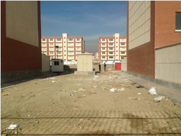
تصویر ۵: عدم تعریف بستر مناسب جهت شکل‌گیری فضاهای اجتماعی. عکس: سینا ناصری، ۱۳۹۴.