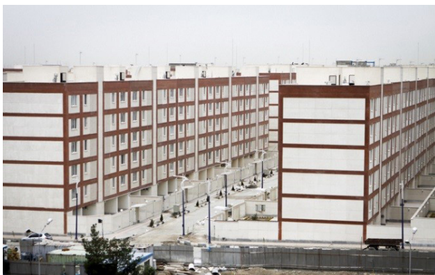
تصویر ۳: بلوک‌های ساختمانی یک شکل بدون هیچ شاخصه‌ای جهت ایجاد تمایز موجبات بی‌روحي فضا را به دنبال داشته است، مسکن مهر تهرانسر.

یکی دیگر از ابعاد آسیب‌شناسانه کالبدی طرح، عدم تنوع کاربری‌ها و تک‌عملکردی بودن محوطه این