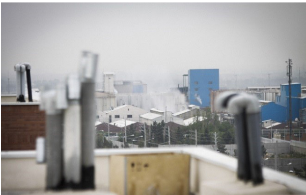
تصویر ۶: قرارگیری سایت مسکن مهر تهرانسر در پهنه صنعتی شهر. مجاورت این پروژه با کارخانجات مشکلاتی را برای ساکنان رقم زده است.

منظر شهر، ادراک شهروندان از شهر است که از خلال نمادهای آن به دست می‌آید؛ وابستگی فهم منظر به سابقه