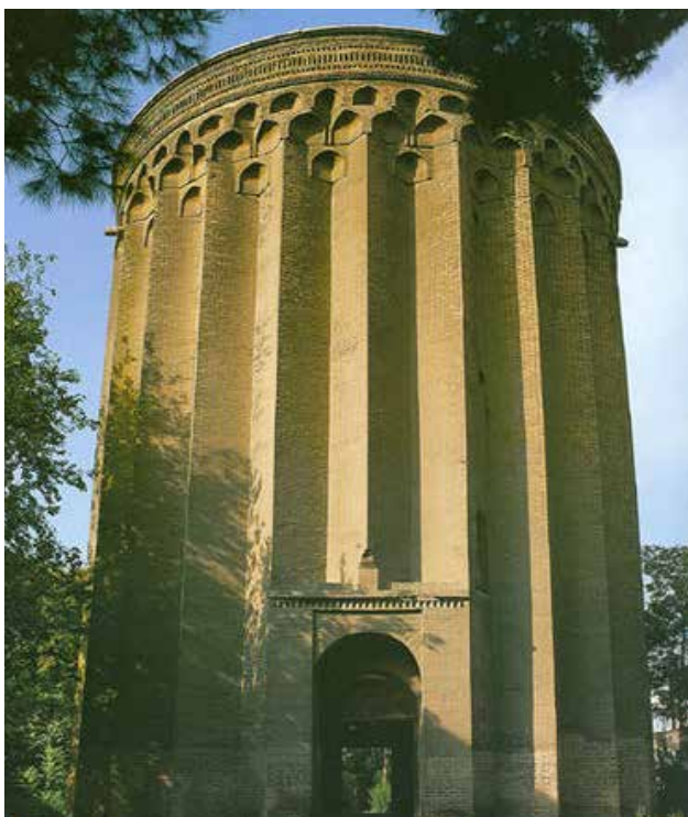
تصویر ۵: برج طغرل.

برج آرامگاه طغرل در شرق آرامگاه ابن‌بابویه در شهری واقع شده است که از آثار برج‌های مانده از دوره سلجوقیان است. این برج بدون احتساب گنبد مخروطی شکل که امروز اثری از آن باقی نمانده است، حدود بیست متر ارتفاع دارد. وجه تسمیه این برج به طغرل بیک یکم بازمی‌گردد.