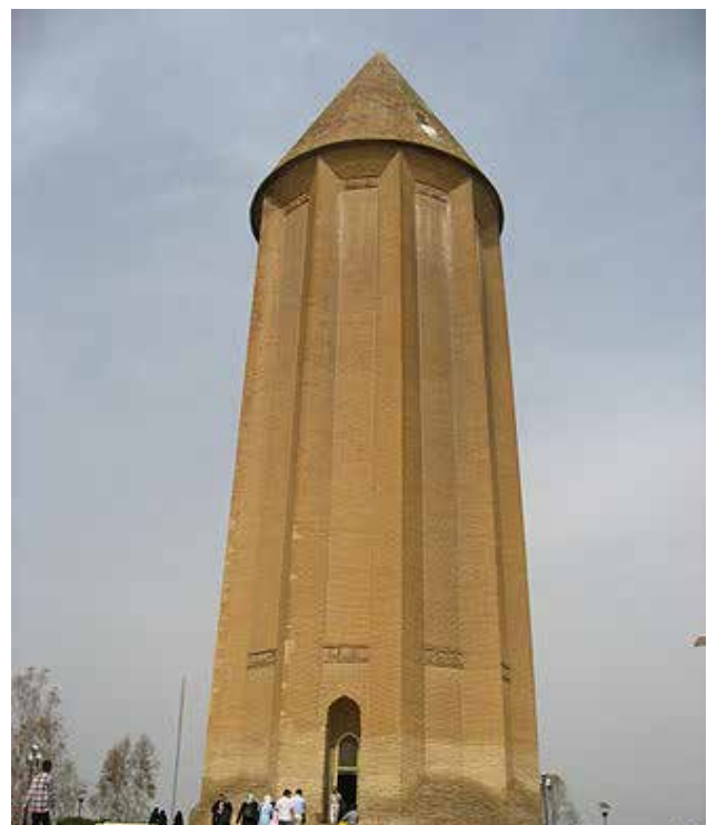
تصویر ۴: برج قابوس بن وشمگیر.