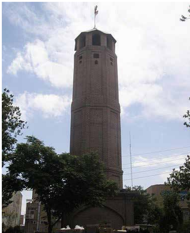
تصویر ۳: برج آتش‌نشان تبریز.

آب) مانند برج «آب» بانک ملی (سازمان میراث فرهنگی و گردشگری، ۱۳۷۵)، سرداب «برج آرامگاهی شاهزاده حسین» (سازمان میراث فرهنگی و گردشگری، ۱۳۸۰ الف) و برج‌هایی که به منظور خاصی مثلاً اهدای خلعت به افراد خاص احداث شده بودند، مانند برج «خلعت‌پوشان» در استان آذربایجان شرقی (سازمان میراث فرهنگی و گردشگری، ۱۳۷۷ ب) اشاره کرد. گروه دیگری از برج‌ها، کارکرد سنجش زمان را داشته‌اند؛ چه از نظر نشان‌دادن ساعات روز، چه ماه و سال، مانند «برج ساعت» در استان گیلان (سازمان میراث فرهنگی و گردشگری، ۱۳۵۶). گروه دیگری از برج‌ها در علم نجوم کاربرد داشته‌اند؛ هم در ستاره‌شناسی و هم رصدخانه، مانند «برج طغرل» در شهر ری (سازمان میراث فرهنگی و گردشگری، ۱۳۱۰). گروه دیگر برج‌های اقامتگاهی بوده‌اند که یا کاروان‌سرا بودند مانند برج «چاه‌خور» (سازمان میراث فرهنگی و گردشگری، ۱۳۸۵ ب) یا قلعه، مانند «برج امان‌الله» در استان کرمان (سازمان میراث فرهنگی و گردشگری، ۱۳۸۴ ج) یا کاملاً مسکونی بوده‌اند، مانند برج «بمونی آقا» در استان خوزستان (سازمان میراث فرهنگی و گردشگری، ۱۳۸۴ هـ). دسته آخر این برج‌ها کوره‌ها بوده‌اند، مانند برج «شوشتری» در استان فارس (سازمان میراث فرهنگی و گردشگری، ۱۳۸۶).