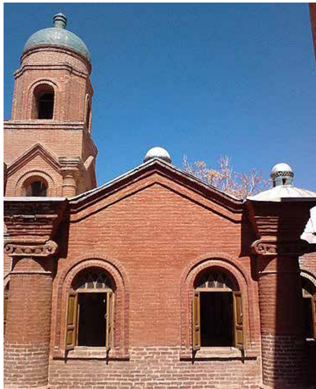
تصویر ۲: برج ناقوس کلیسای قزوین.

از جمله کارکردهای برج می‌توان به کارکردهایی چون کبوترخانه‌ها مانند برج «آقا» در استان اصفهان (سازمان میراث فرهنگی و گردشگری، ۱۳۸۵ الف)، آبیاری (حفظ فشار