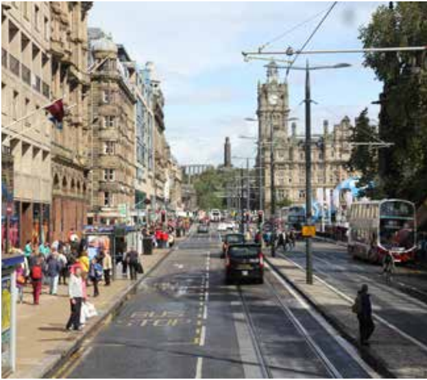
تصویر ۲: خیابان پرنسس در شهر ادینبورگ. عکس: امین لطف‌اللهی‌یقین، ۱۳۹۳.