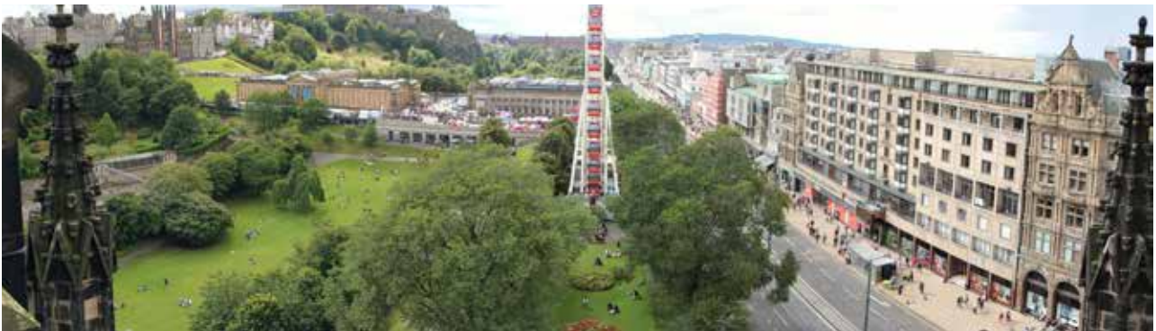
تصویر ۵: دید از شرق به غرب و پهنه سبز و فضای جمعی مقابل گالری‌های هنر ملی که نمایی از شمال خیابان پرنسس در آن قابل مشاهده است. عکس: امین لطف‌اللهی یقین، ۱۳۹۳.

برای سامان‌دهی پیاده‌راه‌ها عبارت‌اند از ایمنی، امنیت، راحتی، پیوستگی، کوتاهی، آسایش، انسجام سیستم، جذابیت و زیبایی (منصوری و همکاران، ۱۳۹۱). در این میان با توجه به پتانسیل‌های موجود و حضور مردم به صورت فعال در خیابان پرنسس موجبات ایجاد سیاست‌ها و اقداماتی برای بهبود وضعیت خیابان و عابران پیاده صورت پذیرفت که از آن جمله محدود شدن بار ترافیکی این خیابان به ترامواها و وسایل نقلیه عمومی بود که آن را تبدیل به یک خیابان پیاده‌مدار کرد. به این معنی که برقراری تعادل میان حضور خودرو و عابر پیاده (انسان‌محور) از راه حمایت از تردد عابر پیاده با تقسیم‌بندی سطوح شهری به پیاده و سواره، با هدف پایداری محیط، مورد توجه قرار گرفته است. به این ترتیب می‌توان گفت ارتقاء قلمروی عمومی در امتداد خیابان پرنسس نشان‌دهنده افزایش فرصت برای امکان تغییر فضای شهری، به نفع مردم است. موفقیت خیابان پرنسس بستگی به ماهیت و کیفیت عرصه خرده‌فروشی یا صرف پیاده‌راه آن ندارد، بلکه حضور مردم موجب موفقیت آن شده و به‌علاوه جذابیت، پیوستگی و دسترسی ایمن و راحت به این فضا نیز، از عوامل موفقیت این خیابان بوده است. با در نظر گرفتن این جنبه‌ها در جدول ۱ به برخی سیاست‌ها و اقدامات صورت گرفته برای سامان‌دهی و بهبود ظاهر، جذابیت، نفوذپذیری و دسترسی خیابان که موجبات آسایش و ایمنی افراد پیاده شده، اشاره شده است.