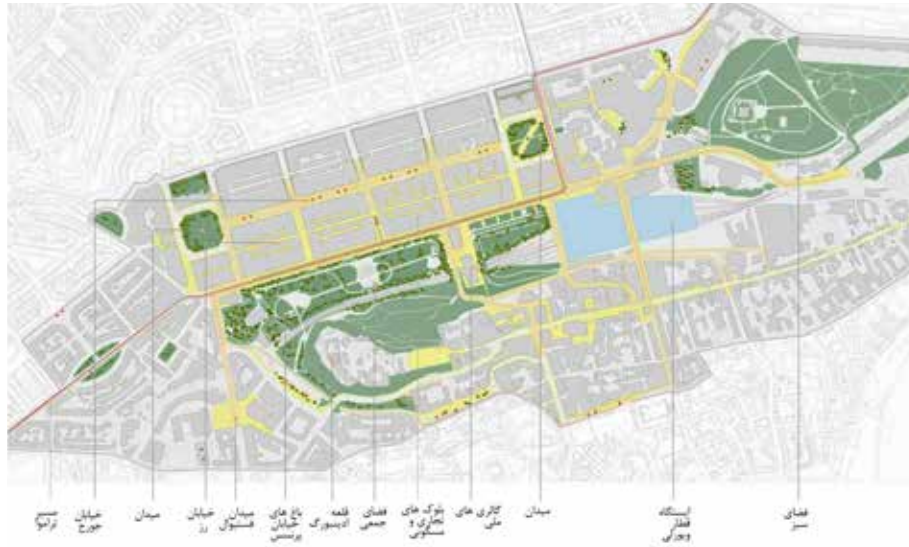
تصویر ۴: تنوع کاربری‌ها با رعایت اصل سازگاری در خیابان پرنسس در شهر ادینبورگ.