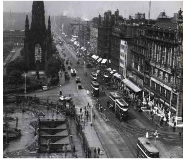
تصویر ۱: کارآمد بودن و حضور افراد در فضا در خیابان پرنسس.

شهری مناسب (امکانات) توانسته است تا حد زیادی امنیت، جذابیت و در نتیجه کیفیت فضایی مناسبی را فراهم کند.