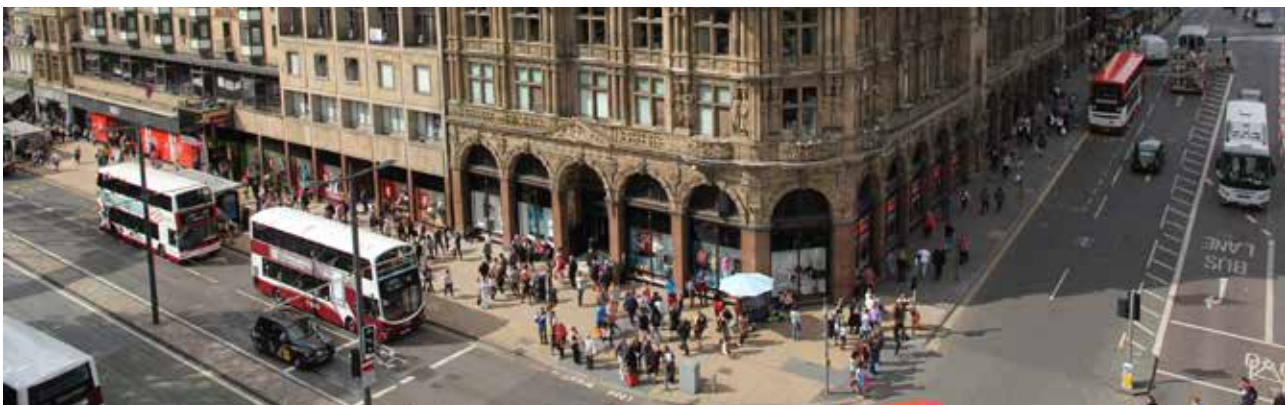
تصویر ۶: جبهه شمالی خیابان پرنسس با جداره‌های تجاری (پیوستگی مسیر).