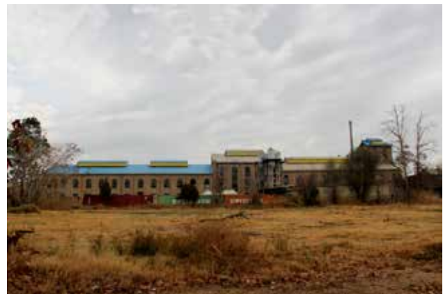
تصویر ۱: کارخانه تصفیه‌خانه قند ورامین. عکس: امیرعلی قنبری، ۱۳۹۵.