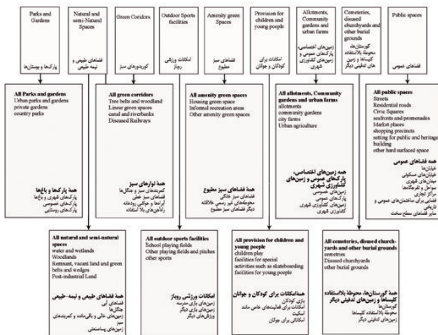
نمودار ۱. دسته بندی فضاهای باز و زیرمجموعه های آن Diagram 1. Grouping open spaces and subsets of them