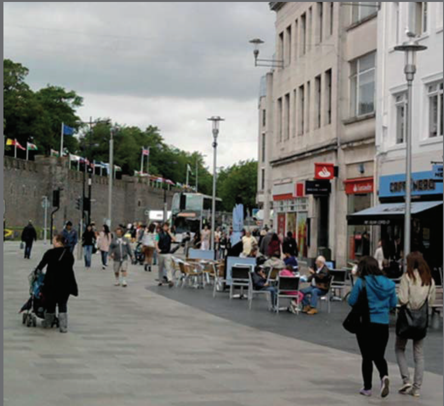
تصویر ۳ Pic3

تصویر ۳ : خیابان های پیاده‌پسند محلی برای مکث و تعاملات اجتماعی است، کاردیف، ولز، عکس : امید ریسمان چیان، ۱۳۸۹.