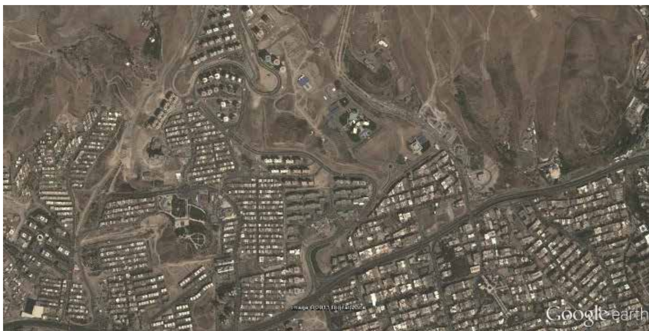
تصویر ۳: عکس هوایی از کوی فراز در منطقه سعادت‌آباد.

در منطقه فراز به دلیل کمبود خدمات حمل‌ونقل عمومی، استفاده از خودروهای شخصی به‌شدت به چشم می‌خورد. هرچند تقویت فرصت‌های استفاده از دوچرخه می‌تواند به روانی حرکت و کاهش آلودگی‌های زیست‌محیطی منجر شود. کاربری منطقه غالباً به‌صورت مسکونی و آن‌هم در قالب مجموعه‌های عظیم سکونت‌گاهی است. تک‌کاری بودن محله سبب افزایش رفت‌وآمدها به خارج از آن شده است. به دلیل فاصله میان محل کار و سکونت، رونق محله در طول روز کاهش‌یافته و به‌شدت خلوت می‌شود. از دیگر پیامدهای بالا بودن نرخ آلودگی می‌توان به افزایش