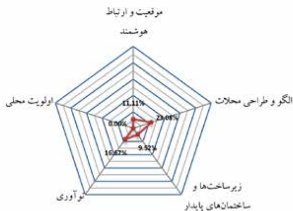
تصویر ۴: امتیاز نهایی کوی فراز.

شهرها و آبادی‌های ایران در طول تاریخ نماینده توسعه و تکامل بوده‌اند. ویژگی‌های این آبادی‌ها می‌تواند هر کدام به‌عنوان درس‌هایی برای طراحان امروزی به‌کار آید. حال آنکه متأسفانه نه تنها به این آموزه‌ها توجهی نشده، بلکه شهرهای ما با دوری از الگوهای پیشین خود، با ساخت‌وسازهای غیر متعادل و زیاده‌روی در مصرف منابع به سمت تباهی و تخریب محیط پیرامون خود گام برداشته‌اند. مقاله حاضر در راستای معرفی میزان پایداری محلات شهری