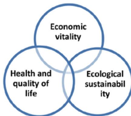
تصویر ۱: نمودار توسعه پایدار.