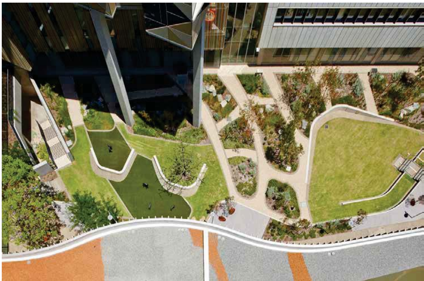
تصویر ۴: تلفیق فضاهای سبز با مسیرهای عمومی به گونه‌ای است که در ارتباط باهم یک کل را به وجود آورده‌اند و در نظر گرفتن آنها به صورت مستقل، بی‌معنی و بی‌هویت به نظر می‌رسد

طراح از هر امکانی برای برقراری ارتباط انسان با طبیعت، استفاده کرده است. به عنوان مثال می‌توان به طراحی بازشو اتاق‌های بستری به سمت مناظر طبیعی و طراحی فضاهای سبز در طبقات اشاره کرد. تراس‌های مسقف در این مجموعه از جمله فضاهای انعطاف‌پذیر است که امکان استفاده از آن در تمام فصل‌های سال و برای تمام بیماران وجود دارد. این تراس‌ها فضای مناسب برای قرار دادن تخت‌های بستری، فعالیت‌های کاردرمانی و استراحت کارکنان و همراه بیمار محسوب می‌شود (تصویر ۸). ایده تلفیق فضاهای طبیعی در داخل ساختمان نه تنها موجب تنوع و افزایش کیفیت فضای داخلی بیمارستان می‌شود، بلکه عاملی است برای ایجاد محیطی آرامش‌بخش که موجب بهبود شرایط روحی همه می‌شود ۵ . پروفیسور استنلی پژوهشگر در زمینه سلامت عمومی