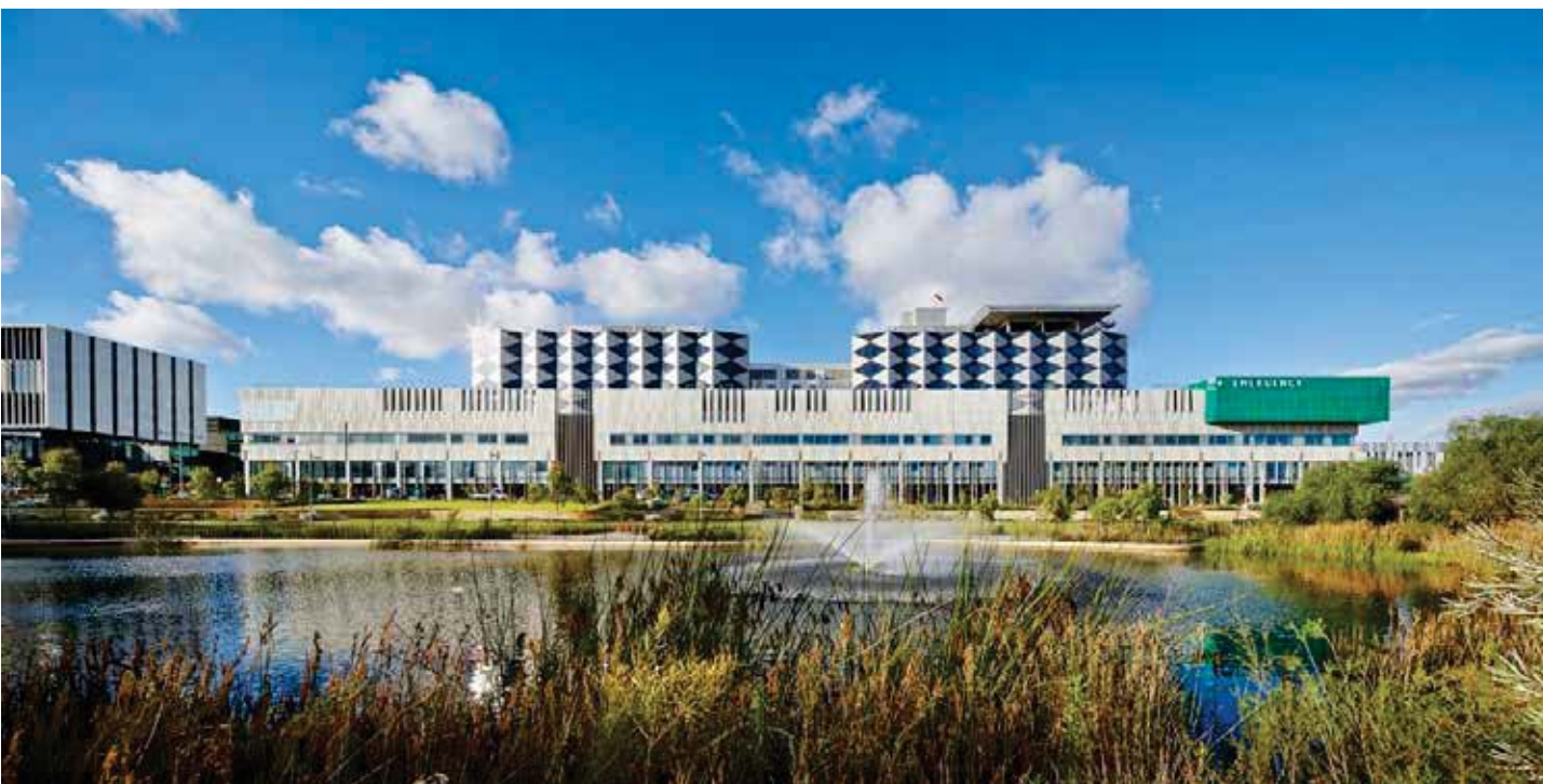
تصویر ۱: بیمارستان فیونا استنلی، مأخذ: www.Landezine.com

آرامش بخش و فرح بخش است و موجب بهبود وضعیت سلامتی روحی و جسمی بیمار می شود (تصاویر ۶ و ۷)؛ (نقل به مضمون از داوطلب نظام وظیفه و متین، ۱۳۹۲: ۳). علاوه بر فضاهای جمعی، طراحی مسیرها با فرم‌های ارگانیک، تلفیق آن با طبیعت بومی، ایجاد کریدورهای دید و حفظ ارزش‌های بصری در سایت از جمله اقدامات دیگر در مقیاس کلان است که برای ایجاد یک فضای شفابخش راه حلی مناسب به نظر می‌رسد. در مقیاس خرد نیز می‌توان به مبلمان‌های متنوع و متناسب با نیاز و وضعیت جسمی بیماران، نورپردازی خوانا، کف‌سازی هماهنگ و پلان کاشت بومی اشاره کرد که هر جزء در ارتباط با سایر اجزاء یک کل را به وجود آورده است. برنامه‌ریزی و طراحی این سازمان فضایی همراه با سلسله‌مراتب طراحی، حس امنیت توأم با کنجکاوای را القا می‌کند در نتیجه بیمار انگیزه بیشتری برای حضور در سایت خواهد داشت. این راهکار به گفته «اولریش» ۳ می‌تواند علاوه بر بهبود بیمار، به درمانگر نیز کمک کند تا از منظر به عنوان عاملی برای بهبود و اندازه‌گیری روند آن استفاده کند. ۴ طراحی با توجه به نیازهای اولیه همه افراد مانند استراحت، تعاملات اجتماعی و... یکی دیگر از اصول طراحی فضاهای