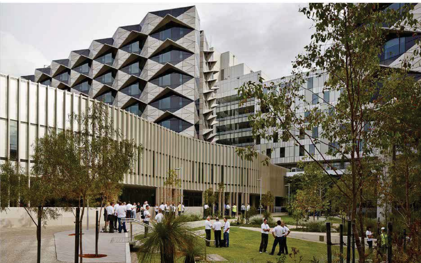
تصویر ۶: فضاهای جمعی.