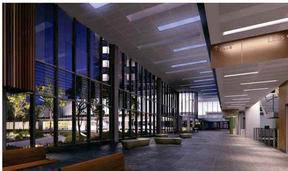
تصویر ۷: نمایی از فضاهای جمعی در داخل ساختمان