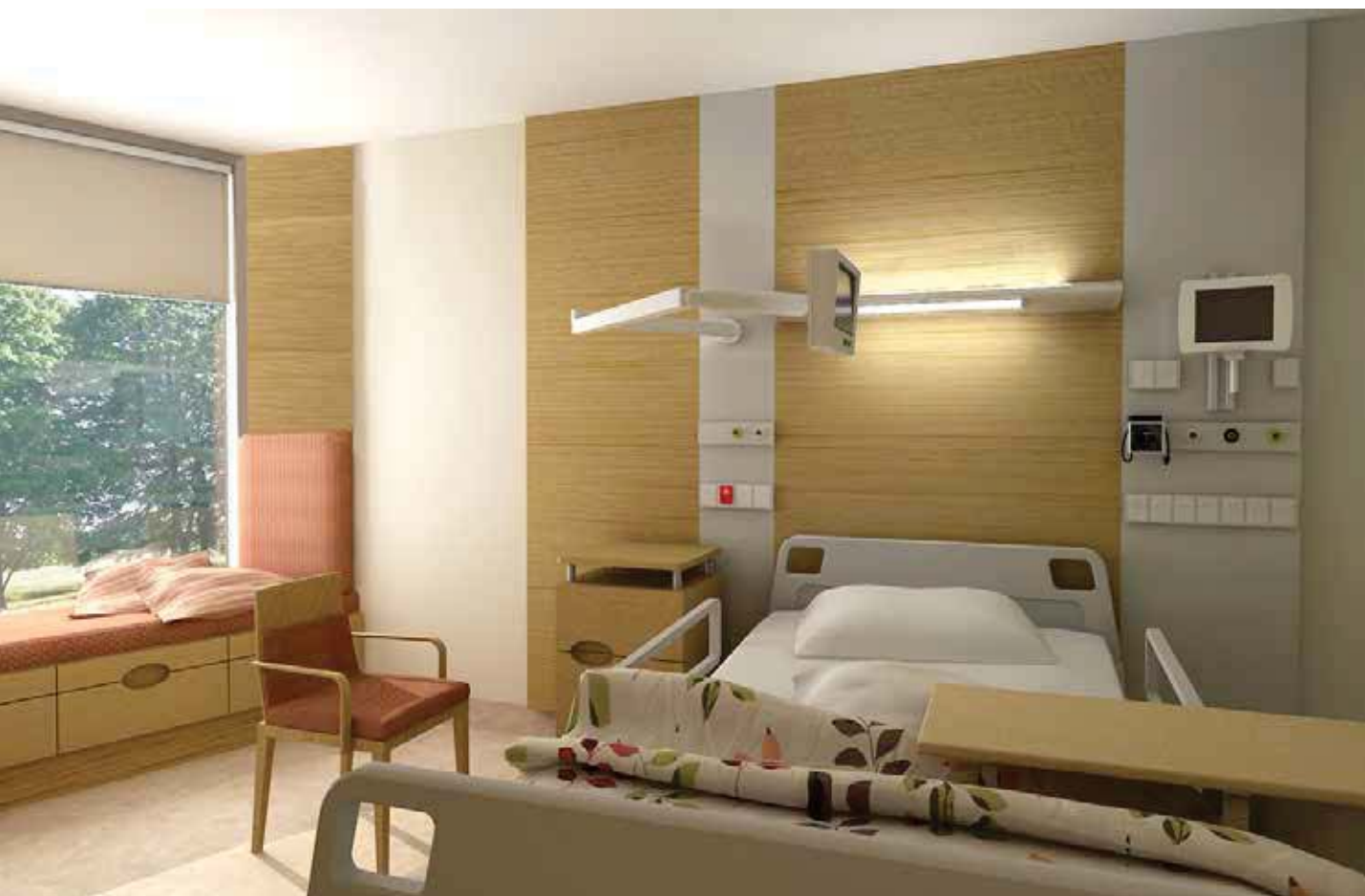
تصویر ۹ : با ایجاد بازشوهایی به سمت مناظر اطراف امکان دیدن فضاهای طبیعی برای بیمارانی که امکان حرکت در سایت را ندارند، فراهم شده است.

قسمت‌هایی از مجموعه، پیوستگی لکه‌های سبز و ارتباط منظر طراحی شده را با جنگل‌های بکر اطراف، به وجود آورده است. تعبیه گودال‌های آب، دریاچه خوش‌منظره، مخازن زیرزمینی برای جمع‌آوری آب‌های سطحی و بازگرداندن آن به سیستم آبیاری نیز از دیگر اقداماتی است که علاوه بر ایجاد چشم‌اندازهای زیبا و تلطیف فضا، سیستمی کارآمد برای مدیریت آب و حفظ آن برای مدت طولانی در سایت است (تصویر ۱۱). توجه به عناصر منظرین مانند پوشش گیاهی و آب صرفاً به منظور ایجاد فضای باز و خوش‌منظره به نظر نمی‌رسد زیرا تمامی عوامل با اهداف عملکردی برای تحقق اهداف پروژه، حفاظت از پوشش گیاهی و جانوری و ارتقاء ارزش‌های اکولوژیکی منطقه، پایداری زیست‌محیطی و استفاده هدفمند از آن به عنوان عاملی اصلی برای ایجاد فضایی شفابخش بوده است (www.publicsector.wa.gov.au).