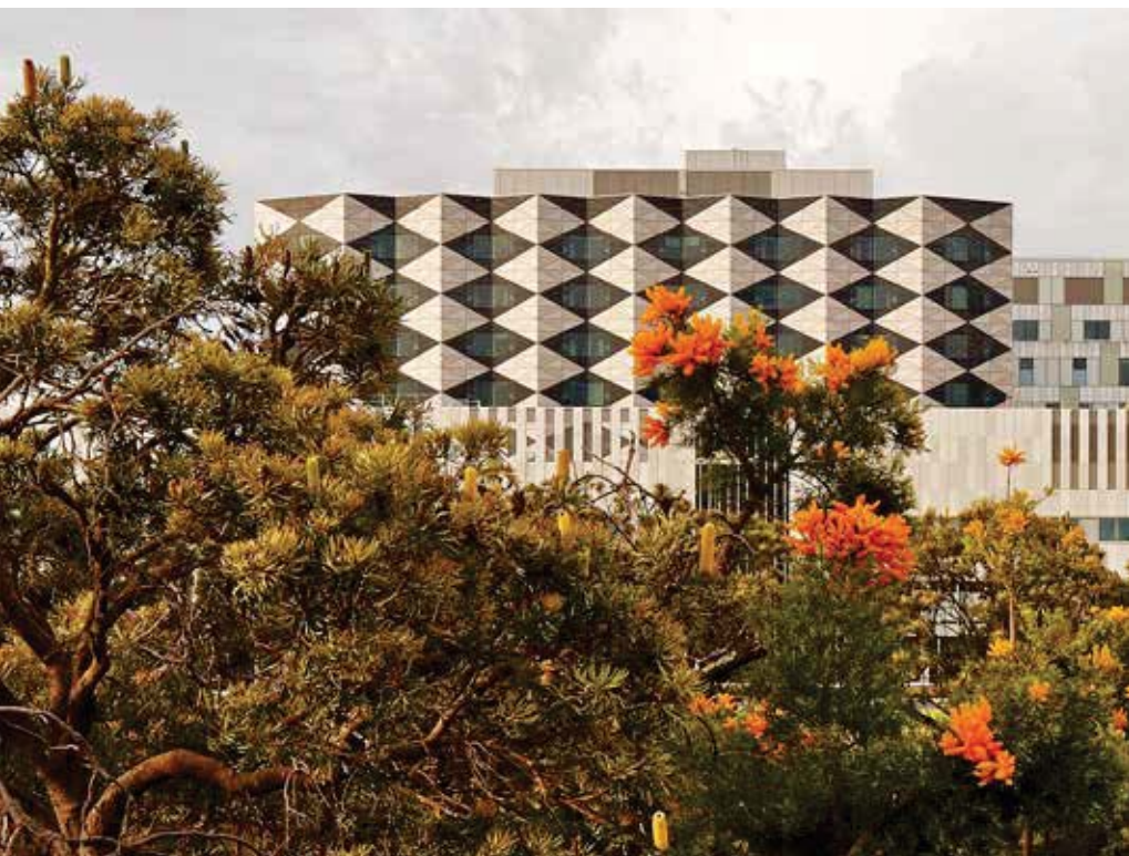
تصویر ۳: نمای ساختمان با الهام از گیاه بومی منطقه (Banksia)