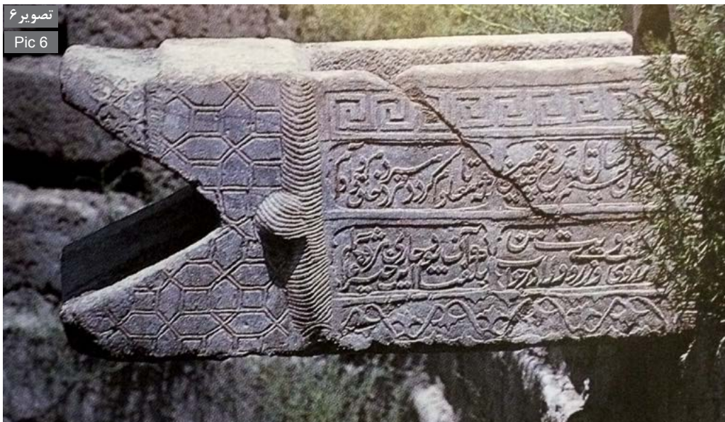
تصویر ۶ Pic 6

به علاوه فضای اطراف حوض‌ها محلی برای تفریح، استراحت، سرگرمی و اجتماع مردم بوده است، چنانچه در مورد لب‌حوض دیوان‌بیگی چنین آمده است: "لب حوض دیوان‌بیگی مانند ریگستان فضای بسیار شلوغ و سرزنده‌ای است. مردم یکدیگر را هل می‌دهند، فریاد می‌کشند، گریه‌واری می‌کنند و تراس‌های سنگی زمین بازی مورد علاقه بچه‌ها و صحنه نمایشی برای دلقک‌ها و