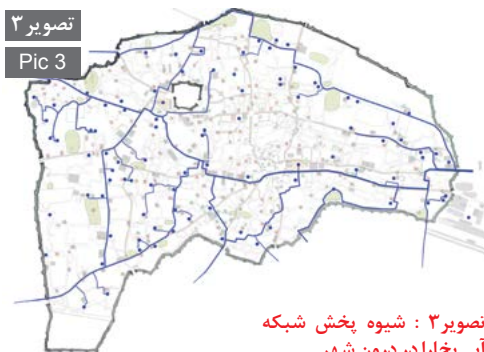
تصویر ۳ Pic 3

تصویر ۳: شیوه پخش شبکه آبی بخارا در درون شهر. Pic3: Pervade method Bukhara water system inside the city.