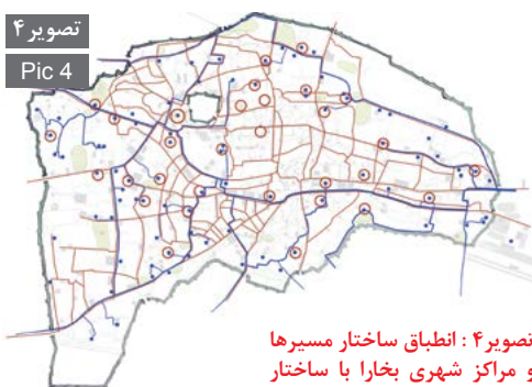
تصویر ۴ Pic 4

تصویر ۴: انطباق ساختار مسیرها و مراکز شهری بخارا با ساختار شبکه آبی بخارا متشکل از نهرها و حوض‌ها. Pic4: Compliance between directions and urban centers of Bukhara and Bukhara water system including streams and ponds.