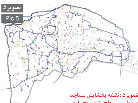
تصویر ۵ Pic 5

تصویر ۵: نقشه پخشایش مساجد و مدارس سطح شهر بخارا در ارتباط با شبکه آبی بخارا قرن ۱۶ برگرفته از نقشه ۱۸۷۲. Pic5: Plan pervades of mosques and school in Bukhara in association with Bukhara water system 16th century AD from plan of 1872.