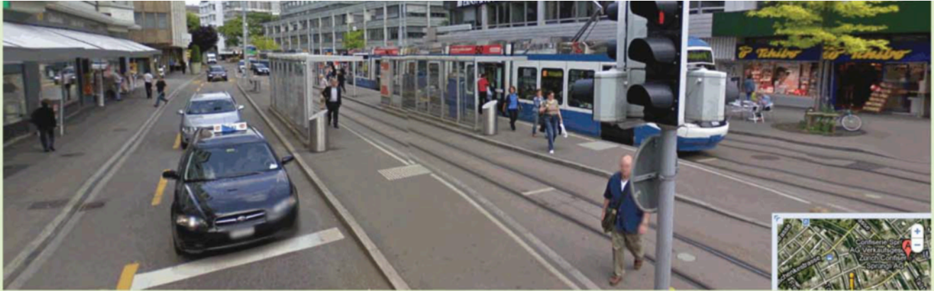
۳: نمونه یک خیابان کامل در زوریخ، پیاده‌روی عریض سرپوشیده، مسیر دوچرخه که با رنگ زرد مشخص شده، یک باند برای خودروها، ایستگاه‌های سرپوشیده و خطوط تراموا و پیاده‌روی سمت دیگر، مأخذ: www.geschichteinchronologie.ch