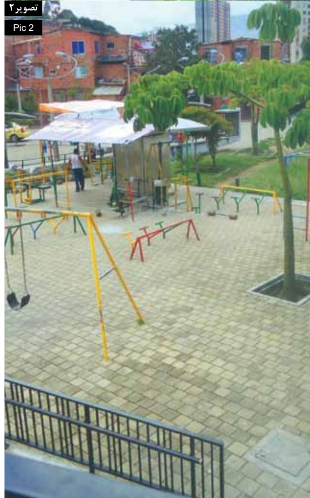
تصویر ۲ Pic 2

بی‌تردید، این مداخلات کیفیت زندگی بسیاری از ساکنین محله کامونا ۱۳ را بهبود بخشیده است. انتقادهای گوناگون مطرح شده در مصاحبه‌هایی که با متخصصان و کارمندان PUI انجام شد، معضلات توسعه شهری را روشن می‌کند. عدم وجود همکاری‌های بین نهادی و نبود ثبات طراحی شمایی، به عنوان نقطه ضعفی برای یکپارچگی و پایداری زیست‌محیطی پروژه مطرح بوده و همچنین عدم پاسخگویی به جنبه‌های هویتی و فرهنگی شهر در آن مشهود است. این حقیقت که PUI ها شدیداً وابسته به نظام سیاسی شهر هستند، منجر به کاهش کیفیت مشارکت‌های شهروندی و عدم تمایل مدیران برای گسترش ابزارهای ارزیابی کیفی زیست‌محیطی، اقتصادی و توسعه پایدار اجتماعی شده است. به نظر می‌رسد تمرکز بر مداخلات فضایی و ایجاد جذابیت‌های توریستی منجر به رویکرد ناتمام به یکپارچگی پروژه و توجه ناکافی به تنوع فرهنگی