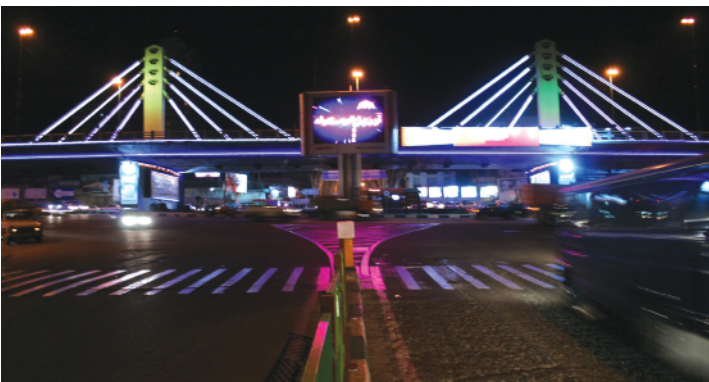
نورپردازی در خدمت حرکت نه زندگی شهری، مأخذ: نگارنده، ۱۳۸۸.