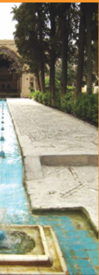
باغ فین، کاشان.

طراح در زمان طراحی به جنبه‌های کمی و ابعاد و ارقام توجه زیادی دارد؛ اما هنگامی که از او درباره طرح پرسیده می‌شود، بیشتر به بیان جنبه‌های کیفی و زیباشناختی می‌پردازد و هدف خود را از ارائه کمیت‌ها، بیان می‌کند. در واقع همه معماران در فراسوی ظاهر و کالبد فیزیکی و کمیت‌هایی که برای بیان آن ارائه می‌کنند، به دنبال ماهیت و کیفیت اصلی طرح هستند. اندیشه هر هنرمند تنها بیان یک ایده است (زهوی، ۱۳۷۶). اما این ماهیت یگانه یک مفهوم صرفاً انتزاعی نیست. فیزیک و کالبد معماری، ابزار معمار برای دست‌یابی به آن ماهیت است. باید توجه داشت که به غیر از کالبد، عوامل دیگری همچون ذهنیت معمار در زمان طراحی، سابقه ذهنی و تجربیات مخاطب و نیز حافظه تاریخی، در خلق