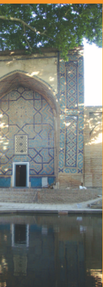
مقبره خواجه عبدرون، سمرقند، ازکستان.