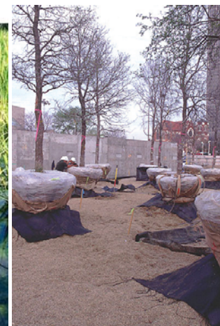
کاشت درختان Cedar Elm در باغ