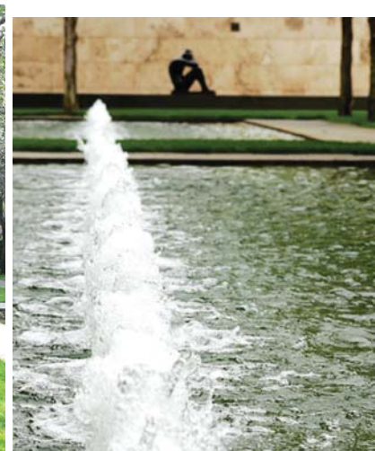
کاشت ردیفی درخت های بلوط و استخر آب در پس زمینه