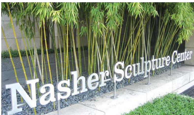
درختان بامبو در اطراف مجموعه

بیش از ۱۷۰ درخت، شامل نارون قرمز، بلوط همیشه سبز (درخت بومی آمریکا و مکزیک)، مورد سبز، بید مجنون، بامبو، راج، ماگنولیا و کاج افغان در این باغ وجود دارد که در ترکیب با یکدیگر و مسیر سنگفرش شده، استخرهای آب و فواره ها به منظر محرمیت داده که باعث ایجاد فضایی آرام