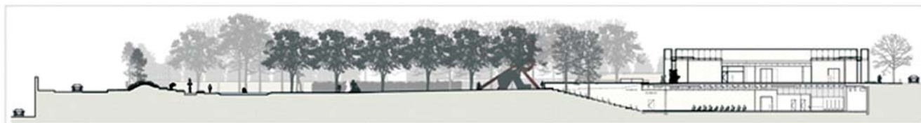
دو برش از باغ در امتداد محور های خیابان ها روود و الیو از میان باغ، تراس و دیگری از میان آمفی تئاتر

ظریف بین هنر، فرهنگ و زمینه را در باغ مجسمه مؤسسه «ناشر» نشان می دهد. (www.papress.com) مراسم و رویدادهای مردمی به صورت ماهانه در این مرکز برگزار می شود که شنبه های اول هر ماه به کودکان و خانواده ها اختصاص دارد. همچنین از سخنرانان برجسته جهت مباحثه در حوزه هنر، معماری و موضوعات فرهنگی دعوت به عمل می آید که از میهمانان در فضای باز پذیرایی می شود. این مجموعه از اکتبر سال ۲۰۰۳ تاکنون باز بوده است و یکی از بهترین مجموعه های مجسمه سازی مدرن و معاصر در جهان است. (en.wikipedia.org) این باغ تقریباً ۳۰ قطعه مجسمه را همزمان به صورت استراتژیک در میان منظره سازی زیبای اطراف و فواره ها جای می دهد. چیدمان و نصب مجموعه مجسمه ها متناوباً در باغ و گالری ها تغییر کرده و روح و سرزندگی را به جو آرام این فضای عمومی منحصر به فرد می دهد. (www.nashersculpturecenter.org) به دلیل وزن زیاد بعضی از قطعات و لزوم جابجاکردن مجسمه ها، نوع خاصی از خاک اختراع شده که زه کشی کاملی بدون ایجاد آبگیر دارد و به اندازه کافی قدرت دارد تا نیروی وزن هرگونه مجسمه ای را تحمل کند.