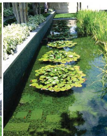
گلپهای نیلوفر آبی در استخر آب