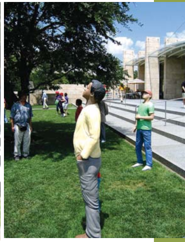
مجسمه های قابل دسترس توسط بازدیدکنندگان

ملموس بودن مجسمه‌ها و دیدن آنها در فضای انسانی باعث ایجاد رابطه بین انسان، مجسمه و محیط اطراف او شده و برای بازدیدکنندگان حس