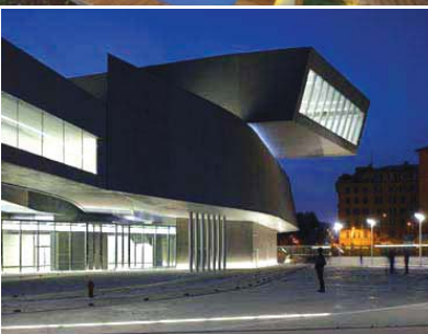
MAXXI museum, Rome, Italy

رشد جمعیت کشور ترکیه در دهه‌های اخیر، که ناشی از افزایش مهاجرت پذیری و جذب توریست است، اثرات متعددی بر فرهنگ این سرزمین گذاشته است. پروژه ۷۸۰۰ واحدی ساختمان مسکونی شهر از میر ترکیه نیز از این امر مستثنی نبوده و همانند سایر کلان‌شهرها، تأثیری از فرهنگ بومی در آن دیده نمی‌شود. یکی از ویژگی‌های بارز طرح، تفکر معماران شرکت «EAA» است که سعی در مورد استفاده بودن واحدهای مسکونی برای تمام فرهنگ‌ها از تمام سرزمین‌ها داشته‌اند. در نمای بیرونی ساختمان از مواد طبیعی چوب، سنگ و بتن استفاده شده است. در فضاهای بیرونی ساختمان نیز استخرها و فضاهای تفریحی خاصی طراحی شده است که فضا را جذاب‌تر می‌کند. وضعیت توپوگرافی سایت و توده‌های حجم ساختمان به گونه‌ای است که نهایت استفاده را مناظر زیبای اطراف بهره می‌برد.