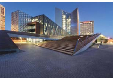
Swedbank Head Office, Vilnius, Lithuania

خانه «SZ» توسط معماران شرکت «miyahara»، برای یک زن و شوهری طراحی شده است که خواهان یک محیط زندگی با اتمسفری غنی بودند تا فضای داخلی منزلشان، هر چه بیشتر با فضای بیرون در ارتباط باشد و تغییرات فصول برایشان محسوس تر باشد. محل اقامت در این خانه به سه منطقه عمده - خصوصی؛ عمومی و آلفا- تقسیم شده است. هر یک از این مناطق با استفاده از دو حیاط و دیوارهای شیشه‌ای به فضاهای فردی و عمومی تقسیم می‌شود. در فضای خصوصی اتاق خواب، اتاق سرگرمی، حمام و یک حیاط اختصاصی برای حفظ حریم وجود دارد. منطقه عمومی نیز از اتاق اصلی، حیاط و پارکینگ تشکیل شده است. منطقه آلفا به عنوان هسته اصلی با تمام فضاهای خانه در ارتباط است. فضای ورودی همانند غاری است که افراد را به داخل خانه جذب می‌کند و حس کنجکاو را در عابرین بر می‌انگیزد. لذا این بخش از خانه «گالری عبور» نامیده شده است.