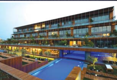
Çesme Residences, Çesme, Turkey

ساختمان اداری «Swedbank» در منطقه‌ای از شهر «Vilnius» بنا شده است که اگر چه به تازگی توسعه یافته، اما به سرعت در زمینه‌های گوناگون سیاسی، تجاری و تفریحی در حال رشد است. «Audrius Ambrašas»، معمار این ساختمان می‌گوید: «ما می‌خواستیم این ساختمان، بخش جدایی‌ناپذیری از توسعه بانک در سمت راست رودخانه «Neris» باشد. همچنین فضاهای اطراف آن به گونه‌ای طراحی شود که مرکز توجه قرار گیرد». ساختمان از دو بخش اصلی تشکیل شده است: بخش اول، تیپ سازه‌ای با ۱۵ و ۱۶ طبقه است و بخش دوم ساختاری چهار طبقه، متشکل از دو بلوک در زمینی با خطوط طولی شکسته است. ۴۵۰۰ متر مربع تراس در این ساختمان تعبیه شده است که امکان دید جالبی از رودخانه را فراهم می‌کند. طبقه زیرین مجموعه به فضای بزرگی باز می‌شود که ظرفیت ۱۵۰ نفر را دارد. همچنین یک تالار کنفرانس و یک اتاق مطالعه برای مشتریان در نظر گرفته شده است.