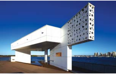
Southport Broadwater Parklands, Southport, Australia