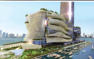
Miapolis, Miami, United States

اولین موزه هنر و معماری معاصر ایتالیا، با هزینه ۲۲۴ میلیون دلاری در شهر رم گشایش یافت. «Maxxi» نام موزه هنر در شهر رم است که توسط معمار مشهور عراقی طراحی شده است. این ساختمان عظیم‌الجثه در نزدیکی ایستگاه متروی «Flaminio» واقع شده است تا دسترسی آسان‌تری برای بازدید عموم داشته باشد. دالان‌های پیچ‌درپیچ و مسطح با بیرون زدگی‌هایی در نما و استفاده از سنگ و شیشه، یکی از نشانه‌های معماری «زاها حدید» است و شاید بتوان گفت که گونه‌ای سبک را برای خود ساخته است. علاوه بر فضای موزه، ساختمان شامل سالن اجتماعات، کتابخانه رسانه‌ها، کافه تریا، فضاهای خالی برای نمایشگاه‌های موقت، فعالیت‌های تجاری، آزمایشگاه‌ها و مکان تفریح و فراغت. موزه «Maxxi» نه تنها باید به عنوان یک ساختمان در نظر گرفته شود؛ بلکه وسیله‌ای است برای بیان مرکز فرهنگی شهری که بافت متراکمی از فضاهای داخلی و خارجی آن را احاطه کرده‌اند.