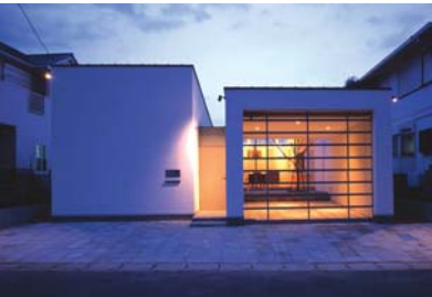
House Sz, Tokyo, Japan

«Whitearchitecture»: معماری سفید در طرح‌های جدید پارک‌های آبی کنار ساحلی جایگاه ویژه‌ای را ایفا می‌کند. فضای شهری ایجاد شده در این ناحیه برای میزبانی کلاس‌های بین‌المللی مسابقات ورزشی و رویدادهای مهم فرهنگی در کوئیزلند طراحی شده است. همچنین این فضا قابلیت تبدیل شدن به مجموعه‌ای از ساختمان‌های یکپارچه و معاصر پایدار را دارد. معماری ساختمان، از قایق‌های خاص منطقه و بادبان‌های آن الهام گرفته است. روشنایی یکپارچه ساختمان از سوراخ‌های طراحی شده در برخی از بال‌های آن تأمین می‌شود تا به نوعی هم جذابیت نمای بیرونی حفظ شود و هم گالری‌های فضای داخلی ساختمان از نور طبیعی بهره ببرند. همچنین با تعبیه پانل‌های خورشیدی در ساختمان بخش عظیمی از انرژی پارک تأمین می‌شود. این ساختمان سازگار با محیط زیست، به گونه‌ای در پارک جای گرفته است که قابلیت توسعه در آینده را دارد.