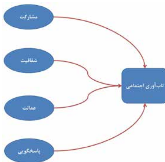
تصویر ۱. چارت مسیر مدل ساختاری تاب‌آوری شهری در چارچوب حکمروایی شایسته شهری.

پیکان‌های جهت‌دار نشان‌دهنده تأثیر مستقیم متغیرهای مستقل بر تاب‌آوری شهری و روابط همبستگی میان این متغیرها هستند. هر یک از مؤلفه‌های حکمرانی (مشارکت، شفافیت، عدالت و پاسخگویی) از طریق پیکان‌های جهت‌دار به شاخص تاب‌آوری شهری اثر می‌گذارند. همچنین، روابط میان متغیرهای مستقل (مانند همبستگی میان مشارکت و شفافیت) با پیکان‌های دوطرفه بررسی می‌شود. ضریب‌های اثر (از تحلیل SEM) برای هر مسیر عددی تعیین و تفسیر خواهند شد.