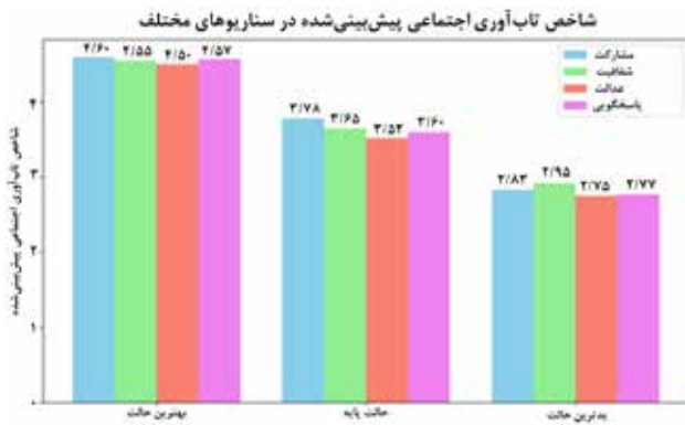
تصویر ۴. شاخص تاب‌آوری شهری پیش‌بینی شده در سناریوهای مختلف.