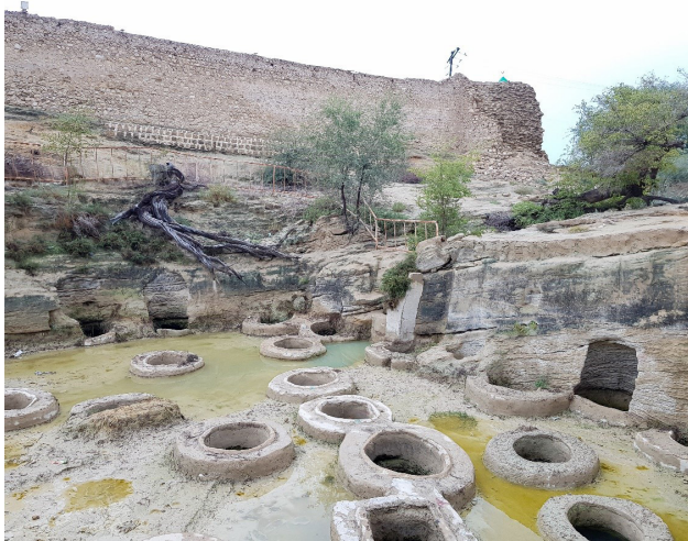
تصویر ۲. تلوهای ذخیره آب باران به‌عنوان مظاهر فناوری بهره‌مندی از خدمات اکوسیستم، جزیره قشم، بندر لافت.

با تبیین و تطبیق ادبیات جهانی توسعه پایدار متأثر از خدمات اکوسیستم با شرایط محلی، طبیعی، اجتماعی و اقتصادی قشم، اقمار و نواحی مجاور آن، لازم است، ابتدا درک توسعه به‌مثابه امر فرایندی پذیرفته‌شده و در سطح محلی و حاکمیتی، شرط وابستگی پایداری این فرایند به عدالت محیطی و اجتماعی فهم شود. در این چارچوب، عدالت محیطی نه به معنای یک دست‌انداز توسعه،