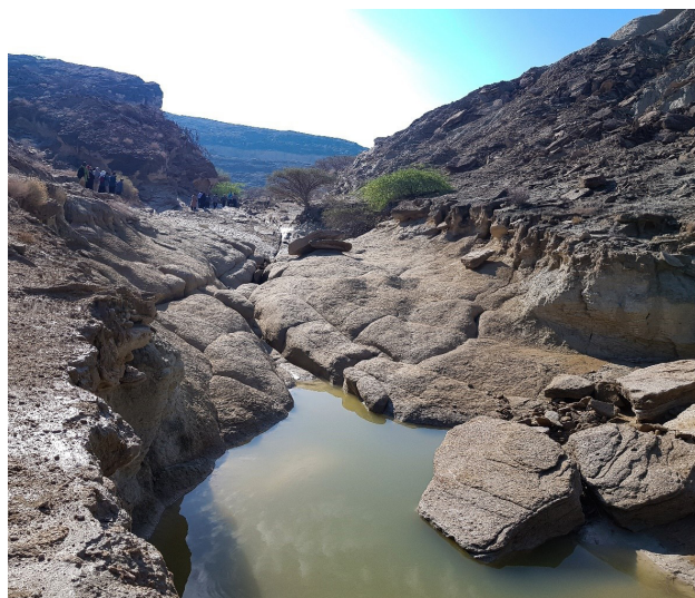
تصویر ۵. ژئوسایت چاه کوه به مثابه ساخت فناوری بومی استحصال و نگهداری آب بهره‌مندی از خدمات اکوسیستم، جزیره قشم، چاه کوه.

بلکه به مثابه پیشران و راه‌گشای نقصان‌های سیستم اجتماعی-اکولوژیک، فرایند دموکراتیک، تطبیق معیارهای جهانی با شرایط محلی را پی خواهد گرفت. در این فرایند به جای انحراف به سمت عدالت توزیعی مطلق و صدقه‌ای و توسعه تک‌بعدی (گردشگری)، ارزش‌های جامعه محلی و مشارکت آن‌ها را در فرایندی تکثرگرایانه به رسمیت شناخته می‌شود. در نهایت، با اتخاذ سه راهکار ۱. شناخت بازیگران، ارزش‌ها و توانایی‌های آن‌ها (Reed et al., 2009) ۲. انتساب ارزش‌ها و تأثیر حاکمیت در تصمیم‌گیری‌ها (به مثابه میانجی) (Primmer et al., 2015; Isaac et al., 2022; Loos et al., 2023) و ۳. توزیع نیازها و دارایی‌های مربوط به خدمات اکوسیستم همراه با ایجاد فرصت یادگیری (Loos et al., 2023, 483)؛ هدف غایی به جای تحقق وضعیت ایده‌آل بر خورداری یا برابری مطلق (نامحتمل)، به کاهش نابرابری‌ها، تغییر دائمی موقعیت‌های ناعادلانه از مرحله تعیین سیاست تا باز توزیع منافع و تکثرگرایی تعیین و به سوی آن گام برداشته می‌شود. لازم به ذکر است، با ادغام نگاه برخاسته از ایده «خدمات اکوسیستم» و «عدالت محیطی» با یکدیگر، فرایند توسعه، نه با نگاه از بالا به پایین و نه به شکل تحکمی قابل تعمیم