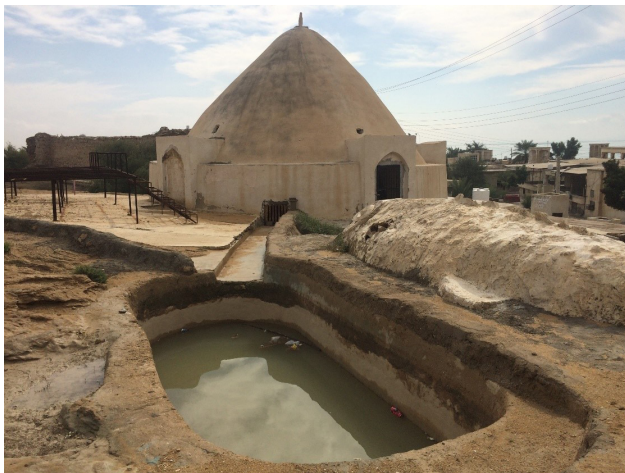
تصویر ۳. آب‌انبار تاریخی بندر لافت به‌مثابه فناوری ذخیره منابع آب شیرین، جزیره قشم، بندر لافت.

طبل، لافت و هرمز) و نمونه‌هایی از شهرهای ساحلی) در استان هرمزگان (خمیر و کنگ) نشان‌دهنده عدم برخورداری از خدمات اکوسیستم و محرومیت از مواهب اقتصادی، اجتماعی و فرهنگی توسعه و ضعف زیرساختی شهرها و روستاهاست که خارج از نقاط نمایشی توسعه و گردشگری، در زندگی عموم مردم کم‌برخوردار منطقه، قابل تشخیص است. به‌نجوی که در غنای نسبی خدمات اکوسیستم دریا و پهنه ساحلی، حتی وجوه اولیه عدالت توزیعی نیز تأمین نشده است. - توسعه اقتصادی بخشی تک‌وجهی و مبتنی بر خدمات اکوسیستم و سرمایه‌های غیربومی که عموماً در بخش گردشگری، تجاری و خدماتی (خصوصاً در شهر قشم و برخی روستاها) قابل مشاهده است. این شکل از توسعه، به غیر از بازتوزیع بخش قابل اغماضی از سود اقتصادی این فعالیت‌ها برای مردم بومی (عدالت توزیعی محدود)، آورده پایداری به همراه نداشته است. لازم به ذکر است، بخش قابل توجهی از این سود حاشیه‌ای/اقتصادی، در فرایند گران‌سازی زیست در نواحی نوسازی‌شده از مردم محلی بازپس گرفته می‌شود و این مردم به مرور به کارگران بخش خدمات گردشگری، تجاری و اقتصادی پایین‌دست بدل خواهند شد. در این شکل از توسعه، ایجاد انتفاع اقتصادی به خروج عایدات حاصل از خدمات اکوسیستم از منطقه می‌انجامد و توسعه پایدار منطقه و به تبع آن افزایش درآمد سرانه مردم محقق نخواهد شد. در نتیجه این توسعه تک‌وجهی و با توزیع حداقلی امکان برقراری عدالت فرایندی و شناختی ایجاد خواهد شد.