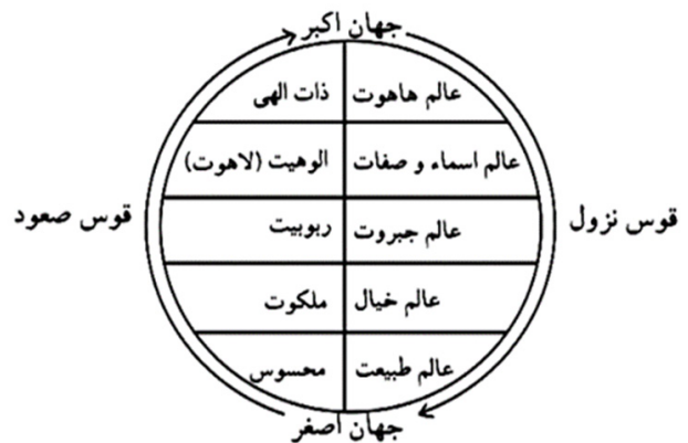
تصویر ۲. الگوی چرخه خیال، ابن عربی.

همان‌طور که در روش‌شناسی تحقیق اشاره شد، اعتبارسنجی مقولات و شاخصه‌های تحلیلی باغ تجلی‌یافته در معماری که با کدگذاری متون استخراج شده‌اند، از طریق تطبیق شروع و تفاسیر باغ (با مضمون باغ عرفانی) در هنر شعر انجام می‌شود. شرط اول از