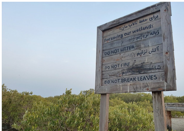
تصویر ۴. آموزش دادن ارزش‌های طبیعی و فرهنگی جنگل‌های حرا به بازدیدکنندگان در حین بازدید و تجربه ملموس آن.

منظر به‌عنوان پدیده‌ای حاصل تعامل انسان و محیط، پدیده‌ای هم‌زمان طبیعی-فرهنگی است. این مسئله به دلیل استفاده مشترک جوامع محلی و نهادهای مدیریتی از بستر طبیعی دریا در شهرهای دریاپایه نمودی برجسته دارد. خلاء دیرینه میان علوم زیستی و اجتماعی در چگونگی حفاظت از میراث مشترک بشری به‌عنوان پدیده‌ای فرهنگی-طبیعی، به‌طور مستقیم بر شرایط فعلی موردهای مطالعه شده تأثیر داشته است. عدم یکپارچگی کامل جوامع محلی و نهادهای مدیریتی به هدررفت ظرفیت‌های گردشگری این سایت‌ها منجر شده و ایجاد فضایی غیرمولد را به همراه داشته است. این در حالی است که درپیش گرفتن دیدگاه میان‌رشته‌ای منظر با تمرکز بر نقاط توافق و مشترک میان دو گانه‌های یادشده، نتایج بهتری را برای حفاظت فراهم می‌آورد. دورنمای حفاظت هم‌زمان از میراث طبیعی و فرهنگی ممکن است تیره و تار به نظر برسد، اما زمینه نوظهور و راهنمایی را به سوی چگونگی ایجاد پل بر شکاف طبیعت/فرهنگ نشان می‌دهد. این امر مستلزم جست‌وجوی زمینه