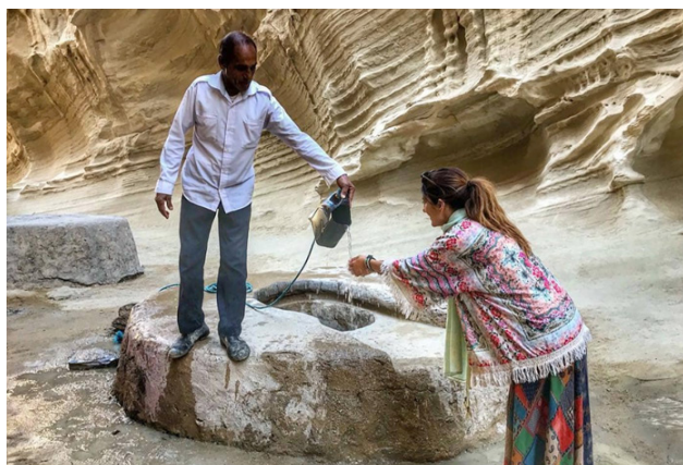
تصویر ۳. تجربه ملموس خرد بومی در مدیریت زیرساخت های طبیعی تنگه چاه کوه.

۱. به کارگیری جامعه محلی در فرایند مدیریت فضا به شکل انعطاف پذیر و چندگانه نظیر استخدام دائمی راهنمایان محلی و به کارگیری هم یاران افتخاری در دوران اوج بازدیدها، ۲. تقویت ارزش استفاده فضا در عین حفظ ارزش ذاتی آن نظیر تجهیز محیطی و کالبدی فضا برای عبور و مرور به شکلی زمینه ساز، ۳. به کارگیری خرد بومی و ارزش های فرهنگی برای ایجاد جاذبه های گردشگری