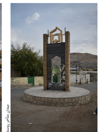
تصویر ۳. میدان متأخر جایگزین میدان میل به‌مثابهٔ یک میراث تاریخی و آیینی و مرکز روستا.