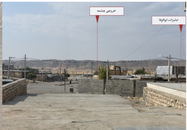
تصویر ۲. عدم خوانش امامزاده و خروجی چشمه به‌مثابهٔ یک منظر در طرح‌های روستا خسروآباد.