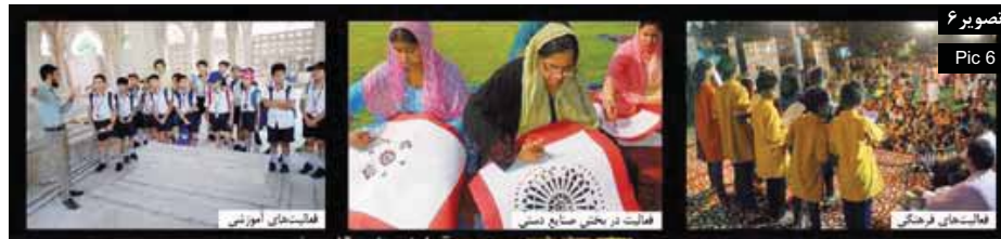
تصویر ۶ Pic 6