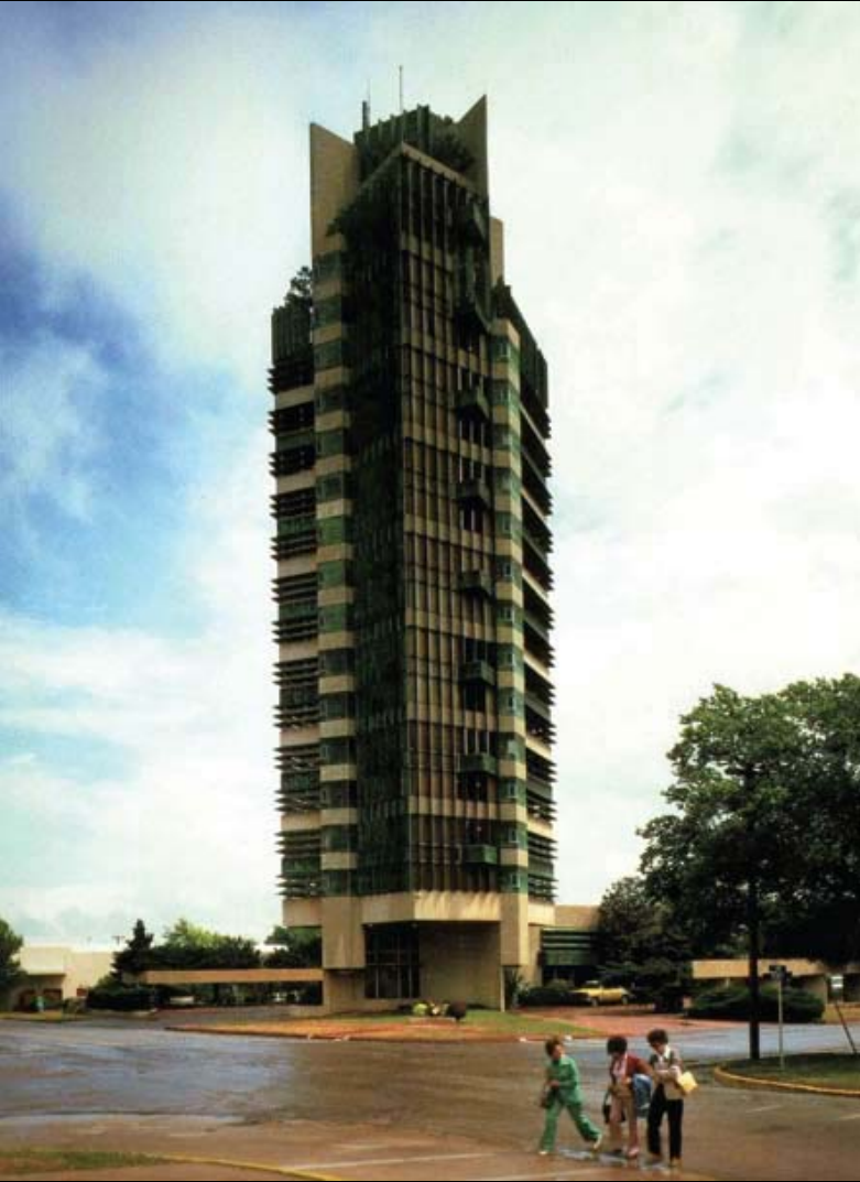
تصویر ۲: برج H.C. Price، اوکلاهاما، فرانک لویدرایت، ۱۹۳۷-۱۹۳۴.

مقایسه دو بنای ساخته شده توسط فرانک لوید رایت برای تشریح ارتباط او با منظر بسیار آموزنده است: Taliesin east (1842) که در تپه‌های جنگلی ویسکانسین ساخته‌شده از طریق بازی کردن با تراس‌ها و غرق شدن در منظره و Taliesin west، که در کویر پهناور آریزونا قرار گرفته با طرح یک چادر صحرایی و به وسیله بلوک‌های سنگی به زمین وصل شده، با منظر ارتباطی ناگسستنی برقرار کرده است. معماری