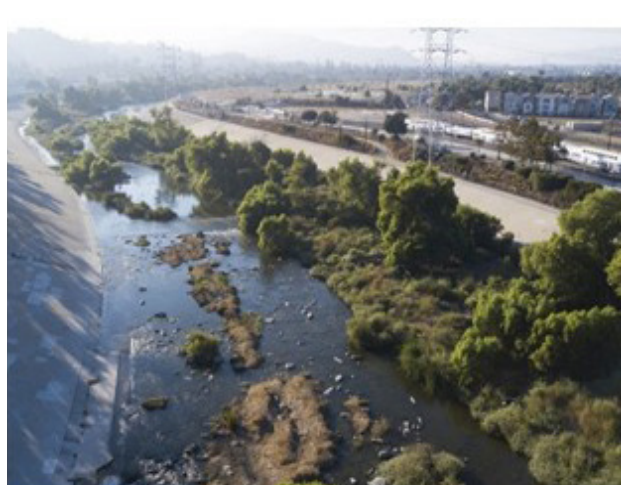
تصویر ۳. تاب‌آوری اکولوژیکی رودخانه لس آنجلس سال ۲۰۱۷، بهسازی رودخانه.

بخش‌های عملکردی جداگانه‌ای تشکیل شده که می‌تواند هر بخش به‌طور مستقل تکامل پیدا کند (Berkes, 2007). در سیستم‌های اجتماعی اکولوژیکی تاب‌آور بخش‌های مختلف به شکل بی‌قاعده به هم مرتبط هستند ولی به‌طور کامل به هم وابسته نیستند، در نتیجه اختلالات به‌سرعت در کل سیستم سرایت نمی‌کند. حد بهینه‌ای از پودمانگی وجود ندارد ولی سیستمی که اجزاء آن کاملاً به هم متصل هستند، می‌تواند به‌سرعت هر شوکی را به کل سیستم انتقال دهد (Gunderson, 2010).