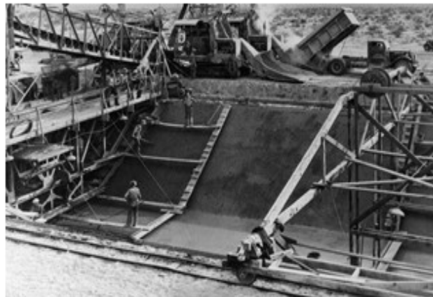
تصویر ۲. تاب‌آوری مهندسی رودخانه لس آنجلس در برابر سیلاب ۱۹۳۸ و کانالیزه کردن رودخانه.