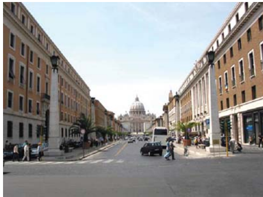
۷- خیابان سمبلیک کونسلیلیازبونه (مشروطیت) در رم

در مطالعه و بررسی این سیر تکامل نیز می‌بایست به عواملی پرداخت که در تبدیل شخصیت تبعی راه به شخصیتی مستقل و در ادامه به شخصیتی محورین دخیل بوده‌اند. عواملی همچون اتفاقات تاریخی مرتبط با آن راه، سهمی که آن راه در ساختار شهر ایفا می‌نماید، میزان اراده حاکمیت در اعطای این سهم به راه و دیگر مواردی از این دست. بیشتر درکی که اکنون از تجربیات فضایی باقی است عناصر منظرینی می‌باشد که به نوعی با راه شهری مرتبط و آمیخته‌اند. اغلب راه‌هایی که اشاره شد از آن جهت که امروزه از حیث دارا بودن کلیت مستقل منظرین، مشترکند، قابل توجه و بررسی‌اند. عوامل زیادی در شکل‌گیری و تکوین این خصیصه یعنی شناخته شدن به عنوان یک عنصر مستقل منظرین دخیل‌اند که باعث گردیده تا راه شهری که در ابتدای شکل‌گیری یک عنصر تبعی بوده است، در سیر تکامل، هویت مستقل امروزین خود را بیابد تا آنجا که تاثیر گذار بر هویت شهر گردد، آنچنان‌که در ونیز دیده می‌شود و منظر خیابان‌های این شهر که عمدتاً "آبراه‌های شهری" هستند، بدون حضور "گاندولا" یا همان قایق مشهور ونیزی و بسیاری عناصر منظرین دیگر بی‌هویت و بی‌معنی است.