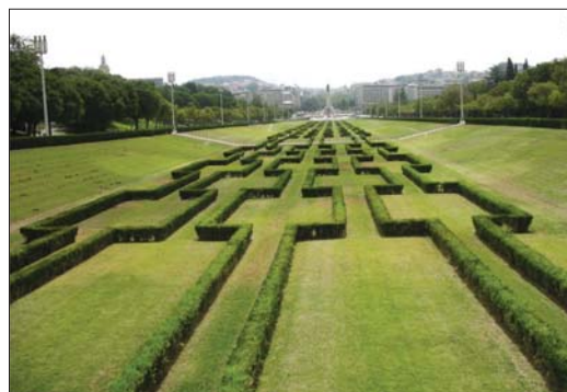
▲ ۱۰- لیبرداد / منظره پردازی و سمبل گرایی مطلق یک راه شهری

در کنار آن محورهای مهم شهری همچون رمبلا ۱۰ در بارسلون