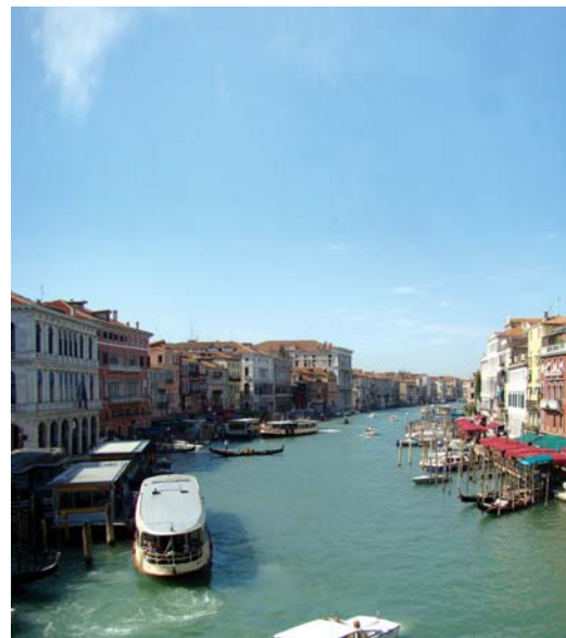
۶- آبراه‌های شهری ونیز یا قایق‌های خاص خود به نام گاندولا

برخی مولفه‌های موثر در این طیف عبارتند از اقلیم، بستر قرارگیری و مورفولوژی زمین از جمله شیب، جنس، جهت نورگیری، دلایل عملکردی مانند بارگیری در یک نقطه (مانند بندرگاه) و انتقال و توزیع در محل دیگر، دسترسی، ویژگی استراتژیک راه -از جمله عبور نظامی لشکرها- تحدید و یا تسهیل دسترسی به یک نقطه مهم مانند دژ، قلعه و ... آنچنان‌که تنگه بوسفر در استانبول این نقش را ایفا کرده است. شهر استانبول دارای برج و بارو و مناره‌های نظرگاهی بسیار برای کنترل کشتی‌های خصوصاً پارسی در بوسفر بوده است و به دلیل این اهمیت اکثر راه‌ها و کوچه‌های شهر امکان دید به این آبراه را دارند در نتیجه، همین منظره در انتهای دید این راه‌ها به آنها هویت خاص و مشترک بخشیده است.