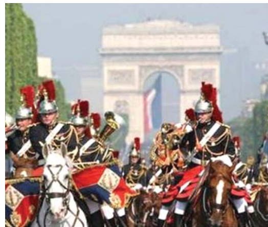
۲- جشن ملی فرانسه در شانزلیزه

شاید بتوان به راحتی در اکثر شهرها نمونه های دیگری همچون شانزلیزه یافت. این نمونه ها، گونه ای از راه های شهری هستند که نقش خاطره ای و مفهومی شان بر نقش عملکردی آنها غلبه یافته است. در حالیکه این راه های شهری نیز در ابتدا بدین گونه مطرح نبوده و حتی در مثال شانزلیزه برای کارکرد دیگری بوجود آمده اند که بحث آن به تفصیل در دوره اول حیات راه شهری ذکر گردید.