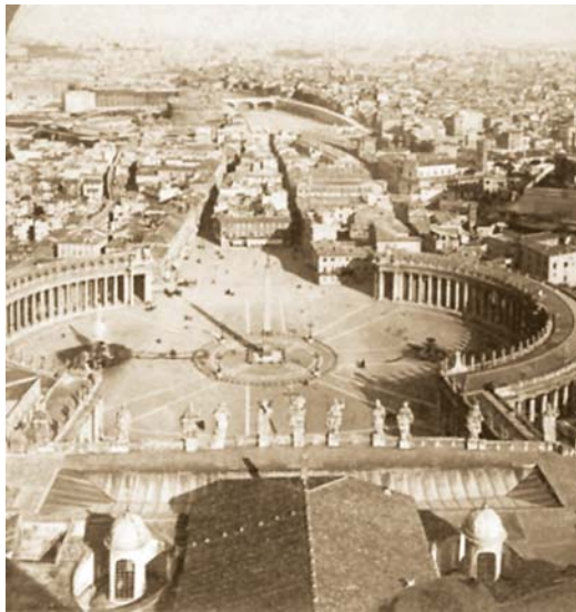
۲- خیابان مشروطیت رم در سال ۱۹۰۰ میلادی

از آن پس در طی سالیان متمادی شانزلیزه دستخوش تحولات زیادی شد تا اینکه سرانجام در سال ۱۹۹۳ میلادی پیاده‌روهای آن عریض گردید. امروزه رویدادهای مهم ملی فرانسه از جمله روز آزادی زندان باستی ۴ و بزرگترین مراسم رژه نیروهای نظامی در فرانسه با حضور ریاست جمهوری، به میزبانی شانزلیزه برگزار می گردد. شانزلیزه خط پایان سنتی آخرین مرحله رخداد مهم ورزشی جهان یعنی رقابت های دوچرخه سواری تور دو فرانس ۵ نیز هست.