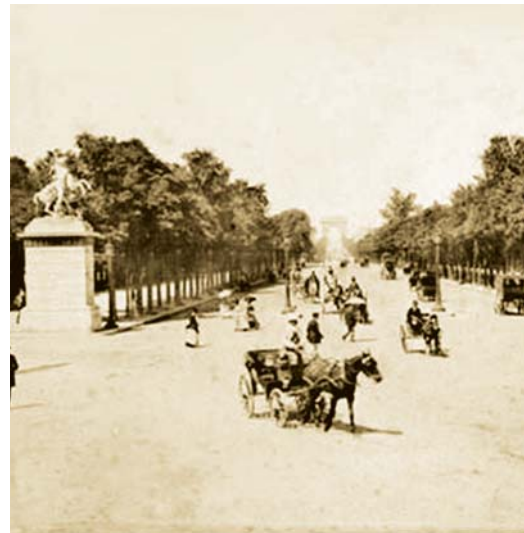
۱- شانزلیزه در سال ۱۸۹۰

در مثال دیگری مانند خیابان مشروطیت در رم موضوع از این هم فراتر رفته و فلسفه شکل گیری این راه ارتباط سمبلیک و نه فیزیکی بین دو نقطه بوده است. نام این خیابان از معاهده مشروطیت گرفته شده است که بین واتیکان و دولت ایتالیا در فوریه ۱۹۲۹ میلادی منعقد گردید. کلیسای سن پیتر و نمایی از رود تیبر (Tiber) به عنوان نقاط عطف این منظر سازی می باشد. این طرح به دستور موسولینی در سال ۱۹۳۶ میلادی شروع و در سال ۱۹۵۰ میلادی خاتمه یافت که این عملیات ساختمانی برای ایجاد ارتباط بین سن پیتر و مرکز شهر رم در راستای رودخانه تیبر باعث تخریب دو ردیف از ساختمان ها و بسیاری از نمونه های جالب معماری شد. این مسیر سمبولیک موسولینی برای ادای احترام به معاهده صلح بین واتیکان و دولت ایتالیا بود.