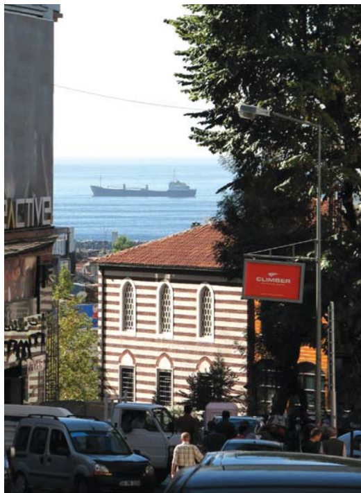
۸- راه‌های شهری در استانبول به مثابه دیده بانی بر بوسفر

از سوی دیگر برخی راه‌ها، اغلب یک راه بیرون شهری بوده‌اند و سپس و به واسطه توسعه‌های کالبدی و فضایی مجاور خود، به یک راه شهری بدل گردیده و امروزه به عنوان مهمترین شاخصه تحلیل ساختار و منظر آن شهر شناخته می‌شود، طیفی است از امکان حصول دسترسی آسان (برحسب امکانات زمان خود) از یک نقطه به نقطه دیگر همراه با حرکتی ارگانیک مانند آنچه در خیابان کونسلیلیازبونه (مشروطیت) در رم دیده می‌شود.