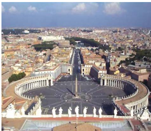
۴- خیابان کنونی مشروطیت در رم