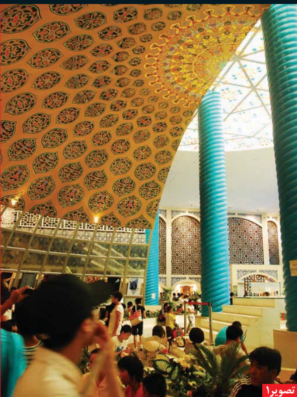
تصویر ۱: غرفه ایران، اکسپوی ۲۰۱۰ شانگهای چین، عکس: سیدمحمدباقر منصور، ۱۳۸۹.

عزت پیدایش و برگزاری نمایشگاه‌های جهانی اکسپو را باید در دوران اوج انقلاب صنعتی در غرب و تحولات مرتبط با آن جست. از آن روزگار تا چند دهه پیش، کشورها و دولت‌ها اصلی‌ترین متولی توسعه علم و صنعت به شمار می‌رفتند. لذا پیشرفت روزافزون شاخه‌های مختلف تکنولوژی، می‌طلبید تا آخرین دستاوردهای صنعتی کشورها در نمایشگاهی ارائه و از این رهگذر، پیشرفت‌های صنعتی برای متحیر ساختن رقبای جهانی و به‌رخ کشیدن توان کشورهای شرکت کننده به نمایش گذاشته شود. اما به نظر می‌رسد امروزه چنین رقابتی از دست دولت‌ها خارج شده و در میان شرکت‌های بزرگ چندملیتی در جریان است. از سوی دیگر باید توجه داشت که رقابت در حوزه معماری و صنعت ساختمان نیز همواره به عنوان بخش جذابی از هموارد اکسپو، مورد توجه صاحب‌نظران و بازدیدکنندگان بوده است.