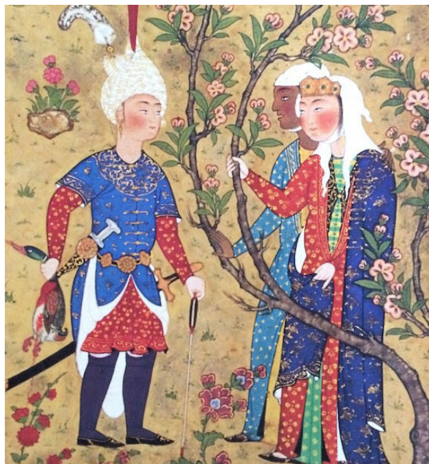
تصویر ۶. شاهنامه طهماسبی، گل ختمی و درخت شکوفه که به شکل واقعی ترسیم شده است.

مینیاتور ایرانی سندی مهم و با ارزش و جلوه‌ای بی‌نظیر از باغ ایرانی را به نمایش گذاشته است. باغ ایرانی با پیشینه‌ای دور فرهنگ و باور نیاکان را مبنی بر تقدس طبیعت و عناصر زمینی و آسمانی آن بازسازی نموده و در گذر زمان از روزگاران استوره‌ای و تاریخی این مرز و بوم تا دوران اسلامی و تا کنون برجای و استوار