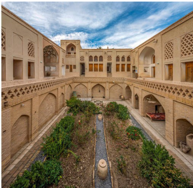
تصویر ۴. خانه پیرنیا نابین، خانه ایرانی با الهام از معماری براساس باورها که آب و گیاه و چهارتاقی عناصر اصلی آن هستند، چشمه و درخت مقدس در قالب باغچه و حوض با درختان انار، انجیر و انگور دیده می‌شوند. شاه‌نشین یا ایوان اصلی که همان چارتاقی و مشرف بر حوض است نیز دیده می‌شود. مأخذ: www.naeincht.ir