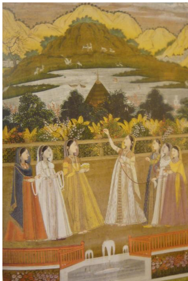
تصویر ۹. حضور گیاهان بومی در پس‌زمینه و خلوت بودن زمینه، روایت در دل طبیعت که در پس‌زمینه گیاهان بومی هند، کوه و آسمان را نشان می‌دهد. زمینه خلوت و بدون نقش است. در مینیاتور ایرانی جای خالی و بدون نقش دیده نمی‌شود.

است. باغ و باغ‌سازی با الگوی ایرانی که حال و هوایی ویژه دارد و منظر روح‌افزا و آرام‌بخش آن، با روحیات شاعرانه و احساسی ایرانیان سازگاری داشته و قرن‌ها با حیات مردم عجین بوده و هست. این هنر بی‌ظنیر به شرق و غرب عالم از سرزمین هند و عثمانی، تا شمال آفریقا و اسپانیا هم بال گشوده، به همین شکل مینیاتور ایرانی نیز به این سرزمین‌ها رفته و باغ و بوستان را به