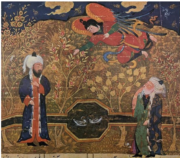
تصویر ۱. خاوران نامه، اعلان تمجید و امامت امام علی (ع) توسط جبرئیل به پیامبر (ص)، این روایت مذهبی در باغ به تصویر آمده است، حوض و آبراه، درخت انار با میوه‌های طلایی و گل انار، درخت شکوفه، آسمان لاجوردی و ابرهای طلایی ترکیبی از واقعیت و خیال در تصویرسازی است. مأخذ: Gray, 1995, 107