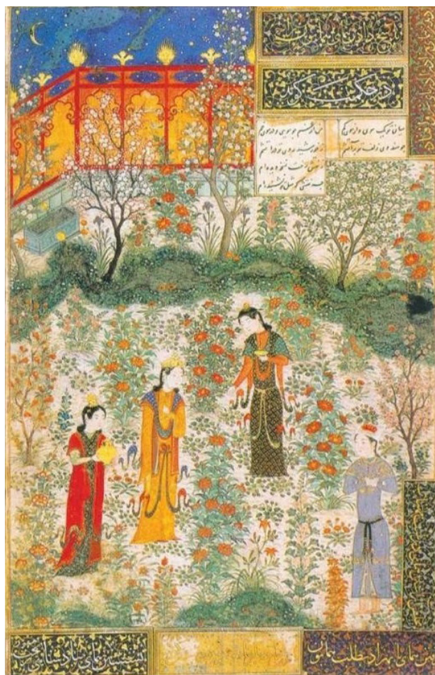
تصویر ۷. همای و همایون، سبزه‌زار با انواع گل و بوته‌های بومی که در باغ ایرانی، باغچه و حیاط‌ها بوده است و جویبار و پلان جلو که عشاق را نشان می‌دهد، ردیف درختان با آسمان لاجوردی و نمایش شب در بالا و روز در پایین باغ نیز از نکات جالب توجه است.