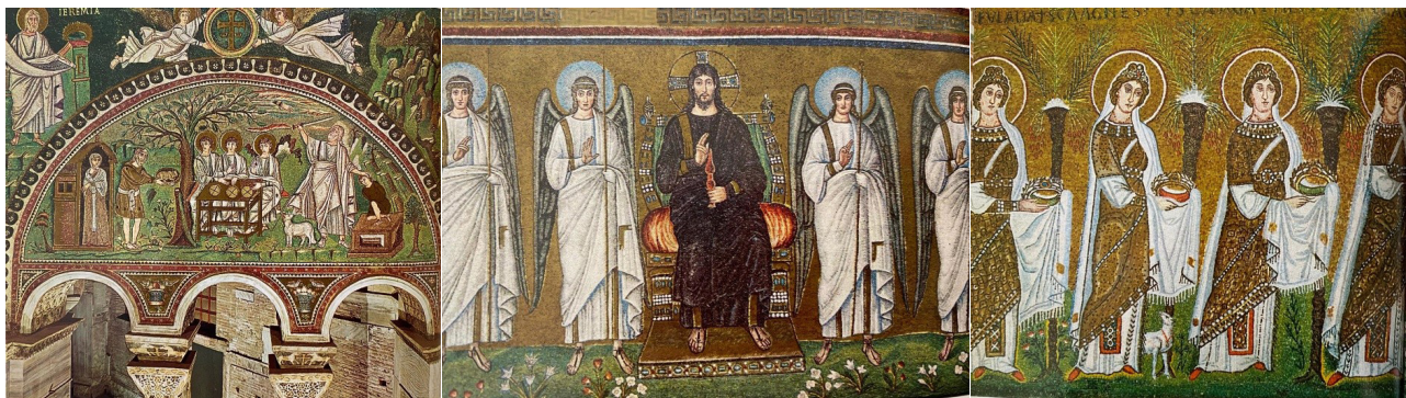
تصویر ۸. کلیسای سنت آپولیناره، روایت مسیحی که در دل طبیعت ترسیم شده و زمینه کار مانند مینیاتور ایران با سبزه‌زار و گل و بوته و درختان است.