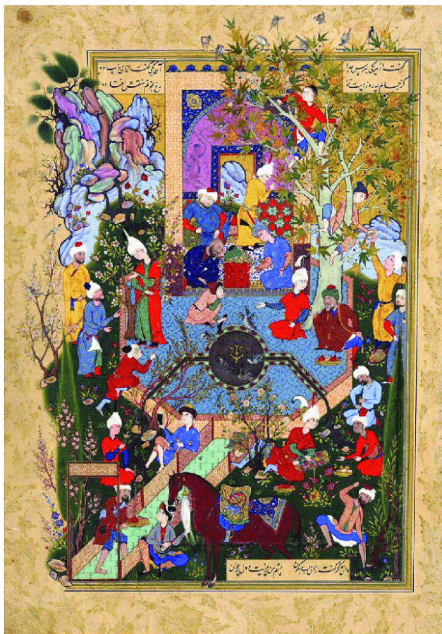
تصویر ۲. هفت اورنگ جامی، بزم شاهانه که در باغ و دل طبیعت جلوه‌گر شده، آنچه در باغ و کوشک بوده (گردش آب، درختان چنار، سرو و شکوفه و...) همگی به شکل واقعی تصویر شده‌اند.