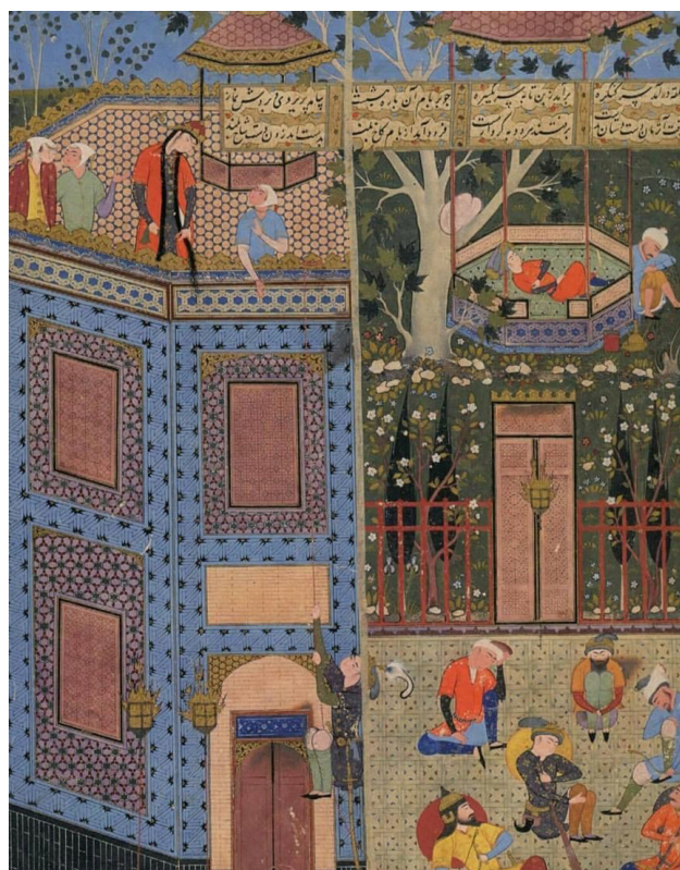
تصویر ۳. به تصویر کشیدن داستان زال و رودابه از شاهنامه فردوسی، رودابه بر فراز بام.

تأکید کرد که سینما همچون بسیاری از رسانه‌های ارتباط جمعی از جمله عواملی است که بخشی از تخیل ما درباره شهر از طریق آن رقم می‌خورد و می‌تواند به تخیل ما در باب شهر سامان بخشد (رادورد و محمودی، ۱۳۹۴). لذا، یکی از منابع بسیار مهم جهت بازشناخت فضای بام و نقش‌های آن در شهرهای ایرانی و زندگی روزانه مردم، آثار سینمایی معاصر است چرا که بسیاری از آن‌ها در ارتباط با زندگی عامه مردم و وقایع جاری در خانه‌های آن‌ها بوده است. فیلم‌های سینمایی زیادی با محوریت فضای خانه، خصوصاً بام خانه‌های ایرانی در سینمای معاصر ایران ساخته شده است که چند مورد از آن‌ها همچون طوقی، غریبه و کاکو در این پژوهش مورد بررسی قرار گرفته است. از جمله صحنه‌های پرتکرار در این فیلم‌ها، صحنه‌های نشان دهنده پرواز دسته جمعی کبوترها بر فراز بام یا ارتباط ساکنان خانه با کبوترهاست که از بارزهای نقش