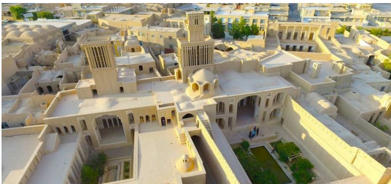
تصویر ۱۱. کیفیت‌های فضایی بام؛ بخشی از بافت مسکونی شهر ابرکوه. مأخذ: www.irantrawell.com