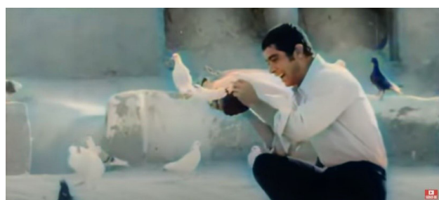
تصویر ۵. بام به عنوان بستری جهت ارتباط ساکنان با طبیعت، سکانشی از فیلم طوقی (کارگردان: علی حاتمی- سال ساخت: ۱۳۴۹).