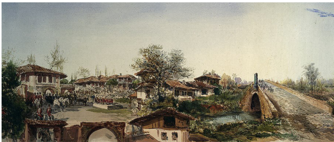
تصویر ۲. تأکید بر فرم و رنگ بام و تصویر هماهنگ شهر در نقاشی پاول پیاستسکی، نقاش روس، از شهر رشت.