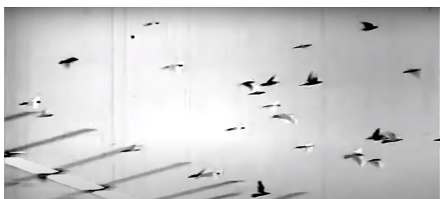
تصویر ۶. پرواز کبوترها در آسمان شهر و بر فراز بام‌ها، سکانشی از فیلم کاکو (کارگردان: شاپور قریب- سال ساخت: ۱۳۵۰). مأخذ: نماگرفت از فیلم کاکو.