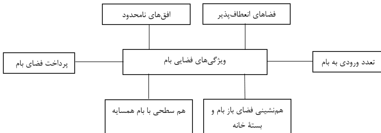
تصویر ۱۰. ویژگی‌های فضایی بام که نشان از نقش‌های هویتی، اجتماعی و ارتباط با طبیعت دارند.

فضاهای انعطاف‌پذیر: در عین توجه به کیفیت‌های فضایی از جمله ایجاد دسترسی مناسب، پرداخت فضاهای روی بام (از جمله بادگیر و خیش‌خون)، بام‌ها دارای فضایی انعطاف‌پذیر جهت فعالیت‌های گوناگون اهل خانه همچون صرف شام،