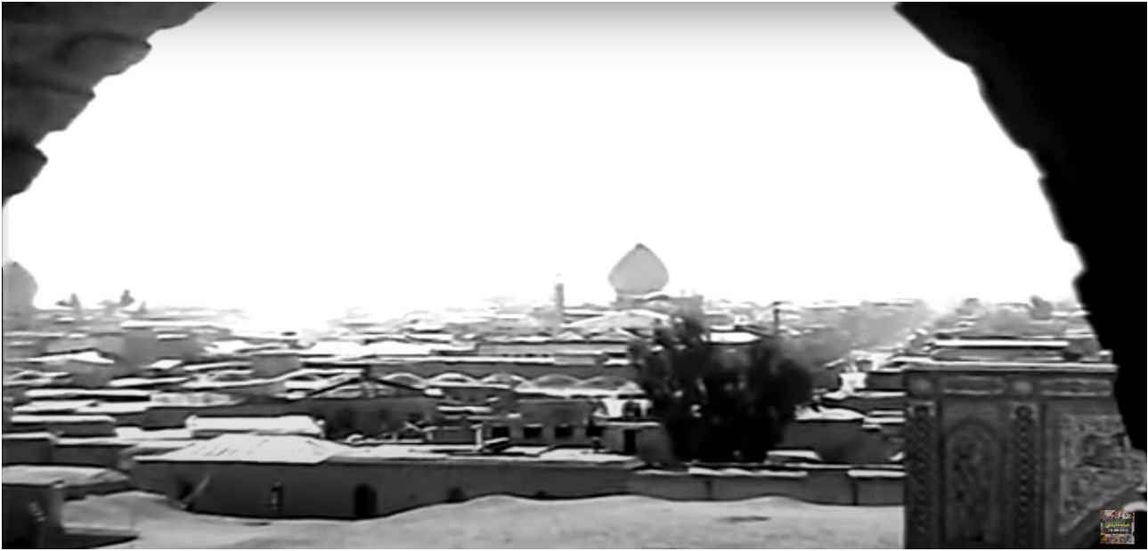
تصویر ۹. جایگاه بام‌ها در تصویر شهر در یکی از سکانس‌های فیلم قدیمی کاکو (کارگردان: شاپور قریب - سال ساخت: ۱۳۵۰).