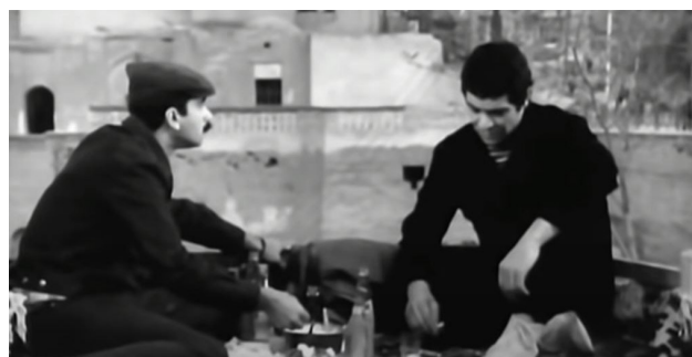
تصویر ۷. بام به عنوان فضای تعامل و صرف غذا در کنار هم، یکی از سکانشی‌های فیلم سینمایی غریبه (کارگردان: شاپور قریب- سال ساخت: ۱۳۵۱).