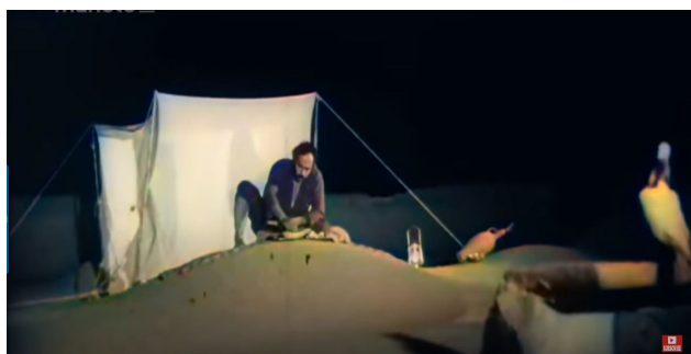
تصویر ۸. برپایی پشه‌بند و خوابیدن اعضای خانواده روی بام، سکانشی از فیلم طوقی (کارگردان: علی حاتمی- سال ساخت: ۱۳۴۹).