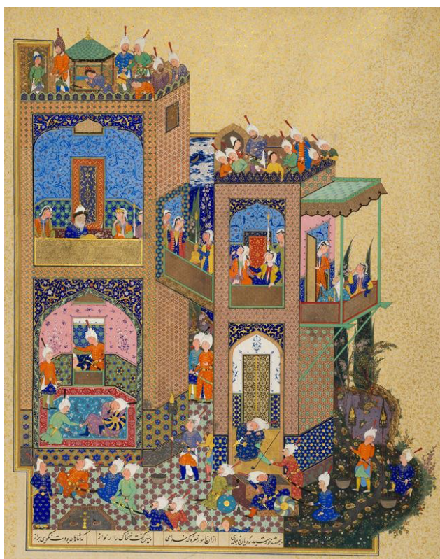
تصویر ۴. به تصویر کشیدن داستان ضحاک و کاوه آهنگر از شاهنامه فردوسی.