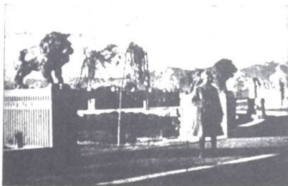
در انهای خیابان شیر میدان حلوی باغ شاه

عدم وجود بانک اطلاعاتی از مجسمه های میدانی تهران که برای بررسی تاریخی از ضروریات است از یک سو و مواجهه با ثبت تاریخ های متفاوت از یک اثر به ویژه مجسمه میدان حر از سوی دیگر، نگارنده را در راستای انجام رساله دکتری خود با عنوان «زیبایی شناسی مجسمه های شهری تهران در دو دهه اخیر (۱۳۶۹ تا ۱۳۸۹)» ترغیب داشت به توصیفات موجود در سفرنامه ها، روزنامه ها و جراید دوران گذشته که اتفاقاً اسناد مهمی برای کسب اطلاعات مجسمه ها محسوب می شوند، جهت اطلاع از تاریخ نصب مجسمه ها رجوع کند. بازتاب اتفاقات در خصوص مجسمه های شهری که از مظاهر مدرنیسم به شمار می رفت، یکی از اخبار مهم جراید وقت دوران پهلوی به شمار می رود. در این راستا، روزنامه اطلاعات