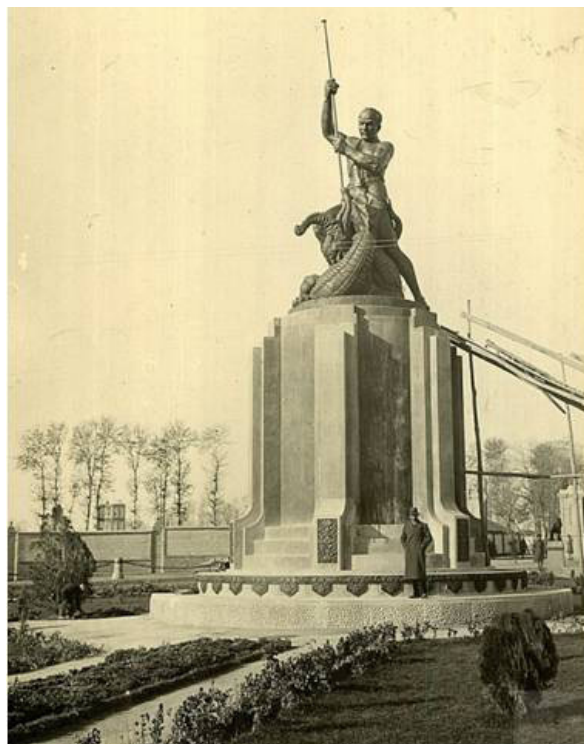
تصویر ۲. عکسی برداشت‌شده از میدان حر فعلی تهران که تاریخ آن (۱۴/۱۰/۱۲) در پشت عکس مشهود است. مأخذ: آرشیو سازمان اسناد و کتابخانه ملی جمهوری اسلامی ایران.