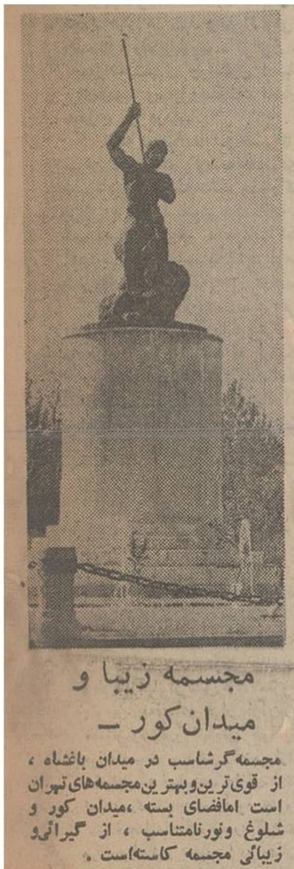
تصویر ۵. تصویر مجسمه با اطلاق نام مجسمه‌گرشاسب در روزنامه اطلاعات. مأخذ: روزنامه اطلاعات، ۲۷ فروردین ۱۳۵۴، ۵.