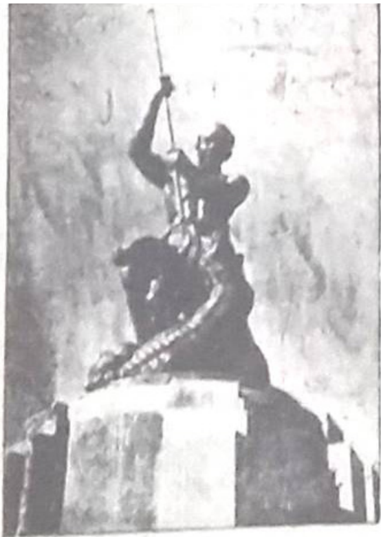
مجسمه سوم اسفند در میدان سوم اسفند (میدان جاری باغ شاه)

شهردار امروز طی گفتگویی با خبرنگاران گفت: چند خانه واقع شده در مسیر این امتداد تا پایان سال بوسیله شهرداری تخریب شده و پس از انتقال صاحبان آنها به خانه های جدید، ساختمان خیابان شروع خواهد شد. شهردار اظهار داشت که ترافیک سی متری و آیزنهاور سرسام آور شده و برای آسوده کردن ترافیک این دو خیابان میبایست طرح امتداد سپه بمرحله اجرا درآید. طرح جدید شهرداری از قسمت غربی میدان باغشاه و مجسمه معروف گرشاسب پهلوان افسانه ای ایرانی که در وسط این میدان نصب گردیده به مرحله اجرا در می آید.