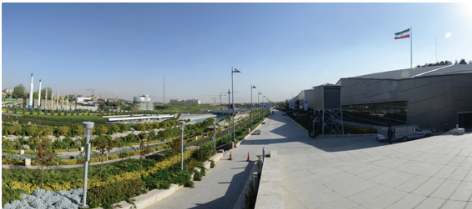
تصویر ۳ Pic3

Pic3: Garden Museum a base of lines for layout elements. Holy Defense Garden Museum, Tehran. Photo: Mehdi Dorkhah, 2011.