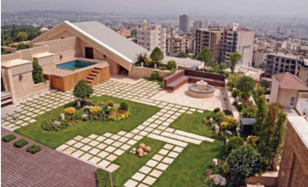
تصویر ۵: رویکرد تزئین‌گرا در طراحی منظر و تمایل به نوگرایی، طرح کلی باغ‌بام در تهران را تحت تأثیر قرار می‌دهد.

Pic5: Decoration orientation approach in landscape design and desire for modernity influence the outline of Garden Roof in Tehran.