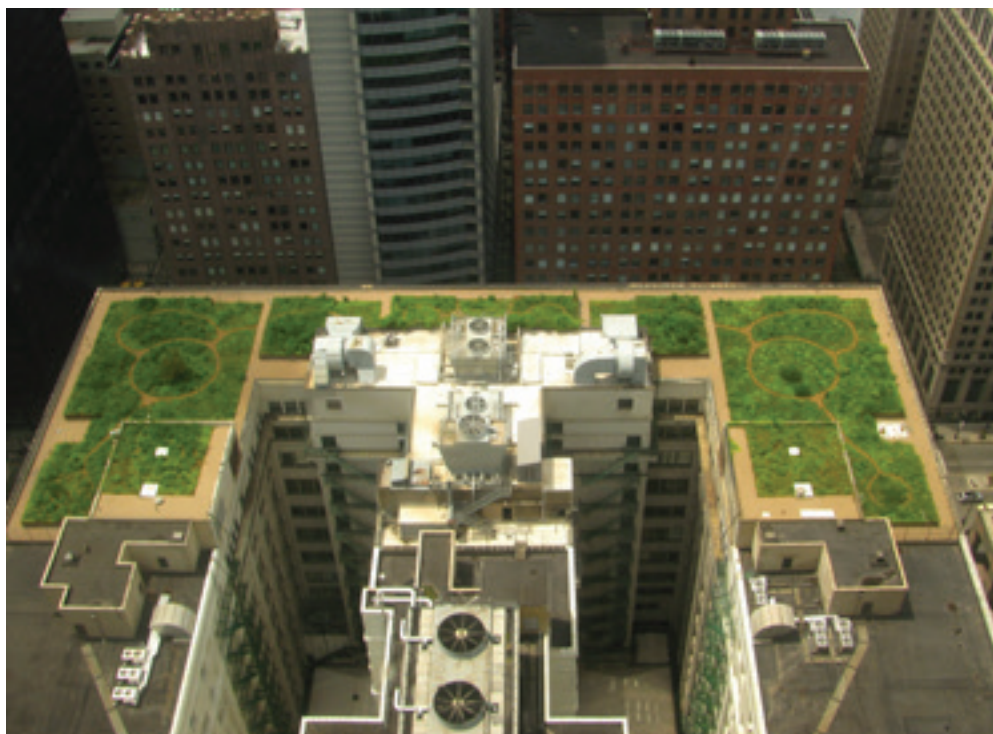
تصویر ۱ Pic1

Pic1: The green roof in 2001 with the aim of adjusting the temperature and reducing the heat island effect in the city was created on Chicago City Hall. The project won the 2002 America Landscape Architects (ASLA).