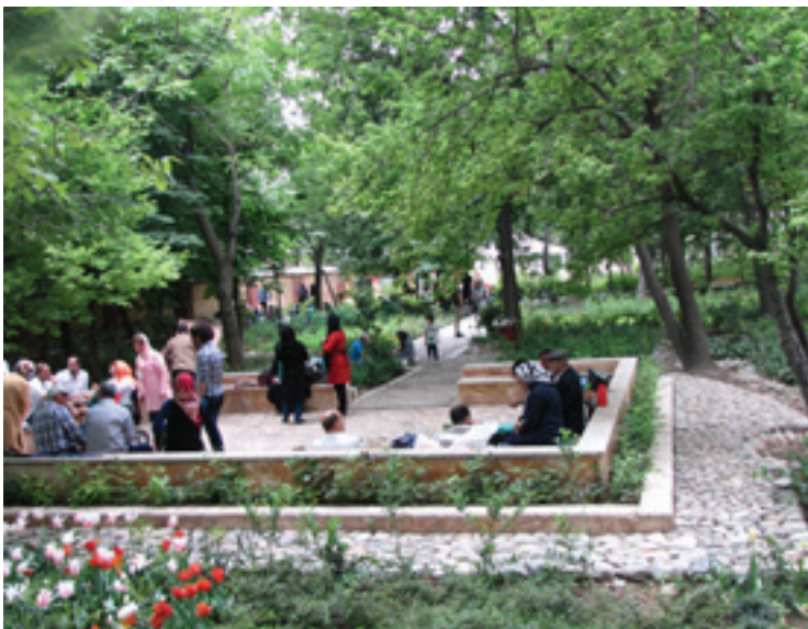
تصویر ۷ Pic7

مقدمه | نخستین نمونه از باغ‌های جدید که مصرف عمومی داشت، باغ ملی تهران بود که در میدان مشق به دستور رضاشاه برپا شد. پس از آن مدیریت شهری برای باغ‌سازی در تهران و ایران، روش غیرایرانی و التقاطی را بر پایه سلیقه‌های فردی که مبتنی بر دانش و هنر مشخصی نبود برگزید؛ الگوی باغ ایرانی در دوره معاصر کنار نهاده و «هیچ» جایگزین آن شد؛ تا آن‌جا که می‌توان گفت پارک‌های معاصر ایران محصول مدیریت‌های آمرانه و غیرمتخصص است (سلطانی، ۱۳۸۶). در پی لزوم تحول باغ‌سازی با نگاه تخصصی در پایتخت ۲۰۰ ساله ایران، پیشنهاد طراحی «باغ ایرانی» توسط مهندسین مشاور پژوهشکده نظر طی نامه‌ای در تاریخ ۱۳۸۶/۱۰/۰۴ به سازمان خدمات شهری شهرداری تهران ارائه شد. با توجه به سابقه حرفه‌ای و تخصصی، طراحی پروژه‌ای با الگوی باغ ایرانی در یک باغ قاچاری به این مشاور سپرده شد. سرانجام در سال ۱۳۹۱، باغ ایرانی ده‌ونک با مساحت ۳۴۰۰ مترمربع به عنوان اولین باغ