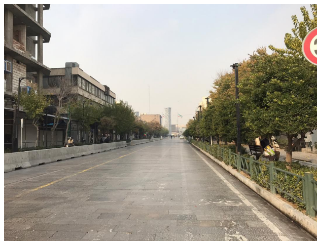
تصویر ۲. پیاده‌راه ۱۷ شهریور تهران که در روزهای عادی حضور مردم در آن بسیار کم است. عکس: مریم مجیدی، ۱۳۹۸.