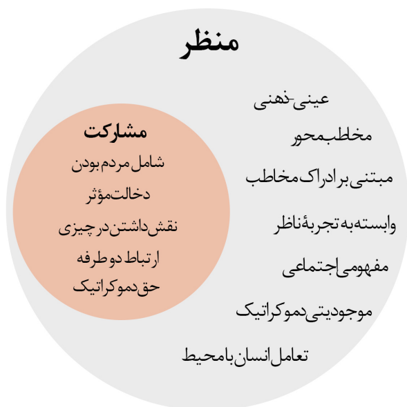
تصویر ۴. مشارکت به عنوان جزئی لاینفک از تعریف منظر و مفهومی در بطن آن.

رویکرد منظرین به دلیل آنکه تعریف خود را از ادراک مخاطب آغاز می‌کند و ذهنیت و ادراک او را جزئی لاینفک از منظر می‌شناسد، می‌تواند تأمین‌کننده حداکثر مشارکت باشد. ملاک قراردادن مخاطب و ذهنیت او به معنای تأمین دیدگاه‌ها و نظرات او خواهد بود و همین مسئله رضایتمندی مخاطب از محیط را به دنبال خواهد داشت. تعریف منظر به دلیل اینکه از ادراک مخاطب نشأت می‌گیرد، تعریفی از پایین به بالاست و همین دیدگاه ارتباط این مفهوم را با مشارکت مشخص می‌کند. بنابراین تعریف منظر نیازمند در نظر گرفتن مخاطب است. ادبیات مشارکت حق تصمیم‌گیری به صورت فردی را نمی‌کند اما اینکه چه کسی حق تصمیم‌گیری دارد را مشخص نمی‌کند، در حالی که رویکرد منظر می‌تواند پاسخگوی این سؤال باشد. این رویکرد با مشخص کردن جایگاه مخاطب، فضا و محیط را ساخته ذهن او می‌داند. در واقع شناخت ذی‌نفع در رویکرد منظر اتفاق می‌افتد؛ چیزی که حتی بسیاری از متخصصان نیز در شناخت آن دچار مشکل هستند. بنابراین در پاسخ به سؤال اصلی پژوهش که ظرفیت‌های منظر در تحقق مشارکت چیست؟ می‌توان گفت رویکرد منظرین به فضا و محیط. زیرا این رویکرد فضا را از نگاه مخاطب آن ادراک می‌کند، پس به‌طور ذاتی مفهوم مشارکت را در خود داشته و اساساً هرگونه تعریف دیگری از آن در صورت نادیده گرفتن مخاطب، تعریف خود منظر و رویکرد منظرین را دچار اختلال خواهد کرد. در نتیجه منظر بدون مشارکت مخاطب و ذهن او بی‌معنا بوده و در تعارض با معنای منظر است و حتی می‌توان گفت منظر چیزی به غیر از مشارکت مخاطب نیست. بنابراین مهم‌ترین و اصلی‌ترین ظرفیت آن، توجه به ذهن و ادراک مخاطب است.