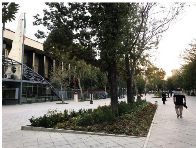
تصویر ۳. نمایی از گذر شهریار، تهران. عکس: مریم مجیدی، ۱۳۹۹.

این پژوهش از دو بخش اصلی تشکیل شد. بخش اول که به بررسی ادبیات مشارکت اختصاص داشت نشان داد صفت اصلی مشارکت، «مردم‌محور» بودن آن است و در مورد هر چیزی که به نوعی شامل مردم باشد استفاده می‌شود. از طرفی بررسی ادبیات منظر نیز نشان داد که یکی از شروط اساسی رویکرد منظر «مخاطب‌محور» بودن آن است. منظر از دید متخصصان و نخبگان تعریف نمی‌شود، بلکه از دید مخاطب تعریف می‌شود. منظور از مخاطب آن مخاطبی است که فعالانه در فرایند فهم و تولید فضا نقشی مؤثر و غیرقابل اجتناب دارد. بنابراین اقبال عمومی در آن از ملزومات است. هنگامی که واکنش و نظر بهره‌بردار به عنوان یکی از شروط ارزیابی منظر قرار بگیرد، به این معناست که منظر قدرت توسعه مشارکت و برقراری یک «مشارکت واقعی» را خواهد داشت. این نوع مشارکت، یک مشارکت تشریفاتی نیست. در سایر رشته‌های طراحی محیط همچون معماری و شهرسازی نیز از مشارکت صحبت می‌شود اما به‌نظر می‌رسد صحبت از یک نوع «مشارکت اختیاری» است که اگر وجود داشته باشد بهتر است و به افزایش کیفیت محیط کمک می‌کند ولی اگر وجود نداشته باشد ماهیت عمل دچار خدشه نخواهد شد. در صورتی که نوع مشارکت نهفته در مفهوم رویکرد منظر، یک نوع «مشارکت اجباری» است. زیرا در تعریف آن گفته می‌شود که رویکردی است مخاطب‌محور، در نتیجه ارزیابی آن وابسته به نظر مخاطب است. بنابراین وجه