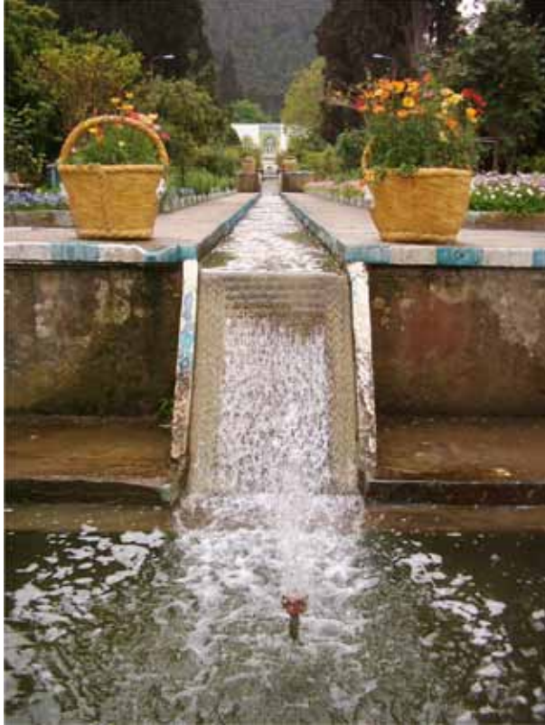
۳: بهره‌گیری از آب به شکل‌های مختلف و صفه‌بندی باغ در زمین‌های شیب‌دار، باغ عباس‌آباد بهشهر، عکس: نگارنده، ۱۳۸۳.