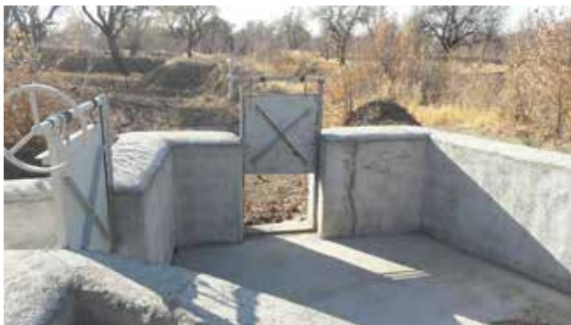
تصویر ۳. حوضچهٔ تقسیم آب.

الگوی کشت در باغستان سنتی به‌صورت مختلط و نامنظم است (تصویر ۲) و عمدتاً در یک باغ درختان پسته، بادام، زردآلو و سایر درختان بدون نظم خاصی قرار گرفته‌اند و در