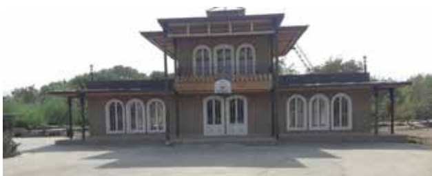
تصویر ۷. عمارت هفت‌درب بوستان ملا خلیلا. عکس: طاهره صالحی، ۱۳۹۶.