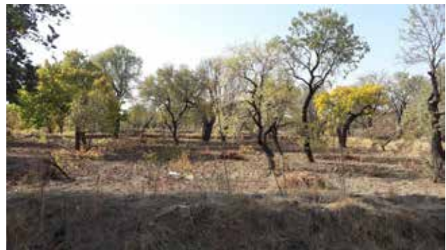
تصویر ۲. الگوی کشت مخلوط در باغستان سنتی. عکس: طاهره صالحی، ۱۳۹۶.