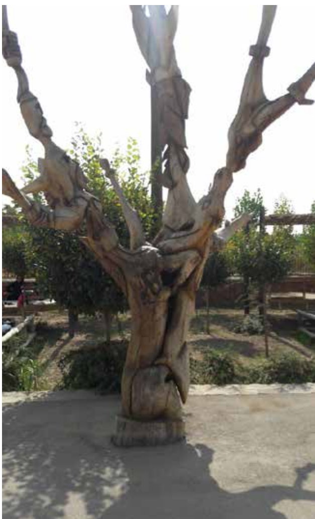
تصویر ۸. استفاده از هنر در تنه درختان خشک‌شده. عکس: طاهره صالحی، ۱۳۹۶.

بوستان مهیاکردن فضایی برای حضور خانواده‌هاست، استقبال خانواده‌ها از این بوستان برای پیکنیک و تفریح نشان می‌دهد. پارک در این هدف اولیه خود به‌رغم پایبندی به منظر باغستان موفق بوده است. جدول ۴ میزان موفقیت بوستان ملا خلیلا در برقراری پیوند با منظر باغستان سنتی قزوین را نشان می‌دهد.