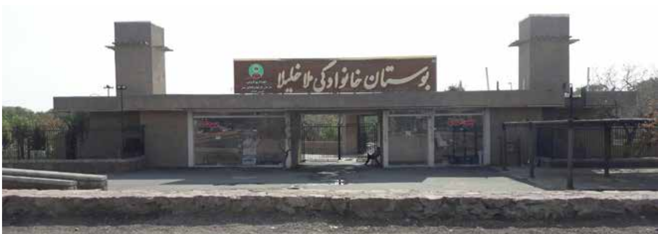
تصویر ۶. ورودی شمالی بوستان ملاخلیلا.

درختان موجود، همانند درختان باغستان قزوین شامل درختان پسته، بادام و گردو است. درختان پسته در باغ پسته به صورت منظم کاشته شده است، بنابراین در حوزه گونه گیاهی، پارک به گونه‌های سنتی پایبند بوده است، اما در شیوه کاشت و منظر عمومی کاشت، پارک با تغییر در ساماندهی گونه‌ها به منظر عمومی باغستان سنتی پایبند نبوده است. از قسمتی از سایت رودخانه عبور می‌کند که پل شاه جوی روی آن امکان استفاده از منظر زیبای رودخانه را فراهم می‌کند. همچنین برکه مرکز سایت بر تلطیف فضا می‌افزاید، هر چند عنصری الحاقی است که به خودی خود زیباست، اما با منظر باغستان سنتی تناسب و ارتباطی برقرار نمی‌کند. نکته دیگر در منظر این بوستان خانوادگی بودن فضای آن است. با توجه به اینکه یکی از اهداف