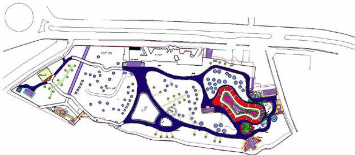
تصویر ۵. پلان بوستان ملاخلیلا.