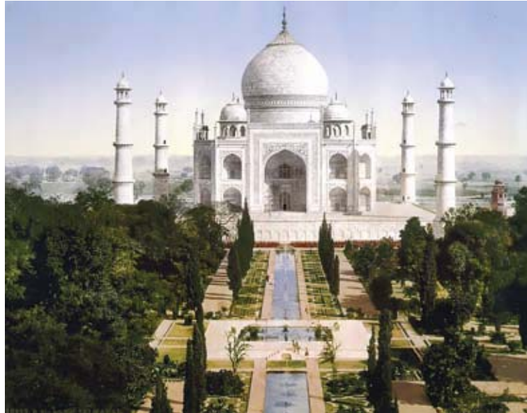
تصویر ۲: باغ آب با دید وسیع، حداقل درختان با کوشک عظیم، تاج محل.