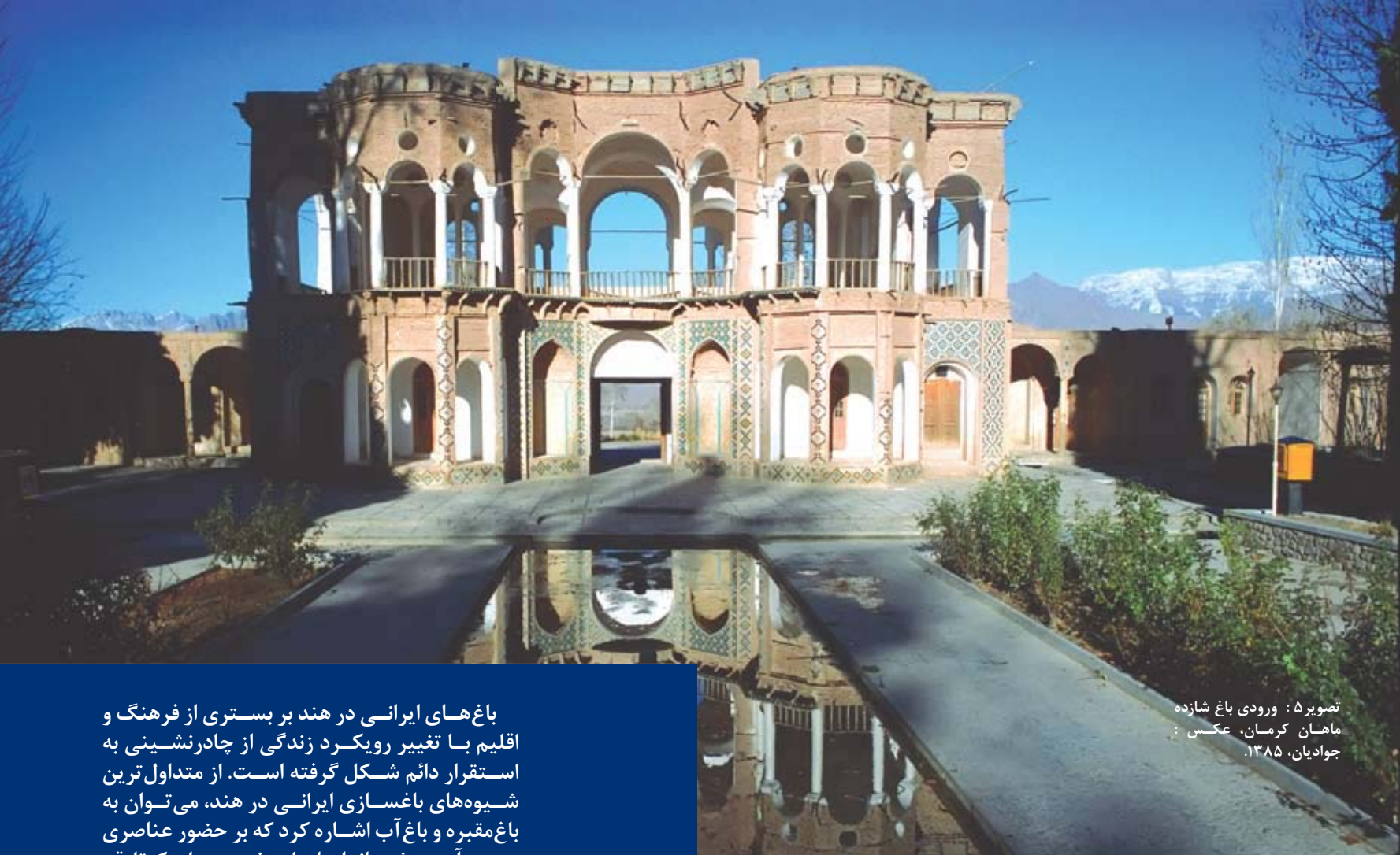
تصویر ۵: ورودی باغ شازده ماهان کرمان، عکس : جوادیان، ۱۳۸۵.

باغ‌های ایرانی در هند بر بستری از فرهنگ و اقلیم با تغییر رویکرد زندگی از چادرنشینی به استقرار دائم شکل گرفته است. از متداول‌ترین شیوه‌های باغسازی ایرانی در هند، می‌توان به باغ‌مقبره و باغ آب اشاره کرد که بر حضور عناصری چون آب، چشم‌انداز باز با درختچه‌های کوتاه‌قد تأکید می‌ورزد.