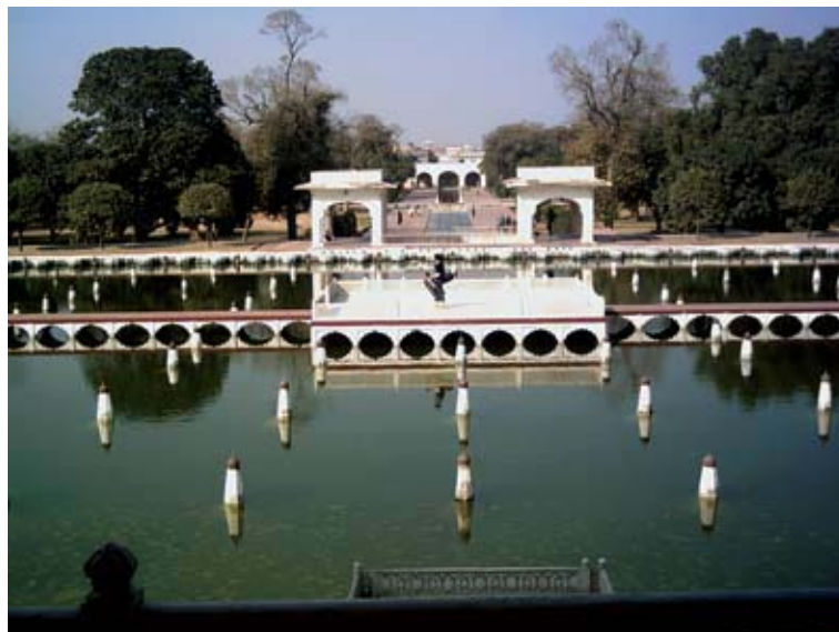
تصویر ۶: صفت‌های کنار استخر (باغ آب) ساخته شده به دستور شاه جهان، باغ شالیمار، ۴۲-۱۶۳۳م.