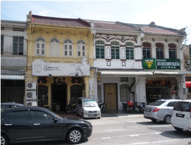
تصویر ۳: سبک کاملاً اروپایی با طاق‌های نیم دایره.

و مواد و مصالح موجود در آن منطقه برای ساخت‌وساز بوده است. این پدیده را می‌توان در مورد سیر تکاملی خانه-مغازه‌ها در مالزی مشاهده کرد. خانه-مغازه‌های اولیه کاملاً بومی بودند و مصالح اولیه آنها الوار بود که در خانه‌های بومی اتپ نیز از آن استفاده می‌شد. اگرچه کاملاً غیرممکن است که بتواند خانه-مغازه‌های سبک اتپ را در مطالعه حاضر پیدا کرد؛ اما شواهدی از حضور این سبک در گذشته وجود دارد. با نفوذ و ادغام اصول طراحی خارجی و نیاز به یک ساختار دائمی که بتواند ساختمان‌ها را از حوادث احتمالی در منطقه محافظت کند، سبک خانه-مغازه‌ها بسیار تغییر کرده است. در نتیجه، ساختارهای سنگی تکامل یافتند و روند ترکیب مشخصه‌های مختلف در خانه-مغازه‌ها با اصول طراحی مختلف بیشتر از گذشته ادامه یافت و مشخصه‌های جدید خارجی را نیز قرض گرفت. مرز باریک میان سبک‌های مختلف خانه-مغازه‌ها باعث عدم توافق میان محققان در شناخت سبک‌های متمایز شد. یافته‌های این مطالعه نشان می‌دهد که تنها دو سبک می‌تواند تحت عنوان کاملاً برجسته در نظر گرفته شود یعنی سبک اتپ و سبک آرت دکو (تصویر ۵). اکثر محققان آنها را در منتهی‌الیه یک خط، یعنی اواخر قرن نوزدهم و اواسط بیستم قرار دادند (Widodo, 2011). این تحقیق با توجه به رویکرد اکلکتیک (تلفیقی) آنها، به محققان پیشنهاد می‌کند که در طبقه‌بندی‌شان تمایز ایجاد کنند. یافته‌های این تحقیق نشان می‌دهد این طبقه‌بندی براساس سبک که به‌وسیله حسن و یحیی انجام گرفته، برای جورج تاون پنانگ مناسب است. اگرچه، به‌نظر می‌رسد دوره گذار گسترده‌تر از آن است که بتواند به دوره اولیه و نهایی تقسیم شود و سبک آرت دکو نیز می‌تواند به‌صورت دوره‌ای به سبک کاملاً اروپایی اضافه شود (جدول ۵).