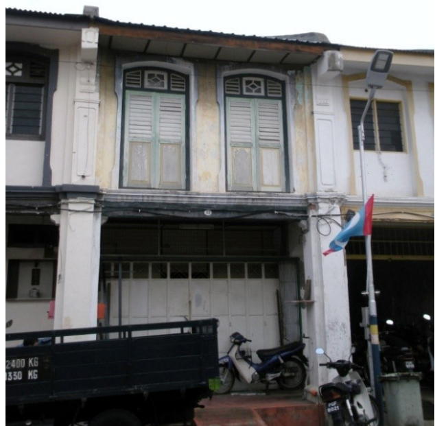
تصویر ۴: خانه-مغازه‌هایی با دو طاق کمانی در طبقه اول. عکس: آصف علی، ۱۳۹۷.

جدول ۴: تعداد مشخصه‌های هر گروه. مأخذ: نگارندگان.