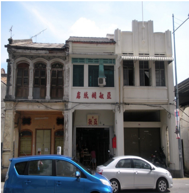
تصویر ۵: سبک آرت دکو. عکس: آصف علی، ۱۳۹۷.