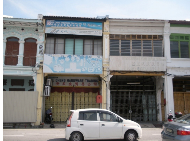
تصویر ۲: سبک خانه-مغازه‌های دائمی اولیه حتی پس از اصلاح نیز محسوس است.

و مواد و مصالح موجود در آن منطقه برای ساخت‌وساز بوده است. این پدیده را می‌توان در مورد سیر تکاملی خانه-مغازه‌ها در مالزی مشاهده کرد. خانه-مغازه‌های اولیه کاملاً بومی بودند و مصالح اولیه آنها الوار بود که در خانه‌های بومی اتپ نیز از آن استفاده می‌شد. اگرچه کاملاً غیرممکن است که بتواند خانه-مغازه‌های سبک اتپ را در مطالعه حاضر پیدا کرد؛ اما شواهدی از حضور این سبک در گذشته وجود دارد. با نفوذ و ادغام اصول طراحی خارجی و نیاز به یک ساختار دائمی که بتواند ساختمان‌ها را از حوادث احتمالی در منطقه محافظت کند، سبک خانه-مغازه‌ها بسیار تغییر کرده است. در نتیجه، ساختارهای سنگی تکامل یافتند و روند ترکیب مشخصه‌های مختلف در خانه-مغازه‌ها با اصول طراحی مختلف بیشتر از گذشته ادامه یافت و مشخصه‌های جدید خارجی را نیز قرض گرفت. مرز باریک میان سبک‌های مختلف خانه-مغازه‌ها باعث عدم توافق میان محققان در شناخت سبک‌های متمایز شد. یافته‌های این مطالعه نشان می‌دهد که تنها دو سبک می‌تواند تحت عنوان کاملاً برجسته در نظر گرفته شود یعنی سبک اتپ و سبک آرت دکو (تصویر ۵). اکثر محققان آنها را در منتهی‌الیه یک خط، یعنی اواخر قرن نوزدهم و اواسط بیستم قرار دادند (Widodo, 2011). این تحقیق با توجه به رویکرد اکلکتیک (تلفیقی) آنها، به محققان پیشنهاد می‌کند که در طبقه‌بندی‌شان تمایز ایجاد کنند. یافته‌های این تحقیق نشان می‌دهد این طبقه‌بندی براساس سبک که به‌وسیله حسن و یحیی انجام گرفته، برای جورج تاون پنانگ مناسب است. اگرچه، به‌نظر می‌رسد دوره گذار گسترده‌تر از آن است که بتواند به دوره اولیه و نهایی تقسیم شود و سبک آرت دکو نیز می‌تواند به‌صورت دوره‌ای به سبک کاملاً اروپایی اضافه شود (جدول ۵).