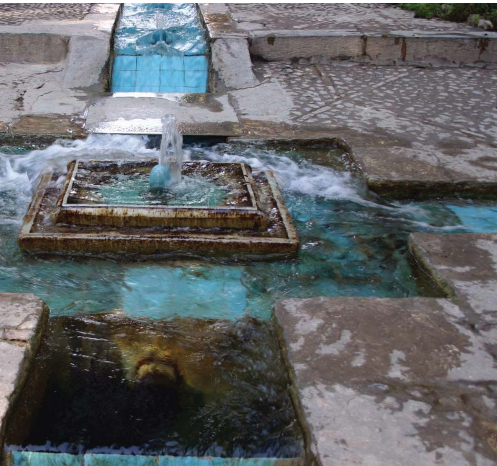
تصویر ۲: در ایده آل‌ترین حالت و در جزئیات باغ، آب از یک جهت وارد و از سه جهت دیگر خارج می‌شود. باغ فیسن. کاشان. عکس: وحید حیدرنتاج، ۱۳۸۷.