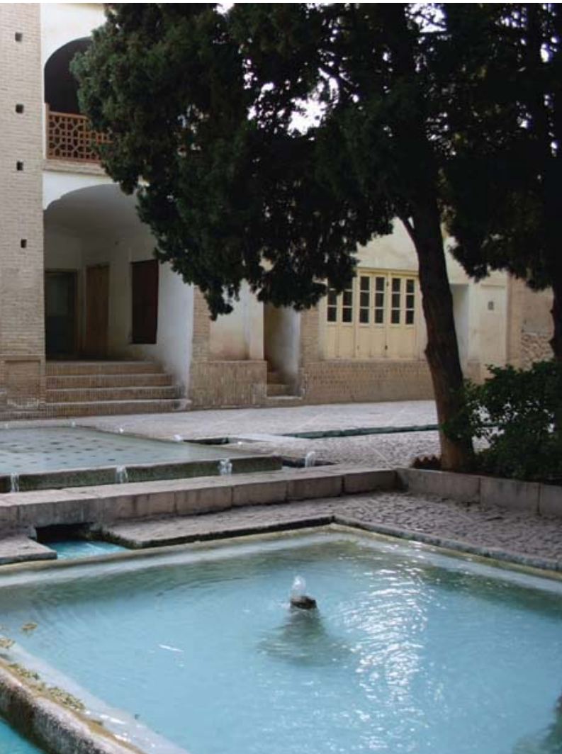
تصویر ۴: تأثیر معنوی بهشت را در باغ به صورت حضور عناصر ارزشمند طبیعی مانند آب می‌توان درک کرد. باغ فین، کاشان. ۱۳۸۷.