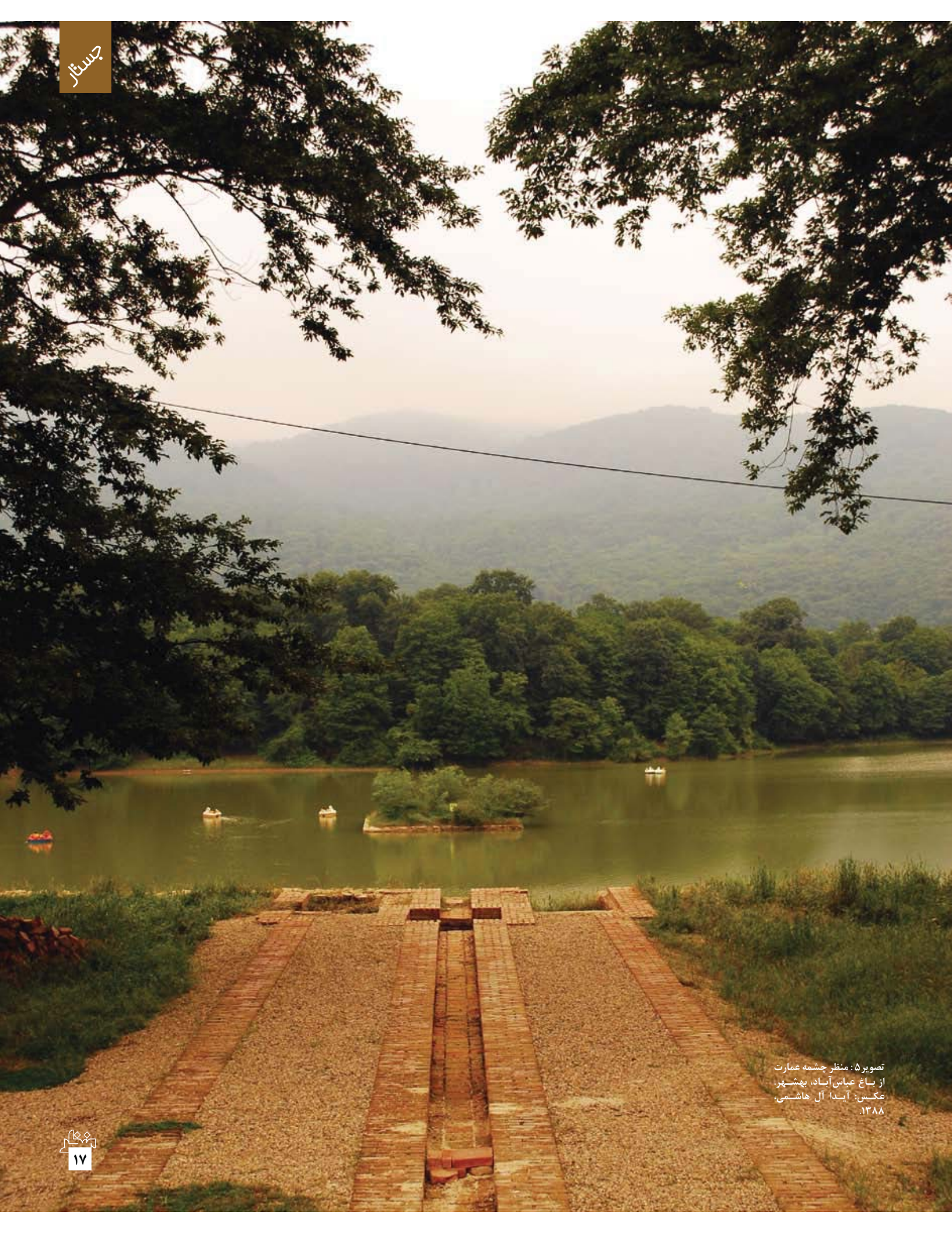
تصویر ۵: منظر چشمه عمارت از باغ عباس آباد، بهشهر. ۱۳۸۸.