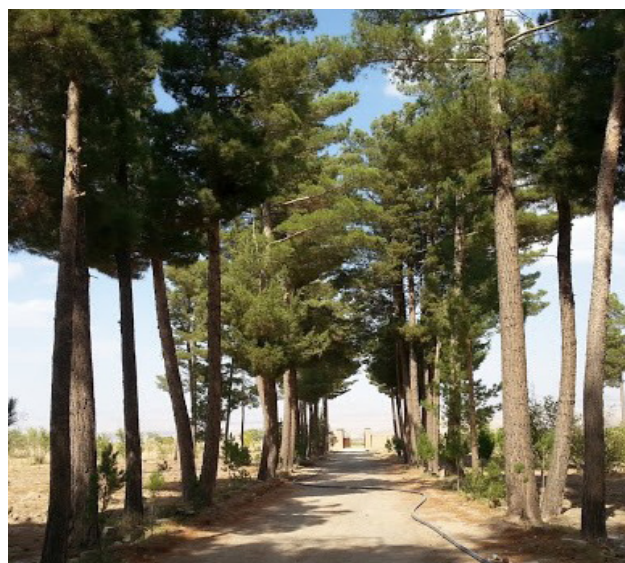
تصویر ۳: دید از محور اصلی باغ به سردر ورودی جبهه شمالی و عدم وجود آب در محور. عکس: مهدی فاطمی، ۱۳۸۴.

حیاط جنوبی که درواقع اندرونی باغ است دارای هشتی ورودی از سمت شمال است. وجود تخت‌گاه هشت‌ضلعی