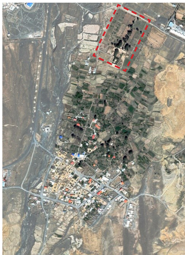
تصویر ۱: موقعیت قرارگیری باغ بهلگرد نسبت به روستا.