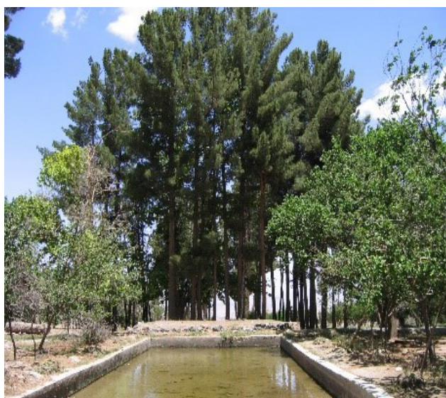
تصویر ۴: میان‌کرت در باغ بهلگرد، با توجه به یک طبقه بودن بنای سردر، دید مطلوبی به محور باغ وجود ندارد. عکس: مهدی فاطمی، ۱۳۸۴.

در اطراف محور اصلی، کرت‌ها بر هندسه باغ تأکید می‌کنند و اصول اولیه هندسی حاکم بر باغ ایرانی بر آنها نیز حاکم است. بخش اعظم باغ به این کرت‌های هندسی اختصاص یافته که برای کشت و زرع استفاده می‌شده است و می‌توان گفت، مالک باغ به نوعی زمین‌های زراعی خود