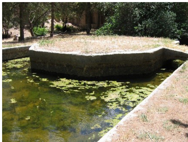
تصویر ۷: ساختار باغ بهلگرد؛ غلبه فضای کشت و سکونت در باغ مشهود است. عکس: مهدی فاطمی، ۱۳۸۴.