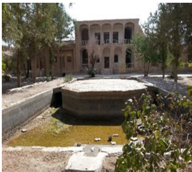
تصویر ۵: دید از محور اصلی باغ به سردر ورودی جبهه شمالی و عدم وجود آب در محور. عکس: مهدی فاطمی، ۱۳۸۴.

است که ابدیت، شکوه، بی‌کرانگی و بی‌نهایت را می‌نمایاند. این محور بی‌آنکه درصدد نمایش منظره‌ای پرداخته‌شده از باغ باشد، با بهره‌گیری از همه امکاناتی که پرسپکتیوهای مجازی و ساخته در فضا فراهم می‌آورد، چشم‌اندازی بی‌انتهای به وجود می‌آورد که بیننده را به درون آن فرامی‌خواند» (منصوری، ۱۳۸۴: ۵۹).