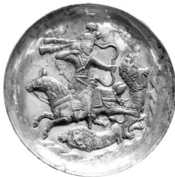
تصویر ۱-۱: بشقاب زرین و سیمین منقوش به تصویر شاهنشاه ساسانی شیرافکن. موزه تبریز.

واژگان کلیدی: عهد ساسانی، فرهاد تراش بیستون، معبد اناهیتای کنگاور، طاق بستان، دسکره.