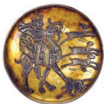
تصویر ۱-۲: بشقاب سیمین زراندود با نقش شکار شیر شده: بهرام پنجم و دخترش آزاده سوار بر شتر در حال شکار آهو. محل نگهداری: موزه ارمنستان، روسیه. مأخذ: محمدپناه، ۱۳۸۵:۱۹۱.

Keywords: Sassanid era, Tarāš-e Farhād of Bisotun, Anaitis temple in Kangāvar, Tāq-e Bostān in Kermānshāh, Daskara (Persian for hunting-park & pavilion).