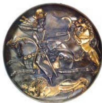
تصویر ۱-۲: بشقاب سیمین زراندود با نقش شکار شیر توسط پادشاه شاپور دوم ساسانی. محل نگهداری: موزه ارمنستان، روسیه. مأخذ: محمدپناه، ۱۳۸۵:۱۹۵.

چکیده: در متون تاریخی کلاسیک به شواهدی از معماری محیط و منظر و دسکره در ناحیه کرمانشاهان و بیستون عهد ملوک عجم و آکاسره اشاره شده است. از قدیمی ترین آنها «الأعلاق النفسیه» اثر «ابن رسته» (۲۹۰ ه. ق) و «المسالك الممالک» نوشته «اصطخری» (ح. ۳۲۰ ه. ق) به یادگار مانده است. شواهد باستان شناختی موجود، صحت این گزارش های تاریخی را تأیید و تأکید می کند که سه شکارگاه سلطنتی بیستون، طاق بستان و کنگاور تنها نمونه های نادر و منحصر به فرد از معماری محیط و منظر و ساخت کوشک و دسکره در ایران باستان هستند که تاکنون کشف و گزارش شده اند.