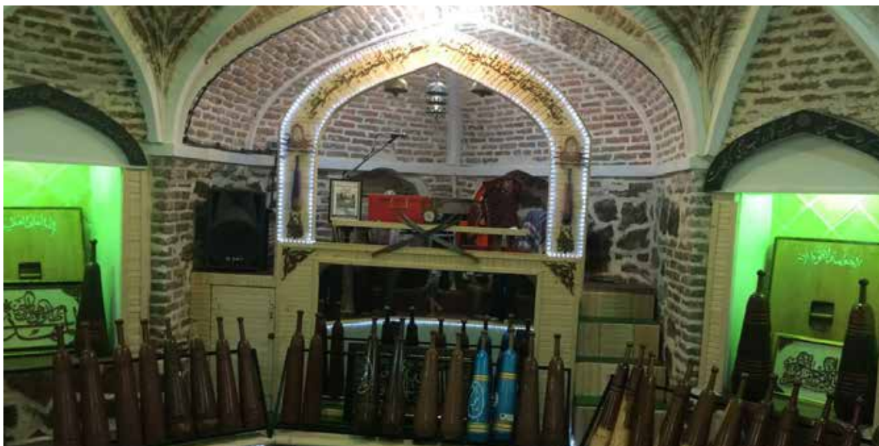
تصویر ۲: زورخانه سنتی امام علی (ع) در حمام تاریخی ششناو تفرش.

حمام نقش به‌سزایی در بسیاری از مراسم و آیین‌های مذهبی و ملی داشته است. قبل از هر عید حمام‌ها شلوغ می‌شدند (قبادی، ۱۳۸۶). به‌علاوه قسمتی از یا تمام برخی از مراسم در حمام برگزار می‌شده است (کریمیان سردشتی، ۱۳۸۲). به‌عنوان مثال حمام زایمان که برای مادر، نوزاد و همراهانشان برگزار می‌شد و