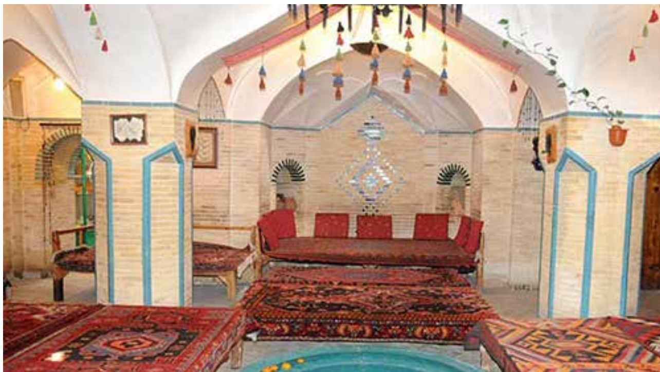
تصویر ۵: حمام تاریخی حاج داداش زنجان.

نگاه منظرین به حمام عمومی کمتر مورد توجه دست‌اندرکاران ابنیه تاریخی قرار گرفته است. در بسیاری از شهرهای تاریخی ایران، در حال حاضر حمام‌های قدیمی بازسازی شده‌اند و با کاربری موزه، چاپخانه، رستوران و غیره مورد بازدید گردشگران داخلی و خارجی قرار می‌گیرند (تصویر ۵). نکته مهم آنکه اغلب آنچه در این بازدیدها