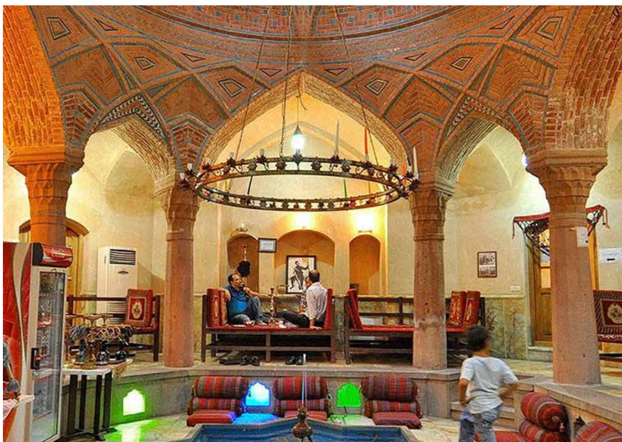
تصویر ۳: حمام نوبر تبریز.

علاوه بر آنکه عمل مشخص استحمام در حمام‌ها انجام می‌پذیرفت، این فضاها یک پایگاه اجتماعی مهم نیز به شمار می‌آمدند (رمضانی، ۱۳۸۴). حمام محل جمع‌شدن افراد مختلف بوده است (فخاری‌تهرانی، ۱۳۷۹). برای استحمام افراد باید جامه از تن بیرون آرند و برهنه شوند. بنابراین همه در صحن حمام یکسان بوده و لباس و پوشاکی که معرف موقعیت و منزلت اجتماعی باشد بر تن کسی نبوده است (روح‌الامینی، ۱۳۸۶). بنابراین افراد در جایگاهی یکسان قرار می‌گرفتند و به گونه‌ای تداعی روز محشر را داشته است. نداشتن لباس در حمام زمینه‌ساز ارتباطاتی خالی از تکلف بود (تصویر ۳).