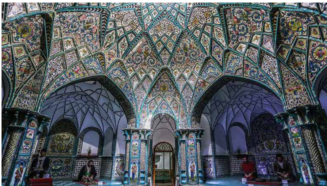
تصویر ۴: حمام تاریخی چهارفصل اراک.

اصلاح و نظافت در حمام صورت می‌پذیرفته است (قبادی، ۱۳۸۶). به‌گونه‌ای که یکی از کارکردهای مهم حمام اصلاح و تراشیدن سر و صورت، ازالۀ موهای سر و صورت، آرایش، حنا بستن، خضاب ریش و سدر گرفتن بوده است. قسمتی از بینه و گرم‌خانه به انجام این امور اختصاص داشته است (یزدان‌پرست لاریجانی، ۱۳۸۷)، (تصویر ۴).