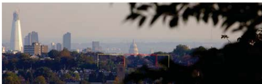
تصویر ۳ Pic3

pic3: The indicative threshold was carefully described from background to middle ground and lastly foreground for each 27 identified viewing corridors in London, which had been graphically in 3D for report of in sight management framework plan.