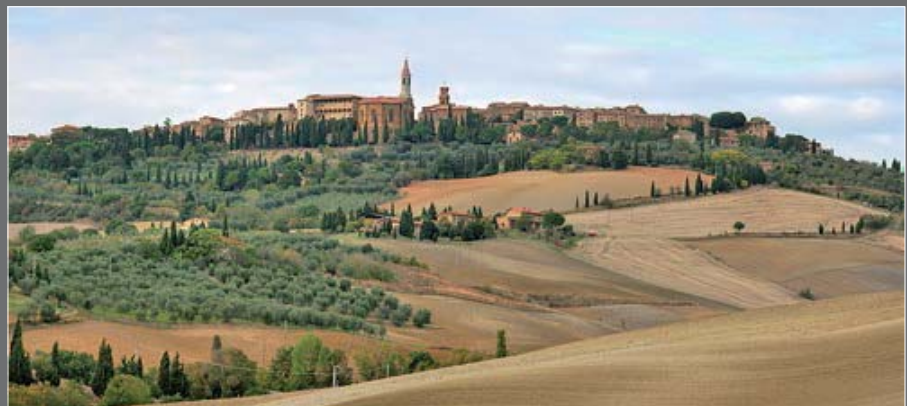
تصویر ۲ Pic2

Pic2: Italian Renaissance gardens are examples of landscapes that are designed to promote the concept of nature. Pienza city of Tuscan encompasses many gardens and it is registered in the World Heritage List.