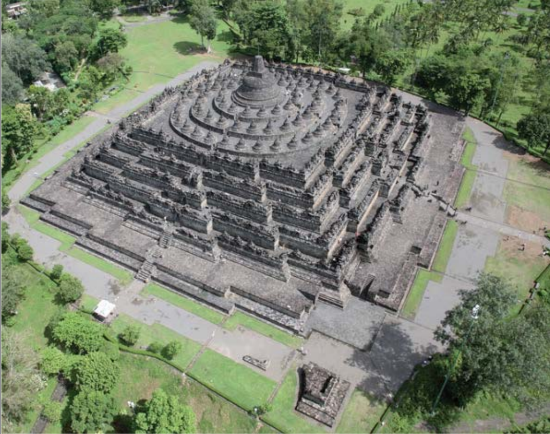
تصویر ۳ Pic3