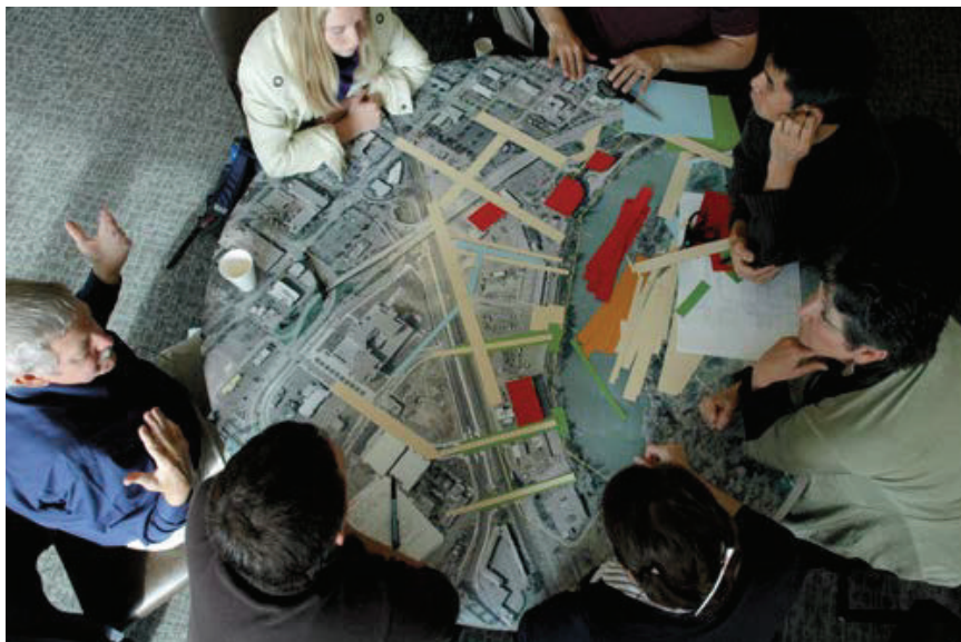
تصویر ۲ Pic2

تصویر ۲: در برنامه ریزی های اجتماعی نوسازی برای در نظر گرفتن جنبه هایی چون حس تعلق در محله لازم است از تجربیات برنامه ریزان و مددکاران اجتماعی استفاده شود.