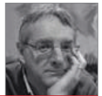
سامون بل استاد معماری منظر، دانشگاه ادینبورگ

چکیده | سازمان نوسازی شهر تهران مطالعات گسترده‌ای را بر روی خصوصیات مختلف بافت‌های فرسوده انجام داده است که مشکلات آنها را می‌توان به دسته‌های مختلفی مانند مشکلات فضایی، اجتماعی، محیط‌زیستی، قانونی و اقتصادی تقسیم کرد. این مشکلات با اینکه در دسته‌بندی‌های مختلف طبقه‌بندی می‌شود، اما هر یک روی دیگری تأثیر می‌گذارد. فارغ از نظریاتی که سازمان نوسازی در سال‌های اخیر ارائه کرده، اساسی‌ترین رویکرد این سازمان در برخورد با این بافت‌ها، تغییر شبکه‌بندی معابر و تعریض آنها جهت تسهیل ترافیک درون شهری بوده است. این مقاله سعی دارد تأثیر این روند را بر فضاهای باز بافت‌های فرسوده و زندگی اجتماعی جاری در آنها و در نتیجه هویت تاریخی و اجتماعی حاکم بر آنها بررسی کند. در این راستا خیابان و زندگی خیابانی بافت‌های فرسوده مورد توجه بیشتری قرار می‌گیرند.