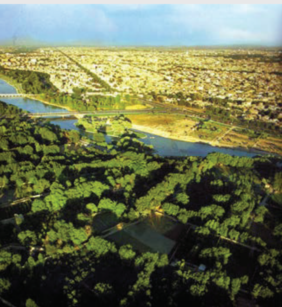
Pic 2 : Soil Order in Historic city Isfahan, Iran.

خاص خود (و نه با تکیه بر فناوری جدید) در بستر طبیعی شکل گرفته، توسعه یافته و بخشی از کلیتی فراتر به نام سرزمین و قلمرو فرهنگی است. در حقیقت استقرار گروه انسان‌ها در محیطی خاص و تعامل با طبیعت با عاملیت فرهنگ حاکم بر رفتار و زندگی، سبب تبلور کالبد سکونت‌گاه و شکل‌گیری خرده فرهنگی خاص و متفاوت از سایرین همچون مناظر فرهنگی روستاهای ایران ماسوله و ایبانه می‌شود. در روستاها و شهرهای ایران شاهد خرده فرهنگ‌ها و میراث‌های معنوی زیادی هستیم؛ در روستایی به نام ورزنه، خانم‌ها چادرهای سفید و در روستایی دیگر به نام اژیه، چادرهای گل‌دار بر سر می‌کنند. شکل‌گیری چنین خرده فرهنگی، در محیط طبیعی روستا و تعامل انسان با آن نهفته است، بدین گونه که در ورزنه و اژیه دشت‌ها به ترتیب زیر کاشت گیاه پنبه و گل می‌روند. تفاوت نوع پوشش و نوع کشت از طریق دقت در سازمان برخاسته از ساختار فرهنگی، تاریخی و