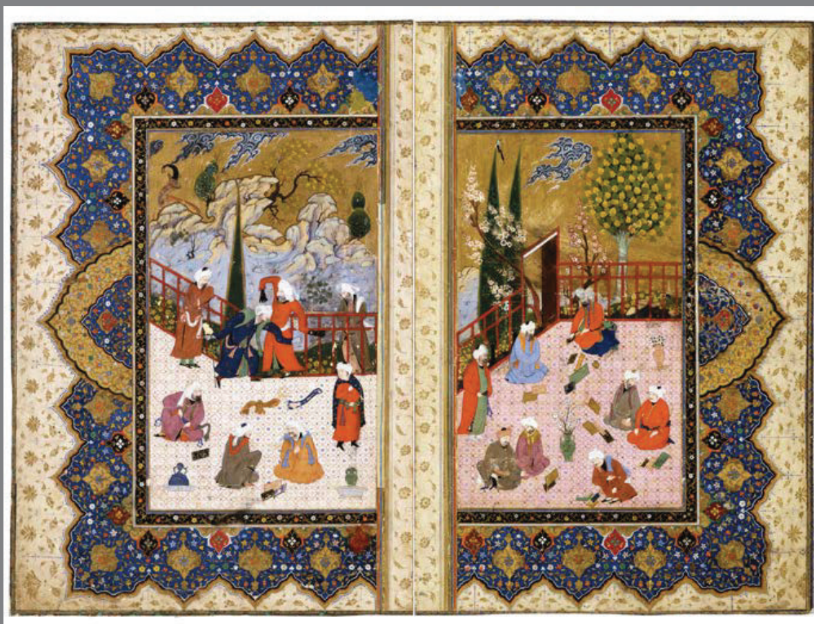
تصویر ۳ Pic3

Pic3: Nature in traditional Iranian poetry and illustration was a platform for events. In this approach nature has an objective role in a one-way interaction with human. In this picture, the nature and its element (even selected element like cypress) as depicted as the background.