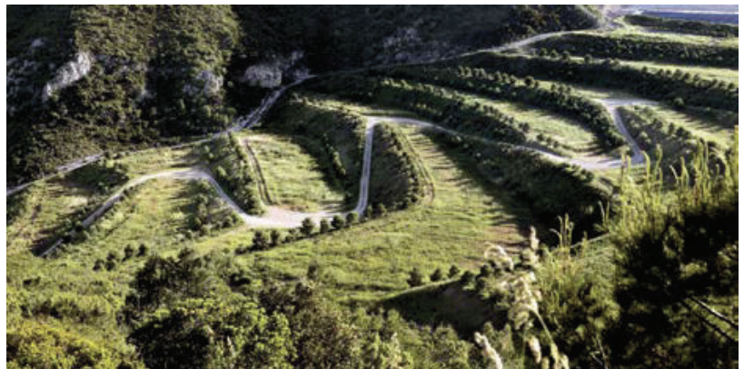
تصویر ۳: احیای دره دفن زباله ژوان، رویکردی پوششی با الهام از زمین‌های کشاورزی اطراف را دنبال کرده است. دره ژوان، اسپانیا.

منظر بهیافتی، تعامل معماری منظر و هنرهای تجسمی معماری منظر، بیش از همه هنرها با قواعد هنرهای تجسمی سروکار دارد. این گروه از هنرها به دلیل بهره‌گیری از ماده در خلق آثار خود امکان ارتباط مستقیم بیننده با اثر را فراهم می‌کنند. نحوه ادراک این آثار براساس مواجهه با اثر و تأثیر بر حواس انسان است. چنانچه یکی از اهداف هنر محظوظ کردن مخاطب و ارضای تمایلات زیباپسند او باشد، این عمل در مورد هنرهای تجسمی از طریق ارتباط با احساسات انسان به دست می‌آید.