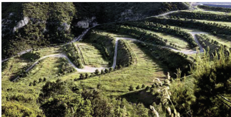
تصویر ۳: احیای دره دفن زباله ژوان، رویکردی پوششی با الهام از زمین‌های کشاورزی اطراف را دنبال کرده است. دره ژوان، اسپانیا.

منظر بهیافتی، تعامل معماری منظر و هنرهای تجسمی معماری منظر، بیش از همه هنرها با قواعد هنرهای تجسمی سروکار دارد. این گروه از هنرها به دلیل بهره‌گیری از ماده در خلق آثار خود امکان ارتباط مستقیم بیننده با اثر را فراهم می‌کنند. نحوه ادراک این آثار براساس مواجهه با اثر و تأثیر بر حواس انسان است. چنانچه یکی از اهداف هنر محظوظ کردن مخاطب و ارضای تمایلات زیباپسند او باشد، این عمل در مورد هنرهای تجسمی از طریق ارتباط با احساسات انسان به دست می‌آید.