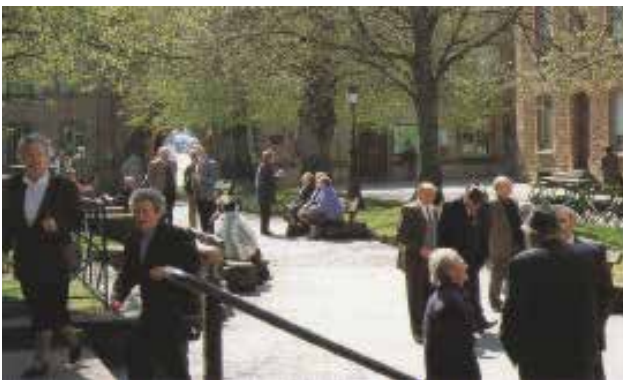
تصویر ۱۱: سایه قدیمی درختان به لیمو (درختان کهنسال که حکایت از قدمت محل و بناهای مقدس آن دارند).

پیوند با طبیعت، نیاز به معنویت و حال و هوای روحانی در زندگی مدرن و پرمخاطره امروز حفظ کرده‌اند. حمایت از این جریان اجتماعی و معرفتی، نگهداری از این میراث تاریخی-آئینی نیازمند شناخت صحیح و دور از خرافه و ساماندهی مکان‌های مرتبط با آنها است. برخی از این مکان‌ها در اثر توسعه‌های بی‌رویه و عدم شناخت متولیان از بین رفته است یا کمتر به آن رسیدگی می‌شود. ایجاد امکانات رفاهی و مدیریت برنامه‌های فرهنگی موجب رونق گردشگری آئینی می‌شود. آئین‌ها نمود بیرونی باورها و اعتقاداتی است که از فرهنگ جامعه برمی‌خیزد؛ مطالعه و شناخت آنها