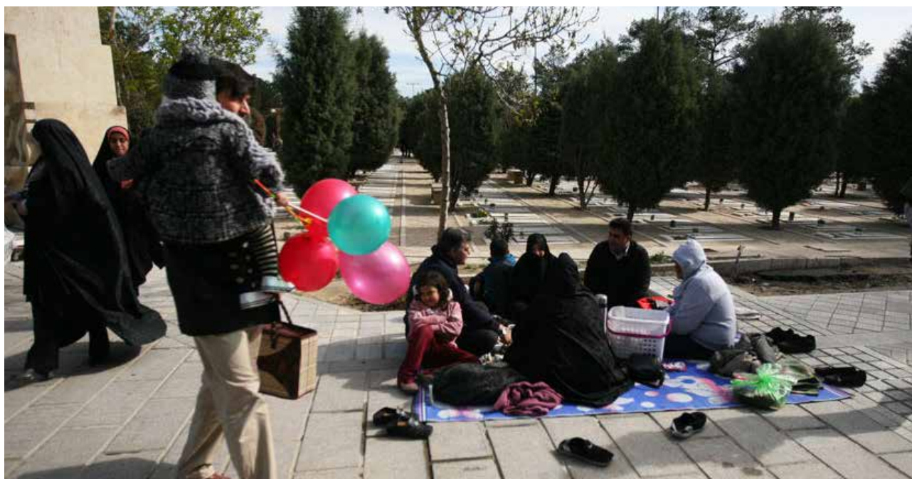
تصویر ۵: گورستان بهشت زهرا-تهران. افراد با گردهمایی و مراسم فاتحه‌خوانی به یاد عزیزان از دست رفته، سنت زیارت و تفریح را توأمان به‌جا می‌آورند، تهران.

سفرهایی که در ایام تعطیل نظیر نوروز، اعیاد مذهبی و ایام عزاداری سالار شهیدان به پابوس امامان معصوم و امامزادگان، انجام می‌شود نیز از همین جمله‌اند و به‌گونه‌ای گردش و استراحت را با حال‌وهوای روحانی و معنوی در هم می‌آمیزد (تصویر ۲). در گذشته در سفرهای زیارتی تا یک ماه به مشهد مقدس و گاه شش ماه را در کربلای معلّو و در جوار حرم امام حسین (ع) و حضرت علی (ع) ساکن می‌شدند. از نسل میان‌سال امروز شاید در