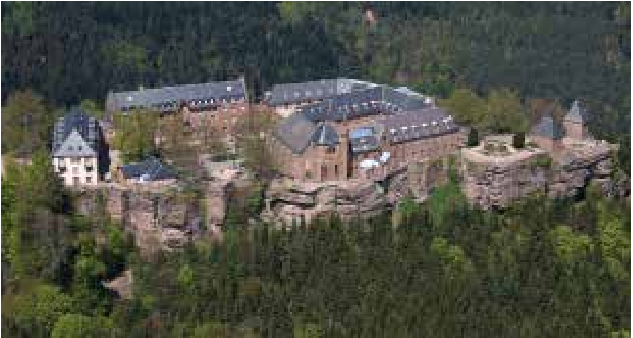
تصویر ۸: تپه سنت اودیل، ایالت آلزاس - فرانسه، مجموعه صومعه-کلیسا.