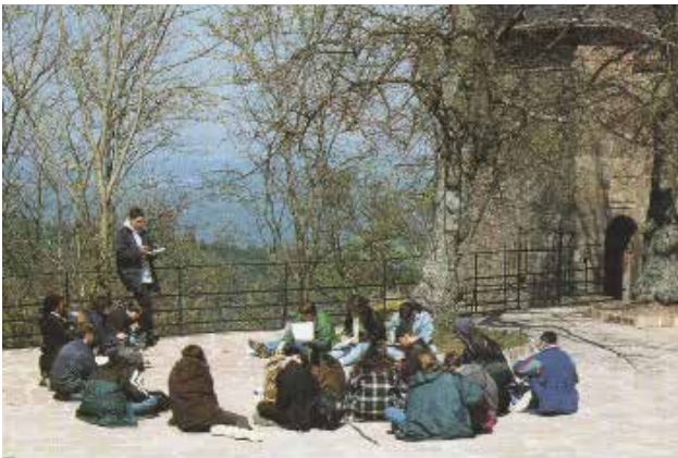
تصویر ۹: مکانی زیارتی-تفریحی برای استفاده تمام گروه‌های سنی.

پیوند با طبیعت، نیاز به معنویت و حال و هوای روحانی در زندگی مدرن و پرمخاطره امروز حفظ کرده‌اند. حمایت از این جریان اجتماعی و معرفتی، نگهداری از این میراث تاریخی-آئینی نیازمند شناخت صحیح و دور از خرافه و ساماندهی مکان‌های مرتبط با آنها است. برخی از این مکان‌ها در اثر توسعه‌های بی‌رویه و عدم شناخت متولیان از بین رفته است یا کمتر به آن رسیدگی می‌شود. ایجاد امکانات رفاهی و مدیریت برنامه‌های فرهنگی موجب رونق گردشگری آئینی می‌شود. آئین‌ها نمود بیرونی باورها و اعتقاداتی است که از فرهنگ جامعه برمی‌خیزد؛ مطالعه و شناخت آنها