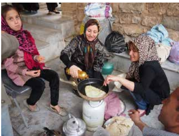
تصویر ۵: گردش و پختن غذای نذری در مقبره بی بی شهربانو، تهران. عکس: ایو لوژنبول، ۱۳۹۳.