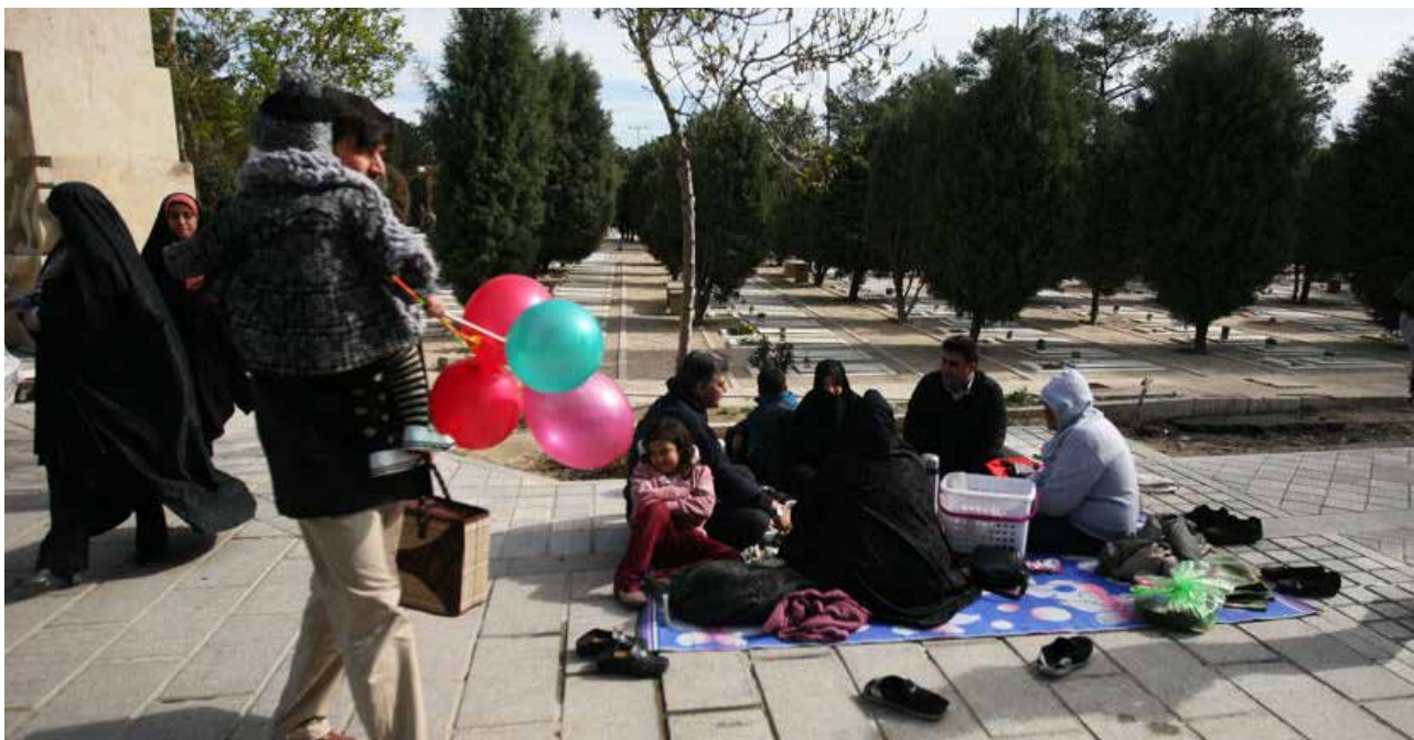
تصویر ۵: گورستان بهشت زهرا-تهران. افراد با گردهمایی و مراسم فاتحه‌خوانی به یاد عزیزان از دست رفته، سنت زیارت و تفریح را توأمان به‌جا می‌آورند، تهران.

سفرهایی که در ایام تعطیل نظیر نوروز، اعیاد مذهبی و ایام عزاداری سالار شهیدان به پابوس امامان معصوم و امامزادگان، انجام می‌شود نیز از همین جمله‌اند و به‌گونه‌ای گردش و استراحت را با حال‌وهوای روحانی و معنوی در هم می‌آمیزد (تصویر ۲). در گذشته در سفرهای زیارتی تا یک ماه به مشهد مقدس و گاه شش ماه را در کربلای معلّا و در جوار حرم امام حسین (ع) و حضرت علی (ع) ساکن می‌شدند. از نسل میان‌سال امروز شاید در