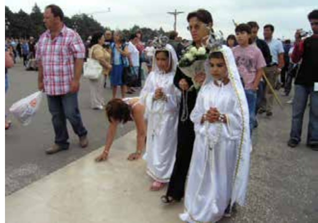
تصویر ۷: زیارتگاه فاطیما، لیسبون، پرتغال.