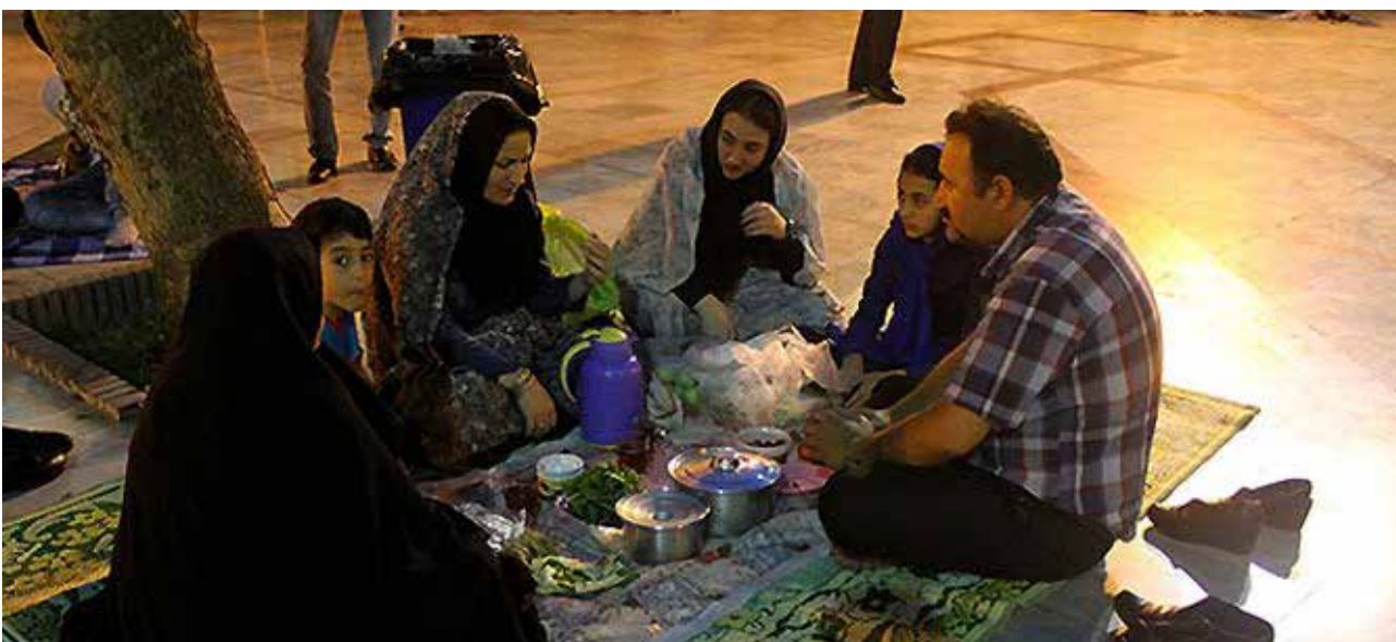
تصویر ۵: زیارت و گردش آئینی در امامزاده صالح، شمیران، تجریش، تهران.