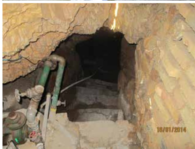
تصویر ۴: چشمه و غار مقدس در مقبره بی بی شهربانو، تهران.

فرانسه از این نمونه‌هاست که زائران پای پیاده و بعضاً روی زانو با شمع و تسبیح و ذکرگویان در راه مقدس گام برداشته و به امید برآورده شدن حاجت به کوه، چشمه و غار که نمادهایی از رویدادهای تاریخی- مذهبی است، متوسل می‌شوند. آیین‌هایی که در این زیارت و گردش مرسوم بوده و تاکنون تداوم یافته، شباهت‌هایی با رسوم گردشگری مذهبی-آئینی ایرانیان دارد (تصاویر ۸ تا ۱۱). تابستان ۱۳۹۰ همراه با گروه سفرهای علمی-اکتشافی «نظر»، ظهر یکشنبه به زیارتگاه فاطیما در لیسبون پرتغال رسیدیم که با جمعیت عظیم زائران مواجه شدیم. مسیحیانی که از شهرها و مناطق دور و نزدیک به زیارت آمده بودند. مراسم آئینی بر بلندای کوه و در جوار آتش افروخته برگزار و کشیش در حال سخنرانی بود. در شبستان کلیسای همین زیارتگاه سنگ قبر سه چوپان خردسال، یک دختر و دو پسر قرار دارد که مسیحیان معتقدند «سنت آن» یا مریم مقدس در این مکان برابر آنان ظاهر شده که