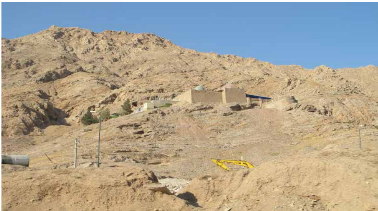
تصویر ۳: نمای کلی زیارت‌گاه بی‌بی شهربانو. عکس: ایو لوژنبول، ۱۳۹۳.

در طیف وسیعی از گردشگری آیینی، آداب و سنن وابسته به بستری هستند که این آیین‌ها در آن جاری می‌شوند