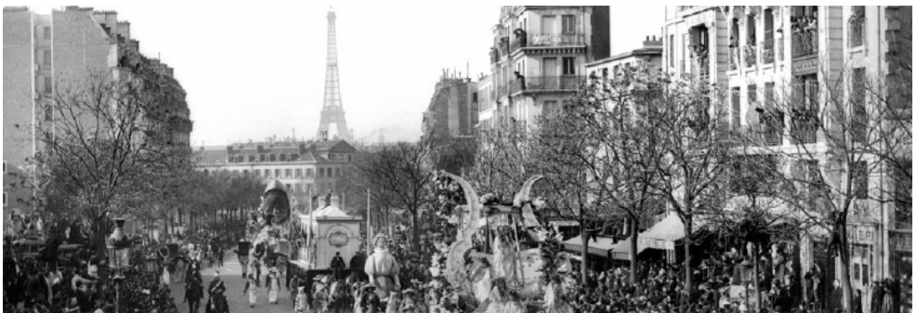
تصویر ۱۲: کارناوال پاریس در دهه ۵۰ میلادی.