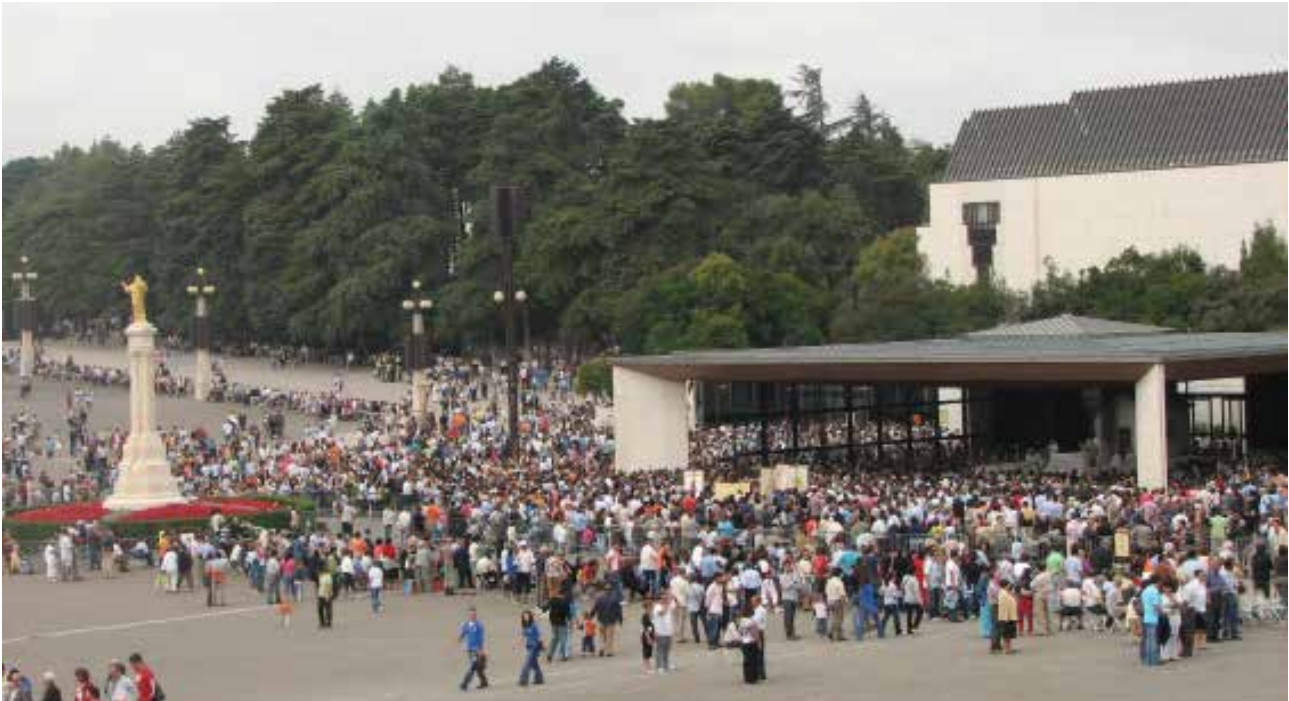
تصویر ۶: زیارتگاه فاطیما، لیسبون، پرتغال.

این روایت به تقدس مکان انجامیده است (تصویر ۱۲). در باور مسلمانان نیز حضرت فاطمه (س) این گونه روایات در ارتباط با اماکن مقدس در جوار کوه، چشمه یا درخت خاص وجود دارد که غالباً به باورهای پیش از اسلام بازمی‌گردد. در گذر زمان این مکان‌های زیارتی به گردشگاه‌های آیینی تبدیل شده‌اند و توانسته‌اند روح مکان و باورهای معتقدان را در قالبی نو حفاظت کنند.