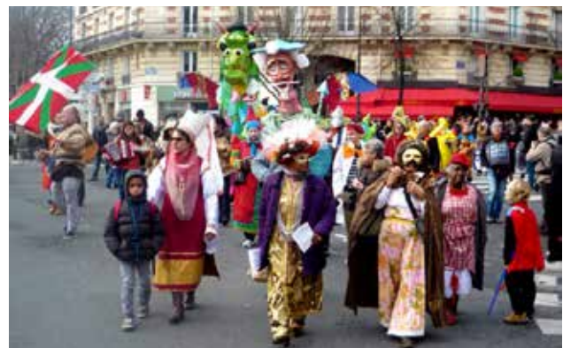
تصویر ۱۲: کارناوال پاریس.