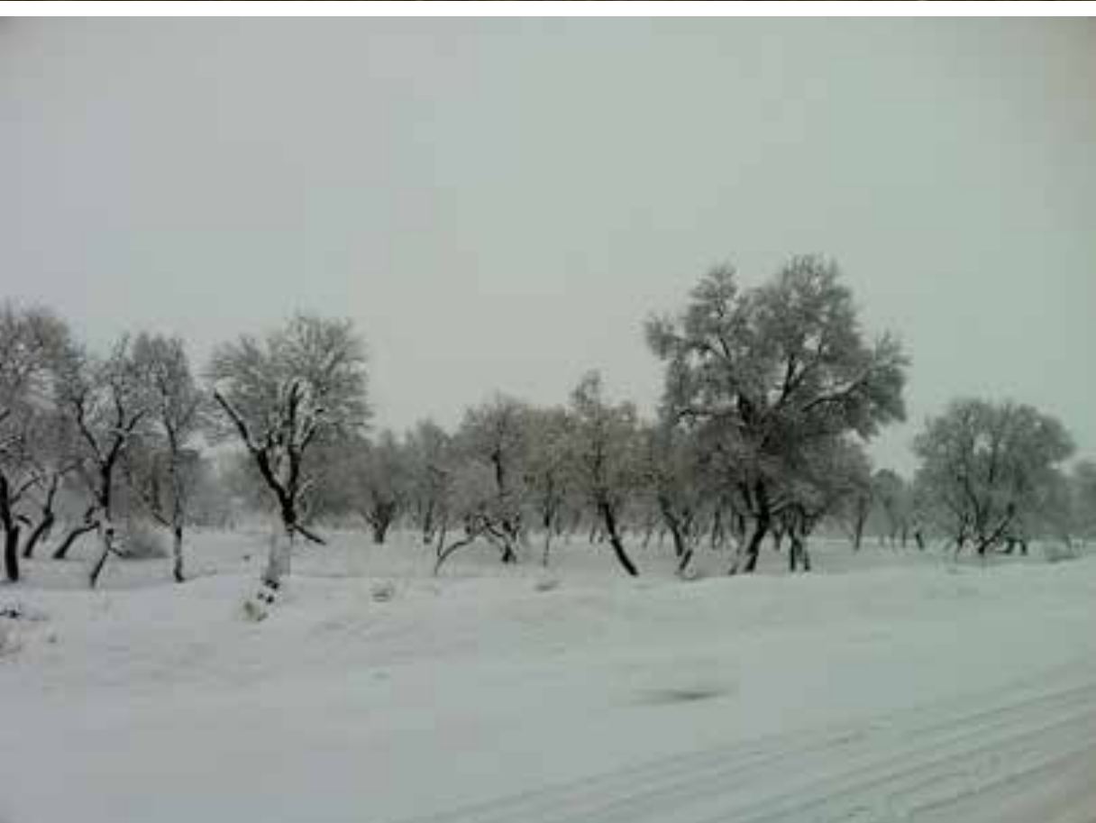
تصاویر ۲، ۱ و ۳: فصول مختلف سال در باغستان سنتی قزوین از انتهای یکی از کوچه‌های لبه قسمت شرقی شهر. عکس: نگارنده، زمستان ۹۵ و بهار ۹۶.

مقدمه | سازگاری اقلیمی، اساس شکل‌گیری شهرها است. گرچه دشت قزوین سابقه‌ای نه‌هزارساله در میزبانی انسان یکجانشین در دل خود دارد، ولی همیشه چالش ناسازگاری‌های اقلیمی برای ایجاد سکونتگاهی پایدار در آن وجود داشته است. وجود بادهای مزاحم و خشک کویری از جنوب دشت قزوین، نبود رودخانه‌های دائمی، بارندگی‌هایی که به دلیل شیب طبیعی زمین در آن سیل به راه می‌اندازد، از جمله دشواری‌های اقلیم این سرزمین است. انسان متمدن برای بقای خود راه‌هایی کشف می‌کند تا نخست از آسیب‌های طبیعت در امان بماند، سپس آن را به خدمت خود درآورد. قرآن کریم می‌فرماید: «الم تروا ان الله سخر لکم ما فی السموات و ما فی الارض (آیا ندیدید که خداوند هر آنچه در آسمان‌ها و زمین است را به تسخیر شما درآورد؟)» (قرآن کریم، ۱۳۹۰: ۴۱۳). جدال با طبیعت و مهار کردن آن در دشت قزوین، برای انسان یکجانشین گرچه بیش از هفت هزار سال طول می‌کشد ولی نتیجه‌اش ایجاد تمدنی پایدار به نام شهر قزوین است. باتدبیر انسان یکجانشین، طبیعت ناآرام برای زندگی انسان، به طبیعتی اهلی، برای ماندگاری انسان تبدیل می‌شود. به دیگر سخن راهکار اصلی انسان یکجانشین در دشت قزوین بهره‌گیری از خود طبیعت برای رام کردن طبیعت بود؛ از نمونه‌های منحصر به فرد این‌گونه اقدامات، ایجاد باغستان سنتی قزوین بود؛ طبیعتی مصنوع که برای پایداری شهر قزوین ایجاد شده است و تا امروز این نقش حیاتی را باوجود ناملایماتی شهری ادامه می‌دهد (تصاویر ۱، ۲ و ۳).