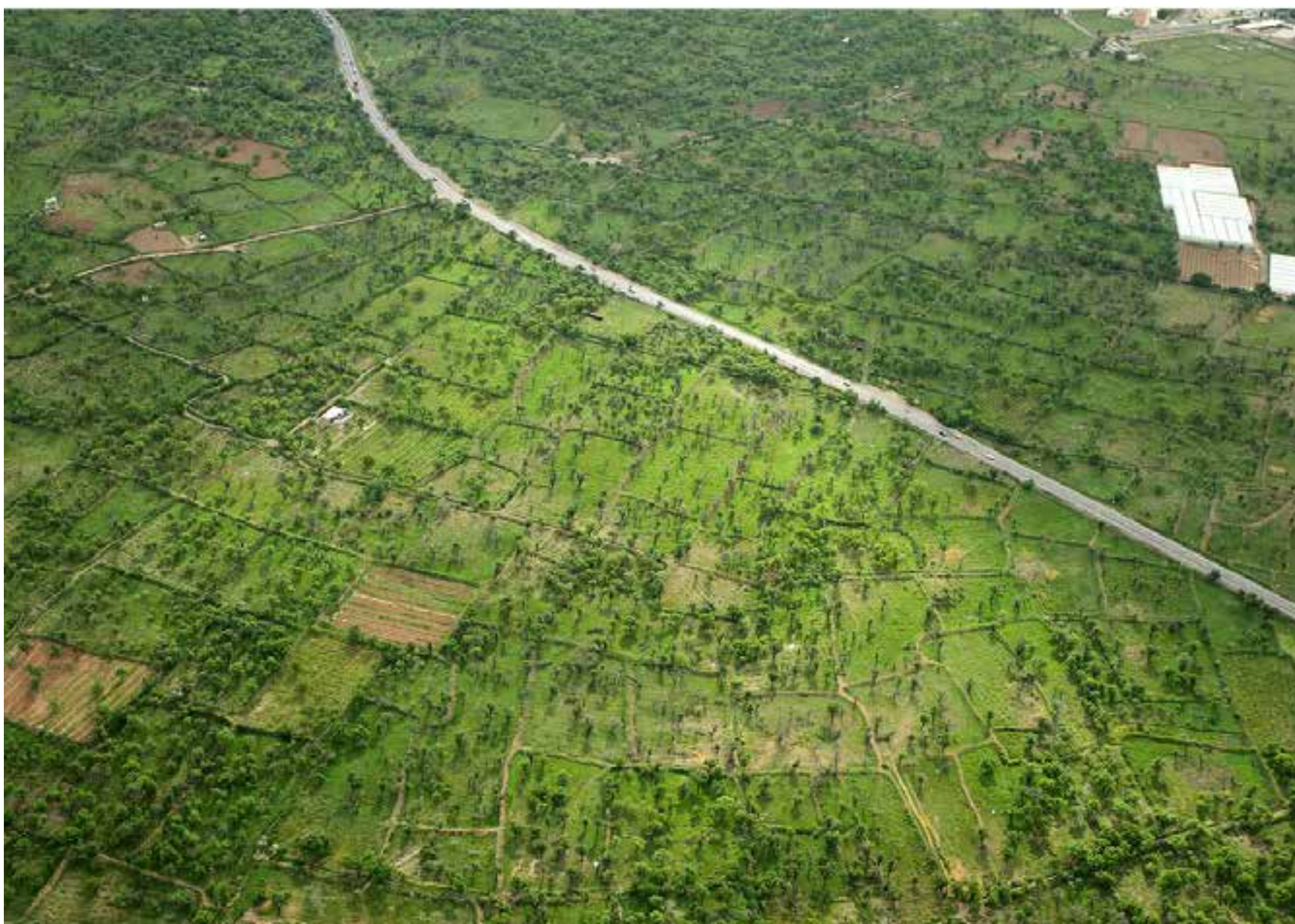
تصویر ۷: نوع استفاده از زمین و کرت بندی قطعات در گوشه‌ای از باغستان سنتی. عکس: عرفان دادخواه، ۱۳۹۰.

بادهای مزاحم قرار نگیرند. «در مجموعه زاغه حدود ۲۱ خانه به‌دست‌آمده است. جهت طولی این خانه‌های مستطیل شکل در نقشه، شمال شرقی به جنوب شرقی و یا بالعکس است. انتخاب این جهت با توجه به جهت بادهای دائمی راز و مه (باد راز باد گرم کویری و باد مه باد سرد) دشت قزوین بوده. در اینجا عرض خانه‌ها در مقابل باد قرار می‌گرفته که دارای سطح کمتری بوده‌اند. این جهت مانع نفوذ بادهای یادشده می‌شد» (ملک شه‌میرزادی، ۱۳۶۶). راهکار باغستان سنتی قزوین در مهار بادها با خانه‌های تپه زاغه متفاوت است. باغستان با محاط نمودن شهر قزوین در دل خود، گردوغبار، سرعت و خشکی باد راز (باد گرم کویری) را مهار نموده و آن را تبدیل به نسیمی ملایم و لطیف برای شهر می‌نماید. باغستان در فصل وزش باد مه (باد سرد) نیز باعث گرفتن سرعت و سوز آن در نتیجه ملایمت وزش آن به شهر می‌شود.