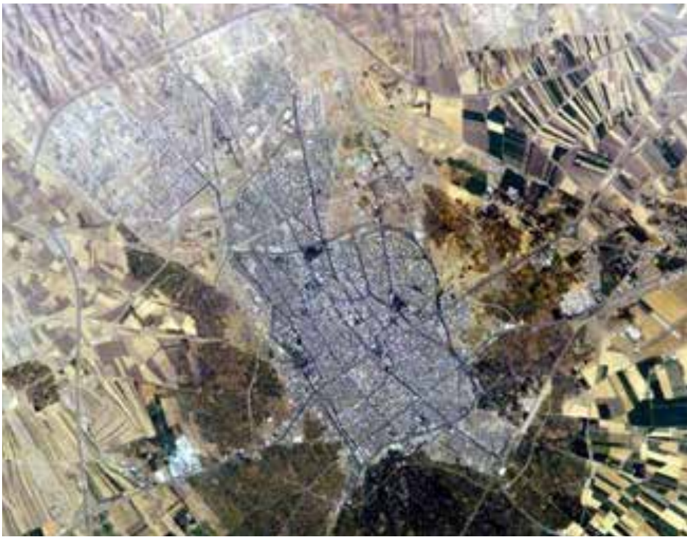
تصویر ۵: عکس هوایی قزوین که شکل نعل اسبی باغستان را در دوران معاصر نشان می‌دهد.

قطعات آن است. خاک‌ریزی لب کرت‌ها در باغ‌های باغستان در حدود یا بیشتر از نیم‌تنه انسان معمولی است و قطعات با توجه به شیب طبیعی زمین در ارتفاع‌های متنوعی قرار گرفته است (تصویر ۷).