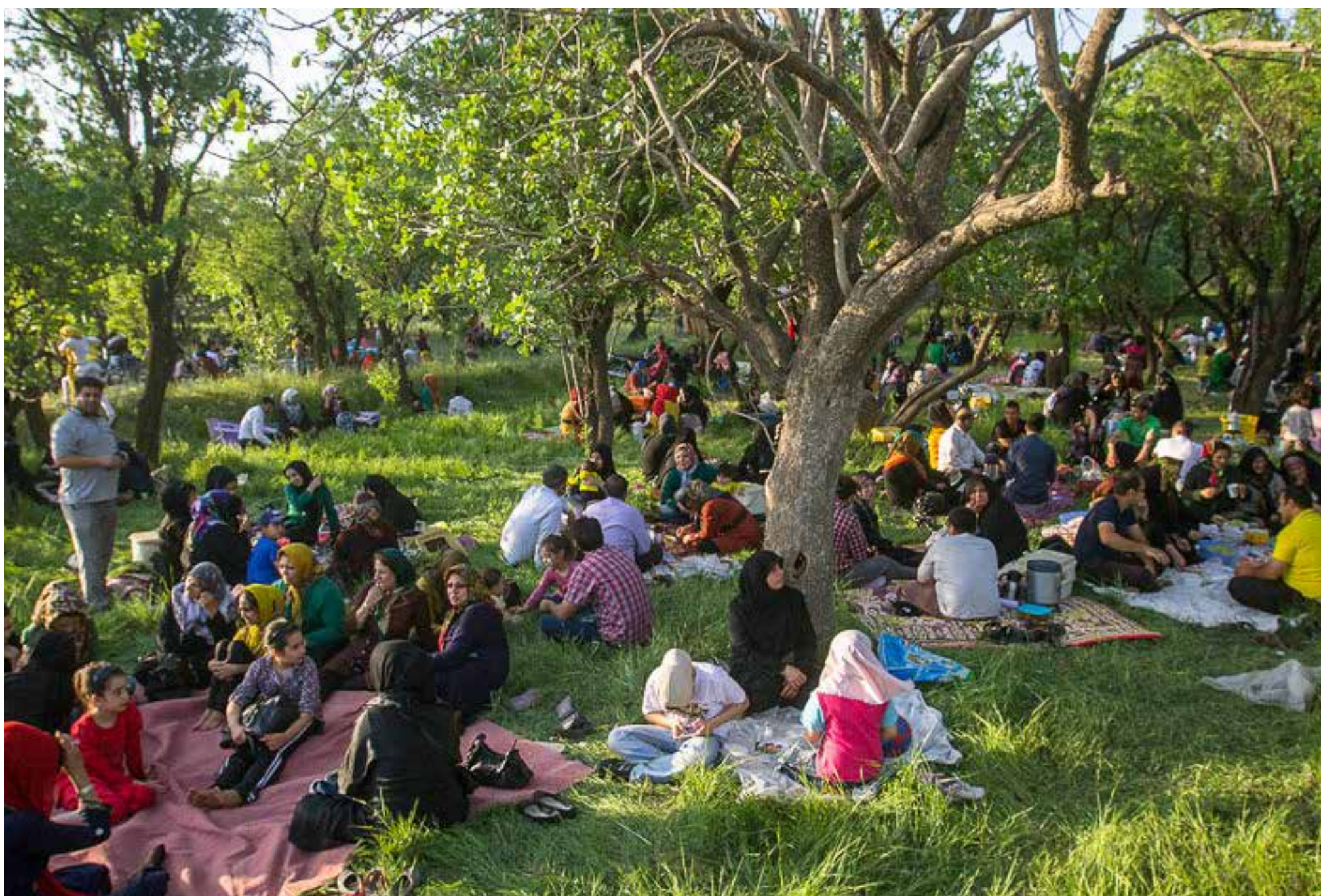
تصویر ۹: حضور مردم شهر در مراسم پنجاه بدر در باغستان سنتی قزوین. عکس: مهدی مجتهد، ۱۳۹۱.

فرآیندهای خاک‌زایی، جذب آلاینده‌ها، نگهداشت و ذخیره آب، کنترل سیلاب، زیبایی دید و منظر و ارزش‌هایی چون ارزش تفریحی، ارزش زیستگاهی، ارزش وجودی، ارزش انتخاب و ارزش میراثی، و امکان محاسبه تمایل به پرداخت افراد برای بهره‌مندی از این خدمات و ارزش‌ها، می‌تواند ارزش واقعی این باغات را نمایان ساخته و در تحلیل هزینه و منفعت مانع از تغییر کاربری و نابودی باغات گردد. بر اساس تحقیقاتی که مشاور شارستان در سال ۱۳۸۸ انجام داده است، ارزش سالانه هشت خدمت اکوسیستمی باغستان سنتی قزوین معادل ۵/۵۴۶/۸۴۰ ریال در هر هکتار و ۱/۳۸۶/۷۱۰ هزار تومان برای کل باغات سنتی در سال است (مهندسین مشاور شارستان و اوربان سولوشنز، ۱۳۸۸: ۴۰).