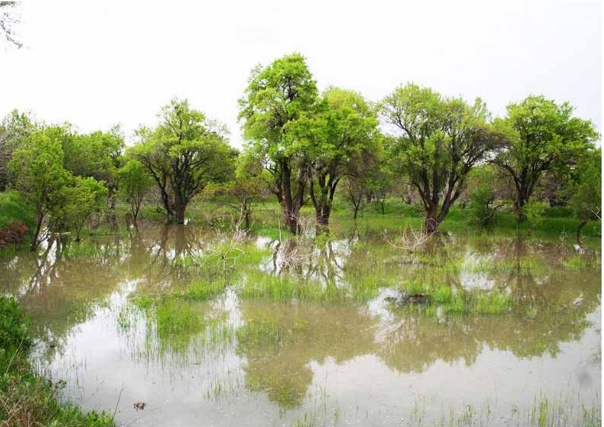
تصویر ۸: باغستان سنتی قزوین و مهار سیلاب و ذخیره آن برای روزهای کم‌آبی.